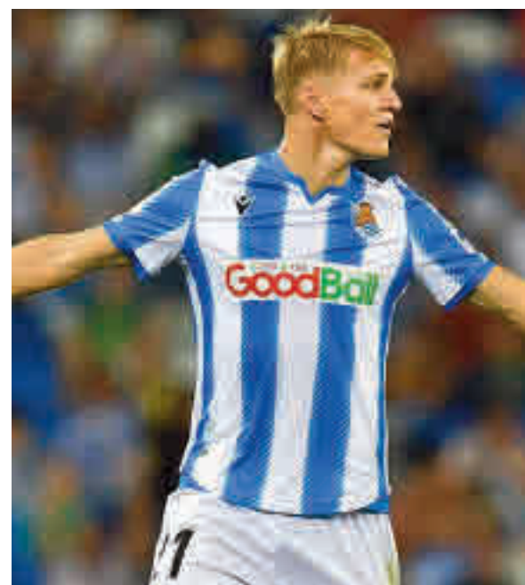
Un partido especial: Este Real Sociedad-Real Madrid podría servir para ver el regreso de David Silva al campeonato español, aunque si hay un nombre que sobresale en la previa ese es el del noruego Martin Ødegaard, que el año pasado cuajó una gran temporada como cedido en el cuadro 'txuri-urdin'.

Por su parte, el Getafe comienza su andadura recibiendo este sábado (18:30 horas) a un Osasuna que en la primera jornada ya mostró sus credenciales al imponerse a domicilio al Cádiz (0-2). Será, por tanto, un buen test para examinar un nuevo proyecto azulón que tiene, sobre todo, grandes novedades en la delantera, con Enes Ünal y 'Cuchito' Hernández opositando para robarles la titularidad a Jaime Mata y Ángel Rodríguez. Quien no estará seguro es el centrocampista Fayçal Fajr, quien ha rescindido su contrato con el 'Geta'.