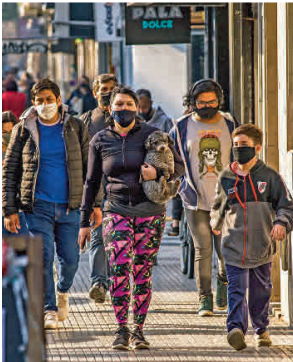
Algunos ciudadanos verán limitados sus movimientos

Según explicó, aunque “la situación asistencial está estable y hay margen de acción” y “los datos actuales indican una “tendencia a estabilizar el número de infectados”, la Comunidad “quiere adelantarse”, y “tomar medidas para intentar disminuir esa curva” de cara a la llegada del otoño y el