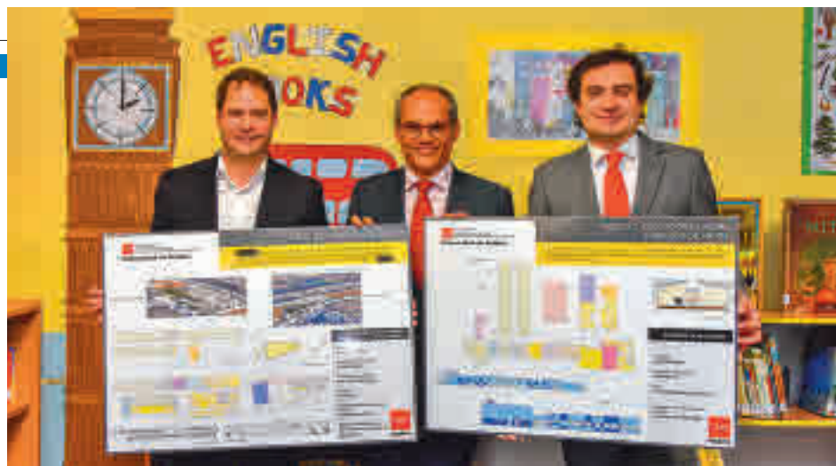
Presentación del proyecto en marzo de 2019

La Comunidad le ha asignado un presupuesto de 4,8 millones ● Entrará en funcionamiento el próximo curso escolar