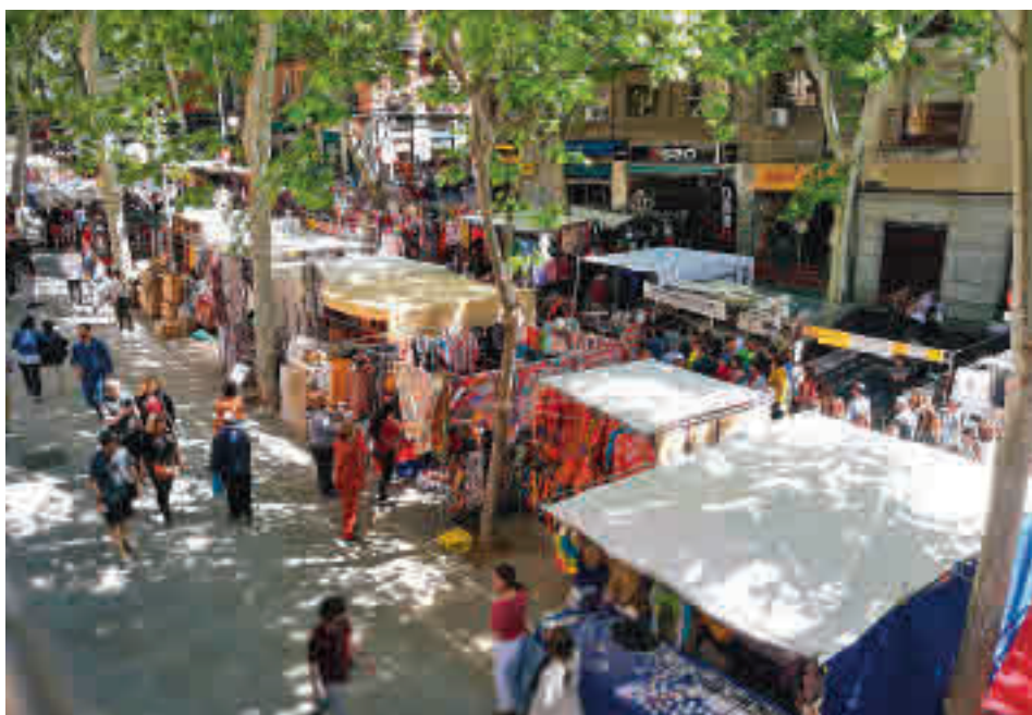
El Rastro regresará en breve al Centro de la capital