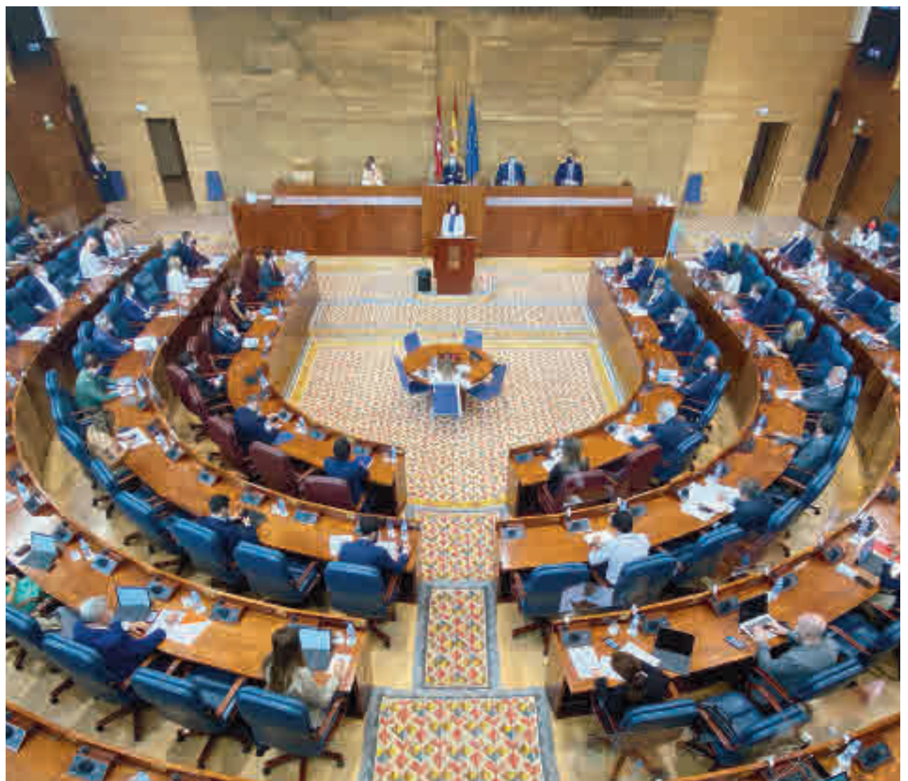
Isabel Díaz Ayuso interviene en el Debate sobre el Estado de la Región

Ayuso señaló que 248 pisos del Parque de Vivienda Social ya se están ejecutando,