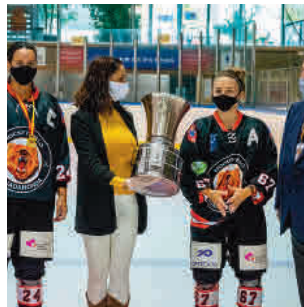
Las mascarillas también son obligatorias en este deporte

Obradoiro, hora y media antes de que debute el flamante campeón de la Supercopa, el Real Madrid, que visita al Gipuzkoa Basket. Cierra el menú el 'Estu', que recibirá este domingo (12:30 horas) al BAXI Manresa.