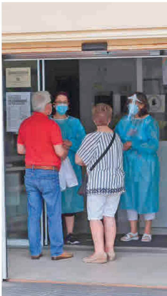
Los centros de salud de la zona están saturados

A estas reivindicaciones se unió posteriormente la alcaldesa de Móstoles, Noelia