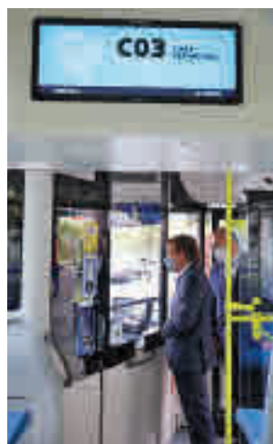
El alcalde monta en el bus

Esta línea funcionará entre las 7 y las 23 horas y tardará entre 37 y 42 minutos en cubrir todo el trayecto, en fun-