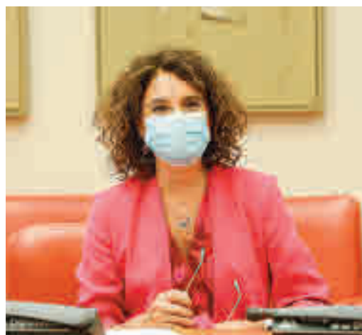
María Jesús Montero, ministra de Hacienda

EL PERIÓDICO GENTE NO SE RESPONSABILIZA NI SE IDENTIFICA CON LAS OPINIONES QUE SUS LECTORES Y COLABORADORES EXPONGAN EN SUS CARTAS Y ARTÍCULOS