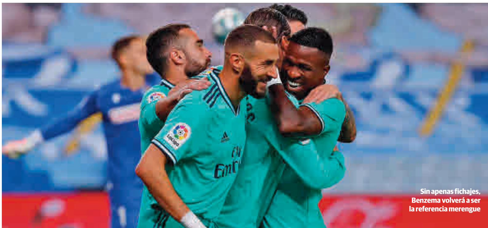
Sin apenas fichajes, Benzema volverá a ser la referencia merengue

EL MADRID SOLO HA CAÍDO EN DOS DE SUS ÚLTIMAS VISITAS A SAN SEBASTIÁN