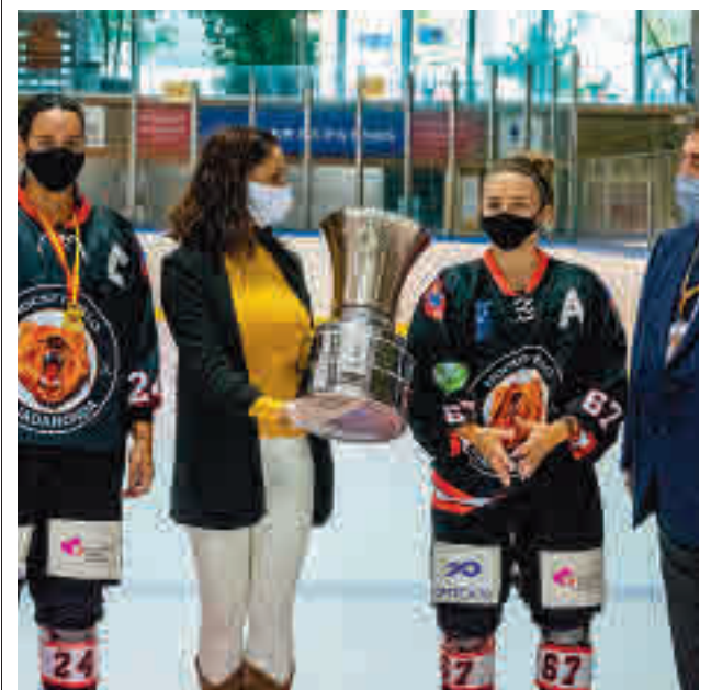
Las mascarillas también son obligatorias en este deporte

Obradoiro, hora y media antes de que debute el flamante campeón de la Supercopa, el Real Madrid, que visita al Gipuzkoa Basket. Cierra el menú el 'Estu', que recibirá este domingo (12:30 horas) al BAXI Manresa.