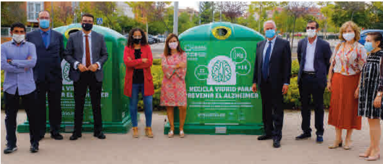
Imagen del acto de presentación