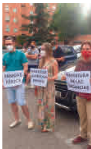
Imagen de la protesta

nidad pública. La preocupación de los tricantinos se debe a que los servicios de Urgencias de los centros de salud no están operativos y a la falta de personal en la Atención Primaria, el primer dique de contención para evitar que la