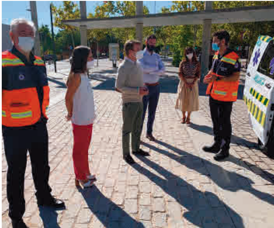
El alcalde de Tres Cantos, Jesús Moreno, junto a la unidad móvil

Un buen ejemplo de ello es la medida llevada a cabo por el Consistorio tricantino, que ha puesto a disposición de los centros escolares de la localidad una unidad móvil de enfermería mientras dure la crisis sanitaria. El objetivo es ayudar a los colegios e institutos públicos de Tres Cantos en el cumplimiento de las medidas de seguridad y protección frente a la Covid-19. Se trata de un vehículo medicalizado que presta apoyo al enfermero escolar, encargado de unificar y coordinar, junto con Protección Civil Tres Cantos y los centros de salud