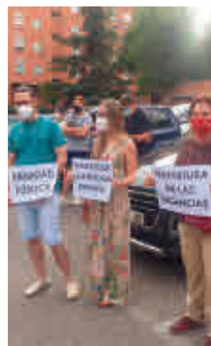
Imagen de la protesta

En este sentido, los manifestantes apuntan al Gobierno regional, concretamente a la Consejería de Sanidad. A su entender, si existiera más personal en los centros de salud de la localidad se podrían atender sin problema los casos propios de Urgencias, así como las consultas rutinarias que normalmente prestaba la Atención Primaria hasta hace unos meses.