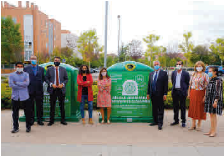
Imagen del acto de presentación