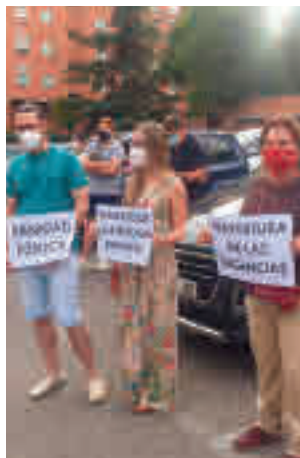
Imagen de la protesta

En este sentido, los manifestantes apuntan al Gobierno regional. A su entender, si existiera más personal en los centros de salud de la locali-