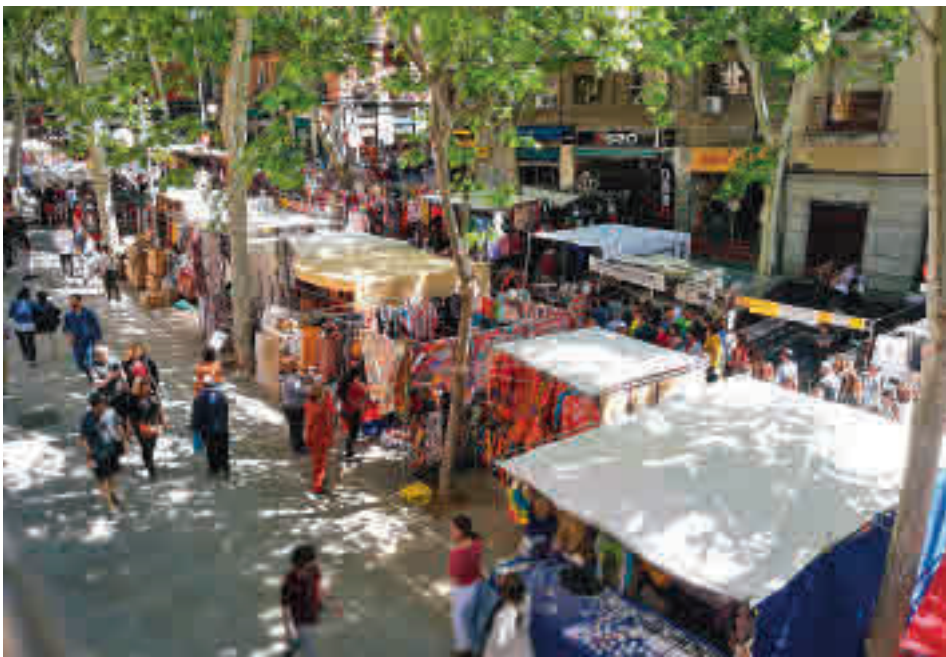
El Rastro regresará en breve al Centro de la capital