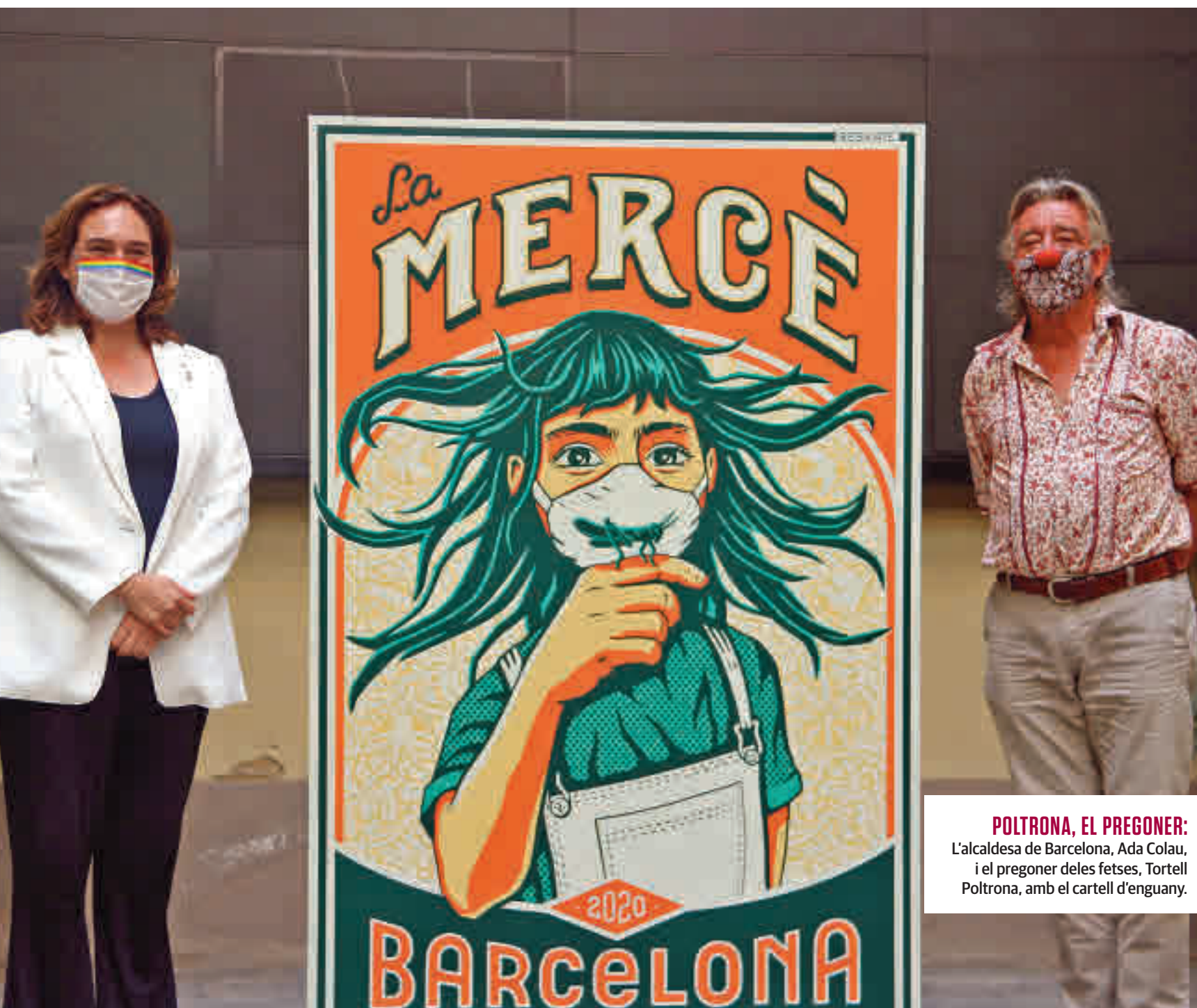
POLTRONA, EL PREGONER: L'alcaldesa de Barcelona, Ada Colau, i el pregoner de les festes, Tortell Poltrona, amb el cartell d'enguany.

EL PROGRAMA BUSCA EVITAR AGLOMERACIONS DE PERSONES I DESPLAÇAMENTS