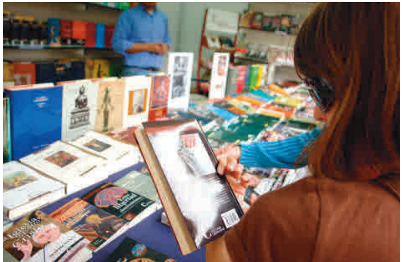
Madrid no ha podido disfrutar este año de su habitual Feria del Libro