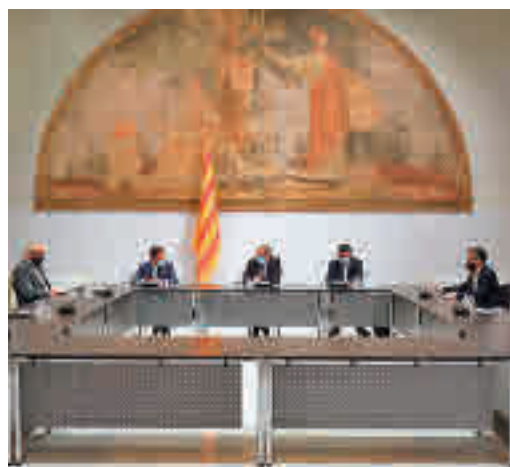
Taula amb el Govern i els agents econòmics.

EL PERIÓDICO GENTE NO SE RESPONSABILIZA NI SE IDENTIFICA CON LAS OPINIONES QUE SUS LECTORES Y COLABORADORES EXPONGAN EN SUS CARTAS Y ARTÍCULOS