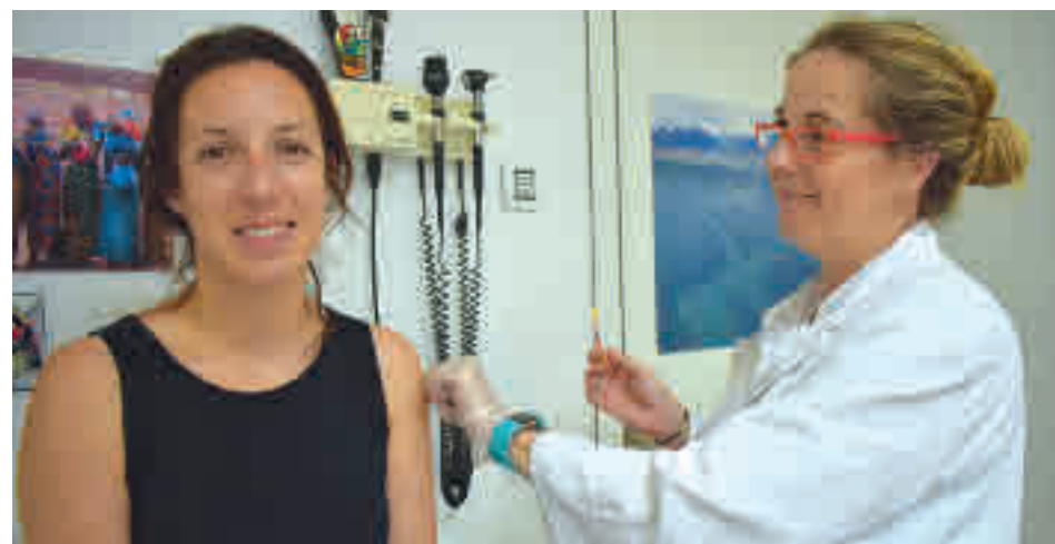
Un dels problemes és que es col·lapsin els CAPs.

D'altra banda, però, el Departament de Salut de Catalunya es planteja canviar d'ubicació la campanya de vacunació de la grip i deixar de fer-la als centres d'atenció primària (CAP), on s'acostuma a fer. Una opció es traslladar les vacunacions a equipaments municipals com casals d'avis o centres cívics.