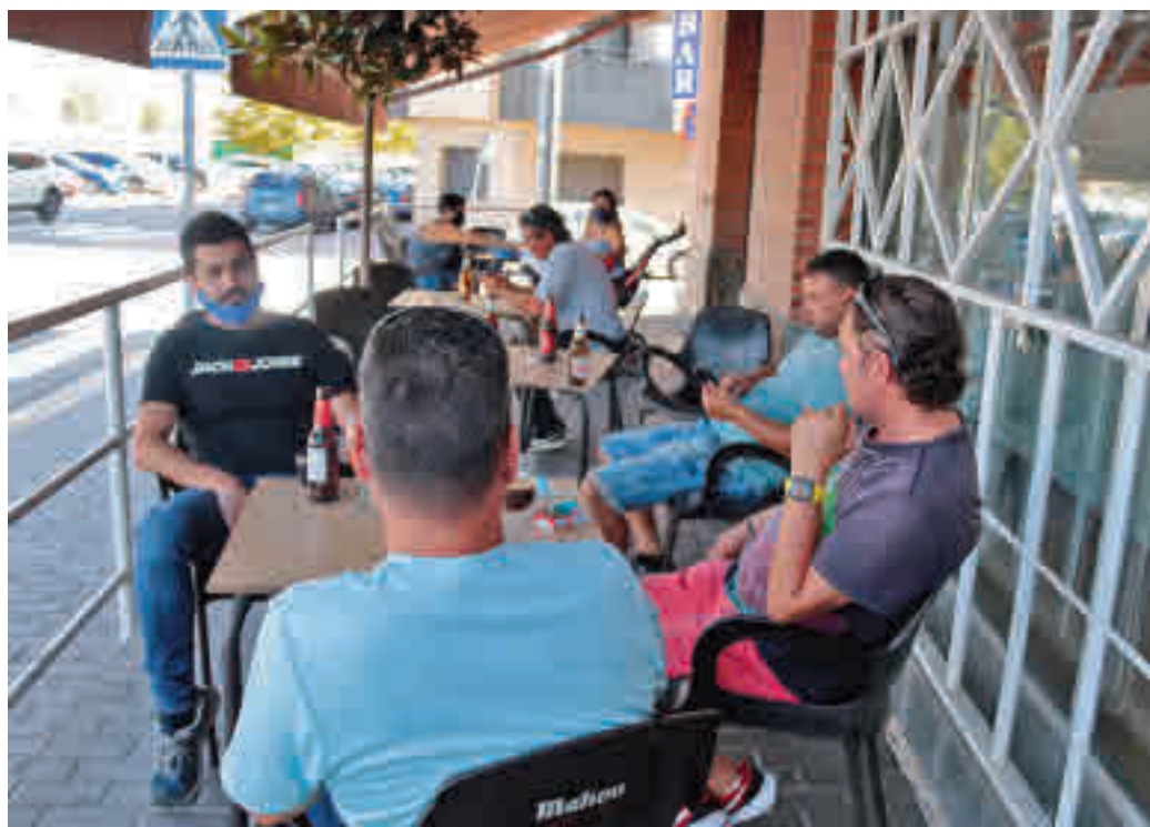
Evitar reunions de més de 6 persones és una nova proposta per frenar el virus.

La situació de la Covid-19 no millora a Catalunya i l'em-