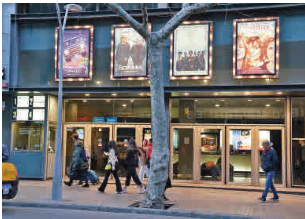
Les sales de cinema podran donar cabuda a més espectadors.

EL GOVERN HA ACORDAT DECLARAR LA CULTURA "BÉ ESSENCIAL".