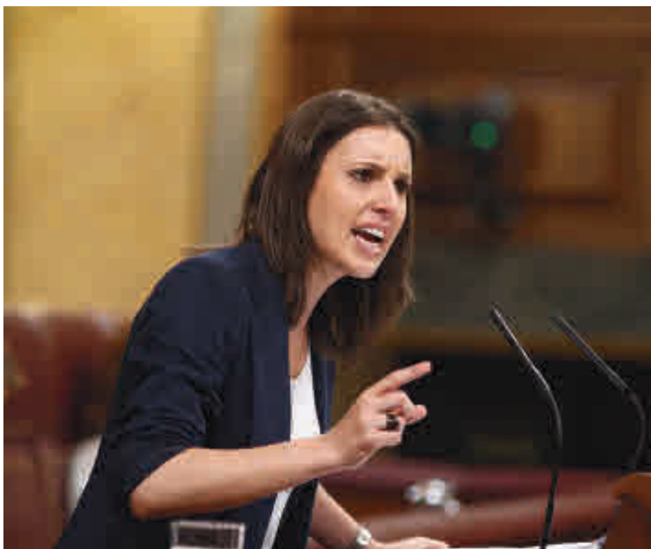
Segons la ministra Montero la llei vol acabar amb la impunitat dels proxenetes.