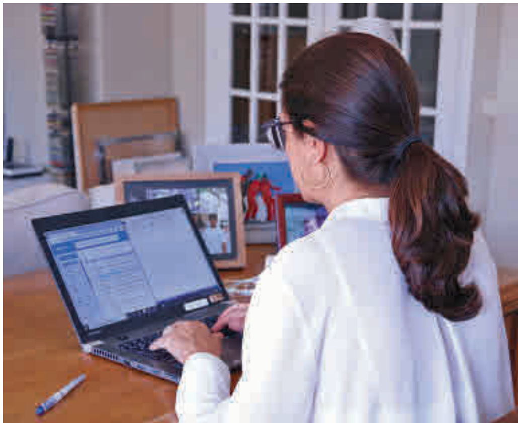
La regulació del teletreball entrarà en vigor el 13 d'octubre.

El text preveu que perquè un treballador pugui acollir-se a la normativa del teletreball haurà de fer-ho en un 30% de la seva jornada laboral durant un període de tres mesos o el percentatge equivalent en funció de la duració del contracte de feina. El que