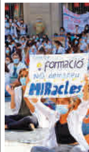
Protesta dels MIR.

Díaz ha celebrat l'acord i ha agraït als agents social la seva disposició. "S'hi han deixat la pell", assegura. En aquest sentit, la ministra ha dit que el text "inaugura" una "onada de reformes legislatives" orientades al segle XXI a l'avantguarda de les legislacions europees.