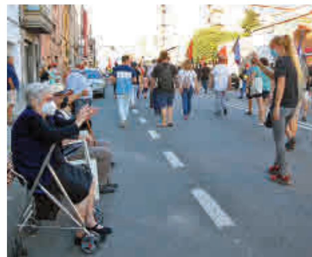
Entre els 65 als 69 anys el 46,1% viuen amb parella. ACN

Per aquest motiu la Llei anirà acompanyada d'un "Pla Nacional Integral, Social, Laboral i Econòmic" per garantir els drets de les dones a través d'un acompanyament individualitzat. Els oferirà, entre altres, alternatives habitacionals. El govern espanyol actua en la direcció que ja fa anys que assenyalava la fiscalia, que manifestava la necessitat d'una reforma que permeti perseguir de manera eficient l'explotació de la prostitució i els que se'n beneficien.