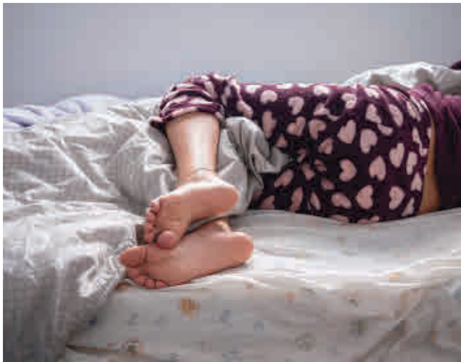
El consum sovintejat és superior entre nois i es produeix en la intimitat i continguts online.

Segons aquest estudi, les relacions en grup entre companys són clau en la iniciació al consum de pornografia, posteriorment es busca de manera intencional per resoldre dubtes i continuen visualitzant-la per satisfer el desig sexual. En aquest sentit,