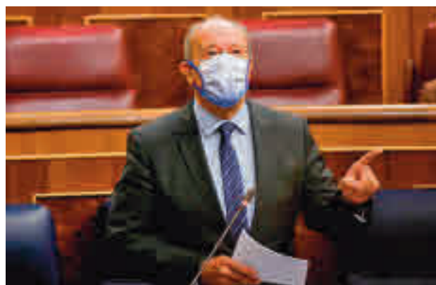
El ministre de Justícia, Juan Carlos Campo.