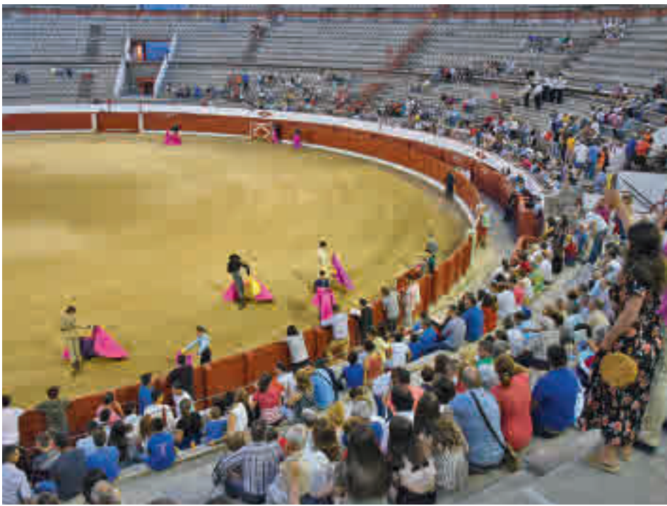
Imagen de anteriores ediciones