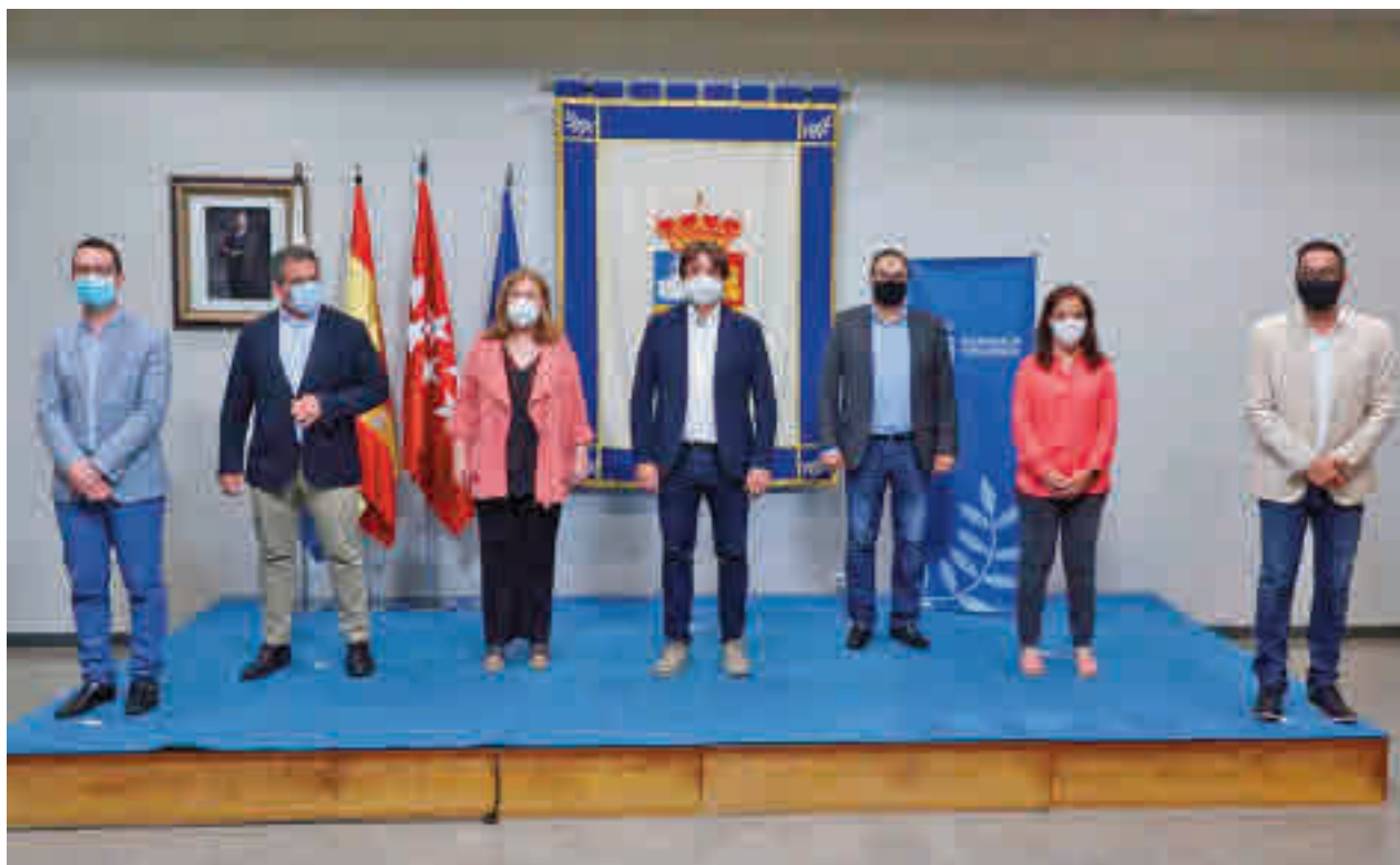
Los alcaldes del Sur se reunieron en Fuenlabrada

Fuenlabrada y Getafe, dos de los municipios afectados directamente, han llegado a pedir al consejero de Sanidad, Enrique Ruiz Escudero, “información detallada acerca de los datos de contagios de todas las áreas sanitarias