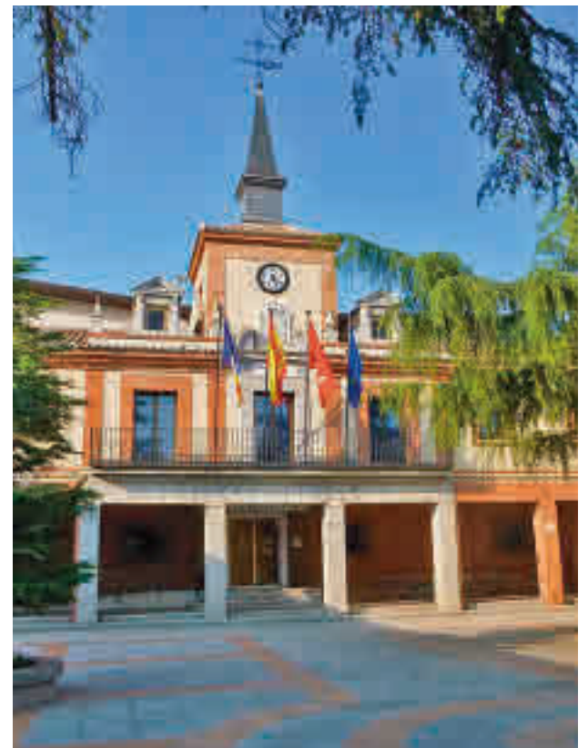
Ayuntamiento de Las Rozas