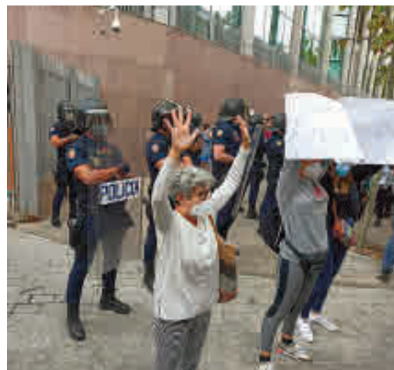
Protesta en la Asamblea de Madrid

Sobre esta posibilidad se manifestó Zapatero, apuntando que el objetivo del Gobierno regional es "evitar el confinamiento". Algo en lo que coincidió la presidenta, Isabel Díaz Ayuso, que señaló en una entrevista que hará "lo que sea" para acabar con el virus, pero que el estado de alarma sería "la muerte para Madrid".