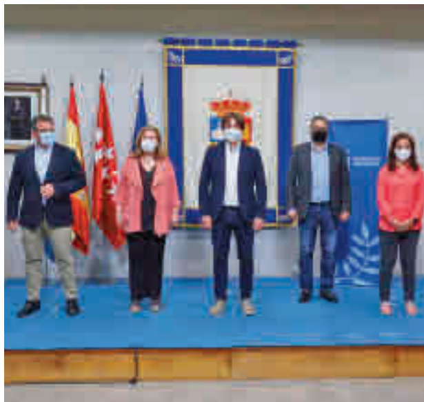
Los alcaldes del Sur se reunieron en Fuenlabrada

Justo antes de que se conocieran las medidas del Gobierno regional, los alcaldes socialistas de Fuenlabrada, Getafe, Alcorcón, Móstoles, Leganés, Parla y Pinto se reunieron en el Ayuntamiento fuenlabreño para pedir a la presidenta de la Comunidad, Isabel Díaz Ayuso, "coordinación" para