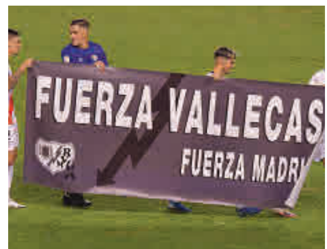
Los jugadores del Rayo saltaron con una pancarta

unidades. Los alfareros, que la semana pasada se imponían al Tenerife (2-0), viajan al campo del Málaga, mientras que el Fuenlabrada regresa al Fernando Torres (sábado, 20:30 horas) para recibir al Albacete después de su empate en Las Palmas (3-3). Por su parte, el Leganés también jugará como local (domingo, 20:30) ante el Cartagena.