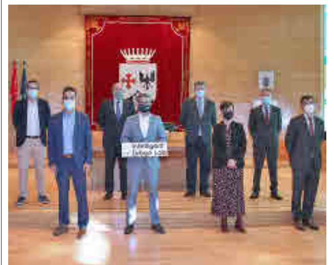
Presentación de Intelligent Urban Lab

En el acto de inauguración, el ministro Pedro Duque adelantó que desde el Gobierno central "seguiremos ayudando en todo lo que podamos a vuestra industria y a todo el sector biotecnológico para construir un sistema más sólido en el que podamos después confiar para el futuro. es el momento de llegar a un acuerdo para incrementar los esfuerzos que hacemos las administraciones". Por su parte, el vicepresidente regional, Ignacio Aguado, incidió en que la presencia de Algenex supone "una garantía geoestratégica para que en el casol como en el que vivimos existan problemas de abastecimiento".