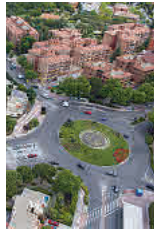
Rotonda de Baunatal

Según este amplio estudio, San Sebastián de los Reyes es el tercer municipio español de más de 80.000 habitantes más seguro para conductores, peatones y ciclistas, al registrar una tasa de mortalidad de 0,23 fallecidos por cada 100.000 residentes entre los años 2014 y 2018. La localidad del Norte de la región