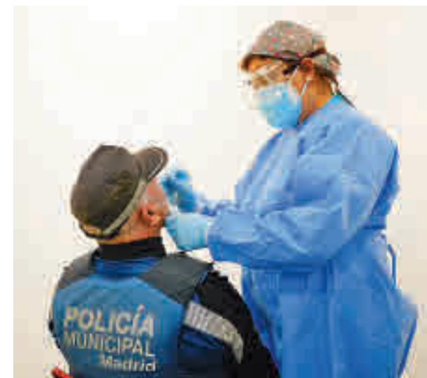
El resultado de los test se conoce en 15 o 20 minutos

En este contexto, los datos de la última semana recogidos en el Informe epidemiológico de la Dirección General de Salud Pública colocan de nuevo a Puente de Vallecas, Carabanchel y Latina como los distritos con más positivos.