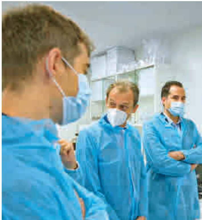
Pedro Duque, junto a Ignacio Aguado en la inauguración

La importancia de la llegada de Algenex radica en que en estos laboratorios de I+D se podrían producir entre 50 y 100 millones de dosis vacunales al año, lo que permitiría a Madrid y a España una independencia en el abastecimiento y situarse como 'partners' industriales frente a los otros socios europeos en la respuesta a pandemias, según valoraban desde el Gobierno regional.