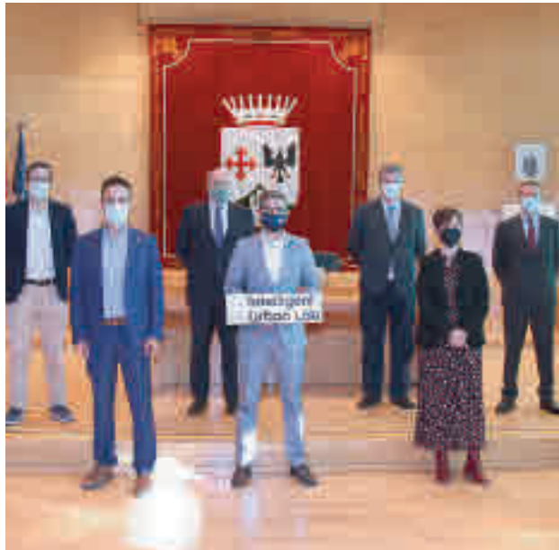
Presentación del Intelligent Urban Lab

Cronológicamente, el primer paso en este sentido tuvo lugar el pasado viernes día 25 de septiembre. El equipo de gobierno del Ayuntamiento (PSOE y Ciudadanos) presentaba un Plan de Acción