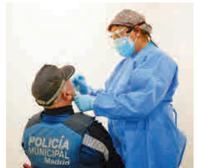
El resultado de los test se conoce en 15 o 20 minutos

En este contexto, los datos de la última semana recogidos en el Informe epidemiológico de la Dirección General de Salud Pública colocan de nuevo a Puente de Vallecas, Carabanchel y Latina como los distritos con más positivos.