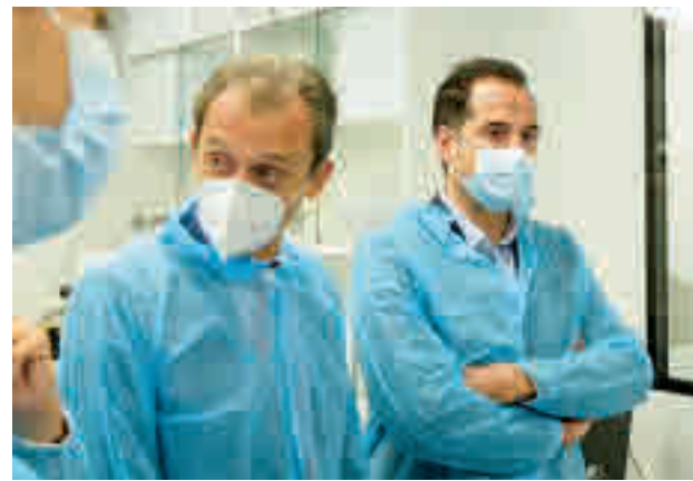
Pedro Duque, junto a Ignacio Aguado en la inauguración

central "seguiremos ayudando en todo lo que podamos a vuestra industria y a todo el sector biotecnológico para construir un sistema más sólido en el que podamos después confiar para el futuro. es el momento de llegar a un acuerdo para incrementar los