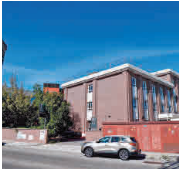
Hotel medicalizado de Leganés

El edificio cuenta con 69 habitaciones y capacidad para 120 enfermos, principalmente personas que necesitan hacer la cuarentena fuera de su hogar y que llegarán derivados desde los hospitales de Getafe, Leganés, Alcor-