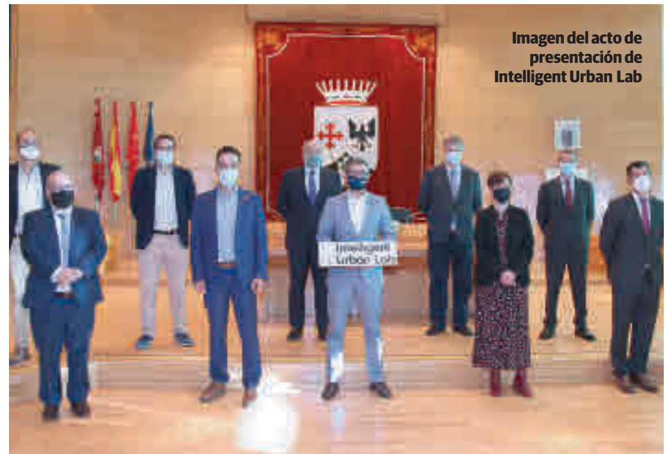
Imagen del acto de presentación de Intelligent Urban Lab

Ese plan fue secundado pocos días después con la presentación del Centro de Innovación Digital. Bajo el nombre de Intelligent Urban Lab, la localidad contará con un ecosistema de cooperación formado por múltiples socios enfocados en oportunidades de innovación para apoyar la transformación digital de empresas y administraciones públicas. De este modo, no solo se mima al ámbito privado de las distintas compañías con sede en Alcobendas, sino