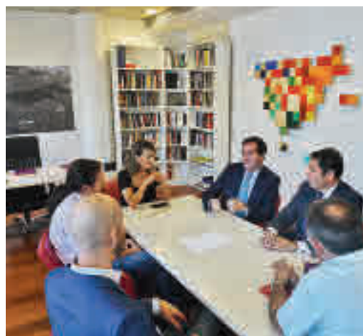
Una de las reuniones con CEOE y Cepyme

EL PERIÓDICO GENTE NO SE RESPONSABILIZA NI SE IDENTIFICA CON LAS OPINIONES QUE SUS LECTORES Y COLABORADORES EXPONGAN EN SUS CARTAS Y ARTÍCULOS