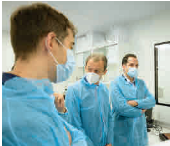
Pedro Duque, junto a Ignacio Aguado en la inauguración

La compañía biotecnológica Algenex ha abierto las puertas de unas nuevas instalaciones en la localidad ● Tendrá un papel clave en las pandemias, aportando hasta 100 millones de dosis