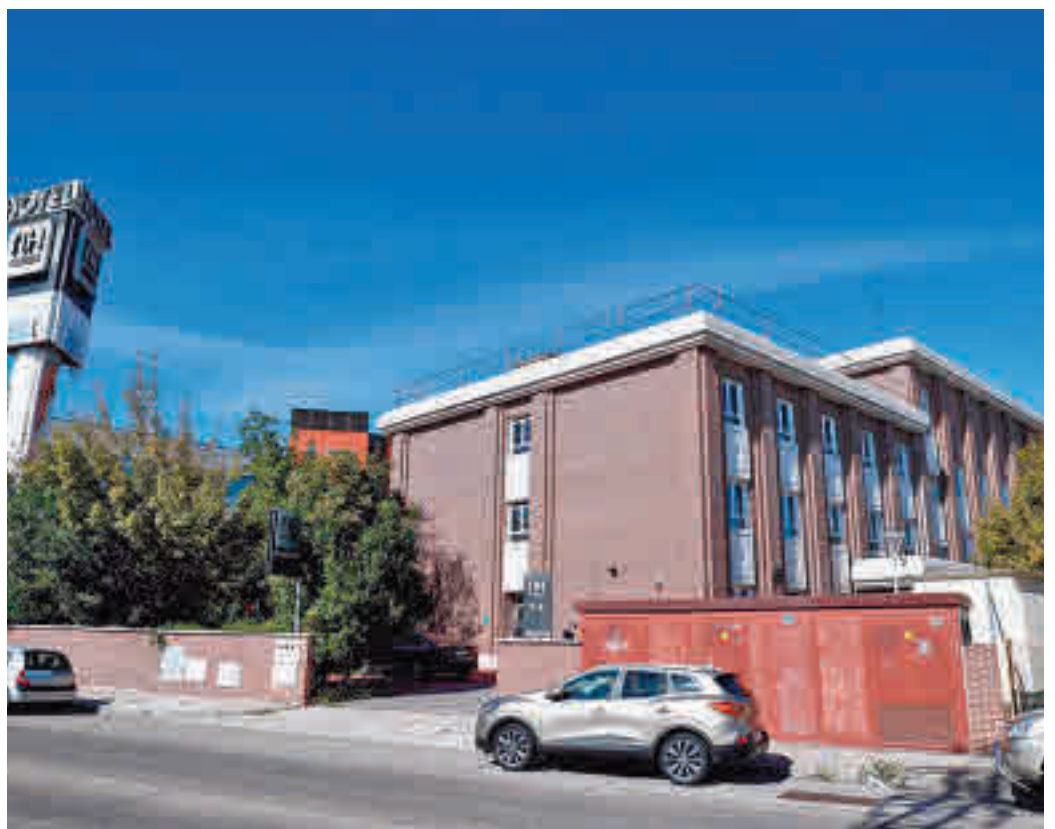
Hotel medicalizado de Leganés

La curva se doblegó, los hospitales se vaciaron y estas instalaciones provisionales se cerraron, pero la llegada de la segunda ola los ha traído de vuelta. En los últimos días ha abierto sus puertas el hotel medicalizado NH de Leganés, que llevaba seis meses sin actividad y que este mar-