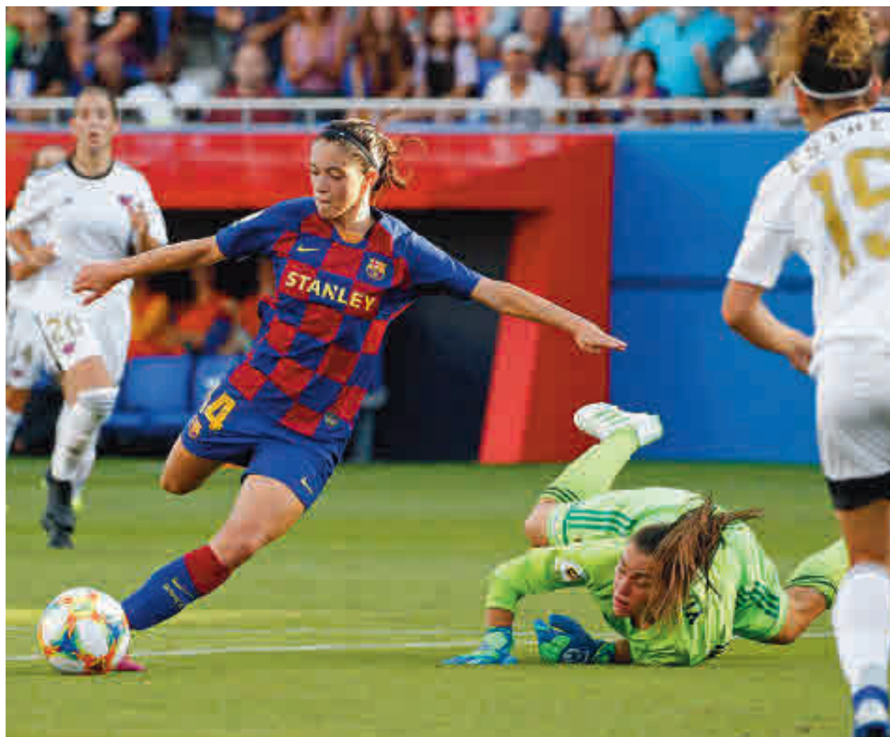
El Barça no dio opción el año pasado al equipo que aún competía bajo el nombre de CD Tacón