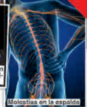
Molestias en la espalda