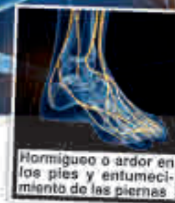
Hormigueo o ardor en los pies y entumecimiento de las piernas