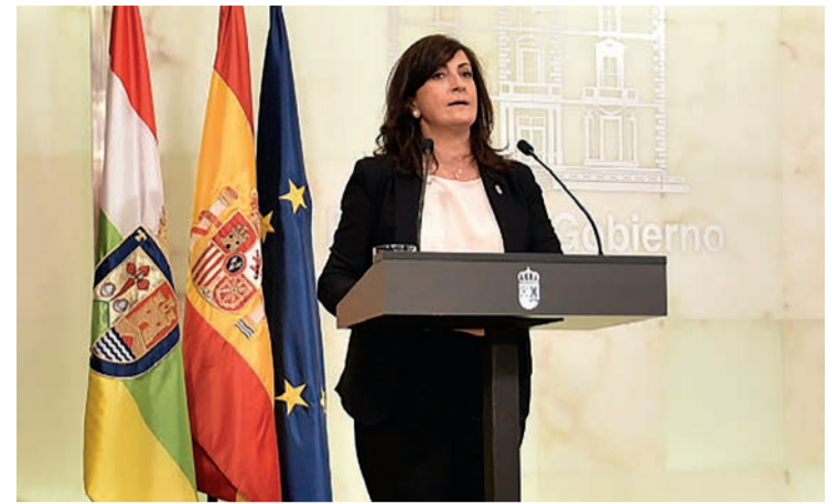
La presidenta de La Rioja, Concha Andreu, anunció las nuevas medidas el martes 29.

Además, se suprimen todas las actividades deportivas colectivas, así como aquellas que tengan lugar en centros y establecimientos deportivos, culturales, artísticos, recreativos, de espectáculos y ocio que concurren en