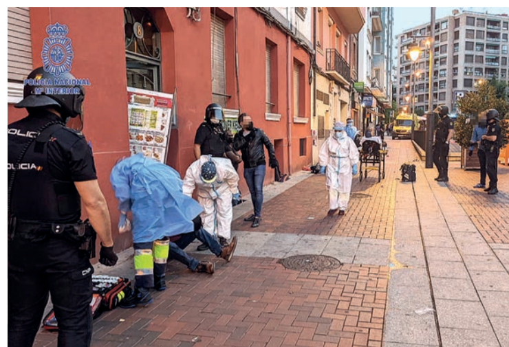
Efectivos de emergencias atendieron a ambos en plena calle el viernes 25 por la tarde.