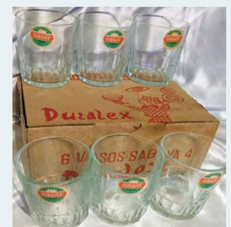
Los clásicos vasos de Duralux.

los he visto por casa de mis padres 'toda la vida'. Recuerdo a mi padre haciendo demostraciones a algún vecino, tirando un vaso al suelo y no se rompía... Si hubiese sido de cristal, se habría hecho añicos. Por eso cuando leí la reciente noticia de que la fábrica francesa de Duralux podría desaparecer, sentí cierta pena o quizás fue nostalgia de aquellos años en que media docena de vasos duraban 'toda una vida'. Creo que también, posteriormente, cogimos media docena de tazas de café con sus correspondientes platillos.