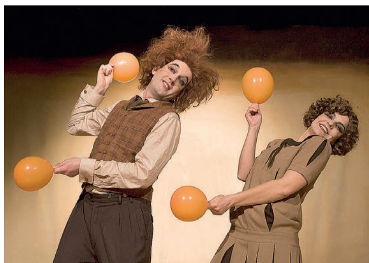
La compañía logroñesa El Perro Azul representará 'Globe Story', el domingo 18.

'El gran traje', de La Sal Teatro. Sala Gonzalo de Berceo (17 y 19 horas).