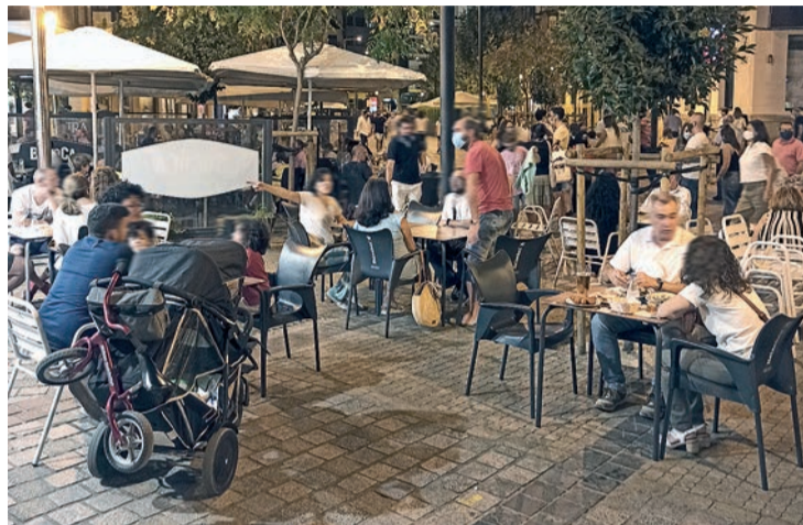
Terrazas en Bretón de los Herreros una noche de sábado de este verano.

Este año se establecieron bonificaciones a favor de empresas cuya actividad sea “de especial interés o utilidad municipal” de acuerdo a diversos criterios. De este modo, 18 industrias han obtenido un descuento del 50% respecto de la cuota que les correspondería, que supondrán 35.929,95 euros a las arcas municipales; 16 sociedades que han mantenido su actividad, pese a las pérdidas en el ejercicio anterior, tendrán el mismo beneficio fiscal, que asciende a 108.175,48, y un total de 3 empresas, que son consideradas centros especiales de empleo, reducen este impuesto a la mitad, 6.440,44. Además, la apuesta de una compañía por fomentar el transporte sostenible entre sus empleados -uso de la bici, coche compartido o pago del transporte público- le supondrá una bonificación del 25%, 7.670 euros; mientras que el aumento de plantilla llevado a cabo por 18 centros laborales conllevará descuentos de entre el 20 y el 50% que suponen el abono del Ayuntamiento de 16.338,60 euros. En total las bonificaciones conce-