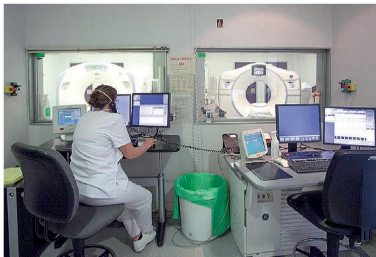
Se estudian opciones para dotar a esta unidad de los efectivos necesarios.

Se calcula que su reinternalización supondrá un coste estimado de 3,76 millones de euros al año,