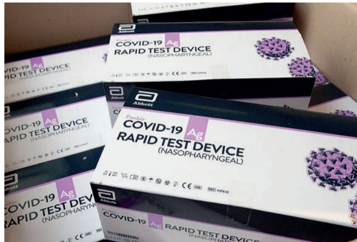
Los nuevos test son más rápidos y más sencillos que las PCR.

"Necesitamos que vuelva al funcionamiento habitual", remarcó el director general de Salud Pública, que admitió que "ahora mismo hay un porcentaje de programación quirúrgica que está suspendida". Además, algunos profesionales están siendo orientados a