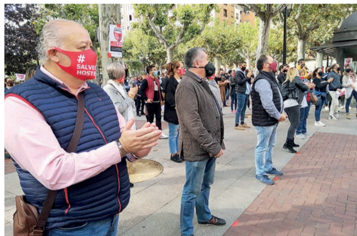
Empresarios y empleados de este sector, concentrados en la Delegación de Gobierno.

Martínez-Bergés instó al Ejecutivo a ampliar los expedientes de regulación temporal de empleo "hasta que todo pueda empezar a funcionar, no solo hasta enero" y demandó un IVA reducido "como en muchos países de Europa", re-