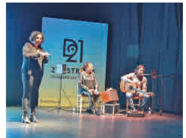
Un momento de la presentación del programa cultural

“Creemos que es nuestra obligación preservar el derecho a la cultura de todos los vecinos de la ciudad y queremos que llegue a todos los barrios, a los del Sur y a los del Norte, a los del Este y a los de Oeste, de ahí el nombre del programa '21DISTRITOS'”, añadió.