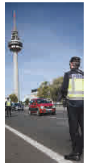
Control en Madrid

“Queda muchísimo por hacer pero las cosas van mejorando”, insistió Ayuso que destacó algunos de los datos que su consejero de Sanidad ha ido desvelando en los últimos días y que el Gobierno central puso en duda en un primer momento. Según estas cifras, la incidencia (número de contagios por cada 100.000 habitantes) en la región habría bajado de 869 a 586 en las últimas dos semanas.