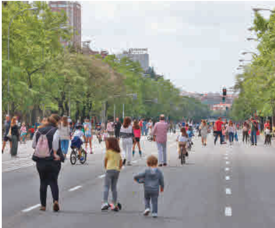
Varios ciudadanos pasean por el Paseo de la Castellana, en una imagen de archivo

RITA MAESTRE: “HAY QUE PROMOCIONAR LAS ACTIVIDADES AL AIRE LIBRE”