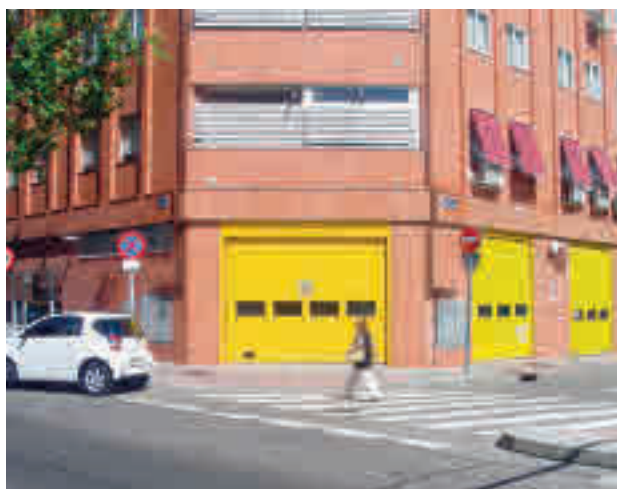
La actual base, situada en la calle de Silvano

el distrito de Hortaleza. Según fuentes municipales, las obras tendrán un plazo de ejecución de 14 meses y el presupuesto base de licitación asciende a 2,3 millones de euros. El nuevo equipamiento se situará en la calle