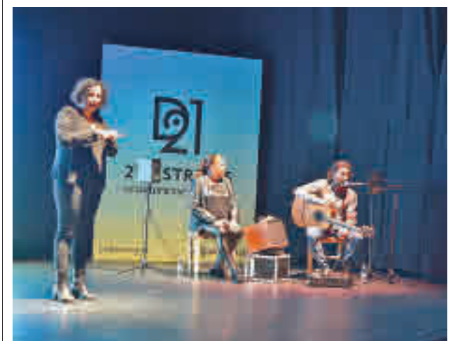
Un momento de la presentación del menú cultural

En sentido salida de la capital, la nueva ruta de autobuses urbanos cuenta con siete paradas y en sentido Sol/Sevilla tiene un total de 12.