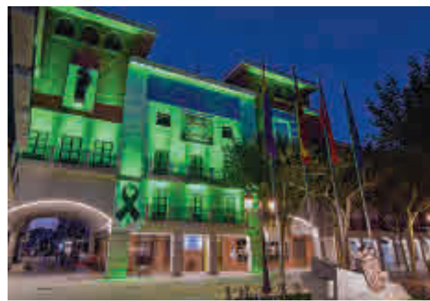
Iluminación verde por el Día Mundial del Ostomizado

Por otro lado, la Concejalía de Educación ha organizado Acogida Educativa, acti-