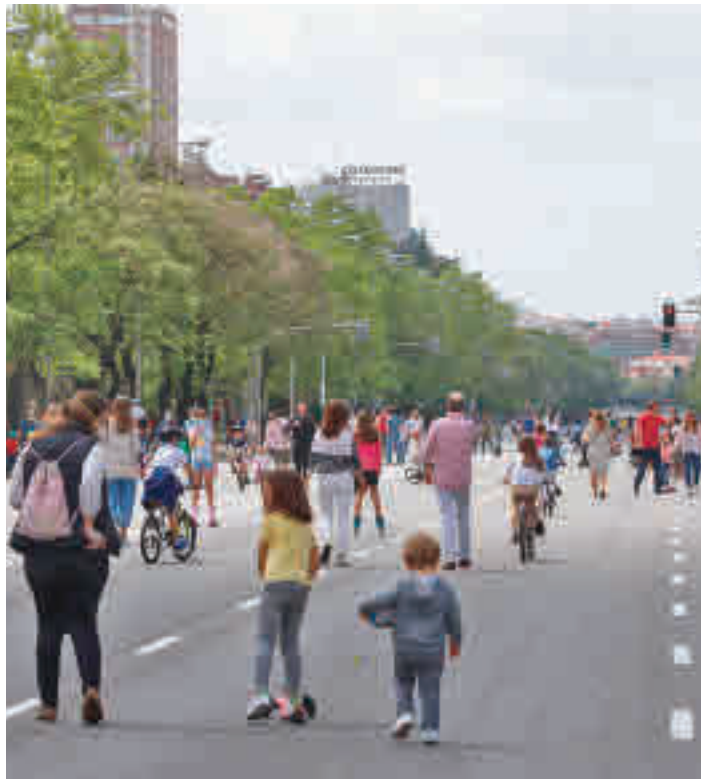
Varios ciudadanos pasean por el Paseo de la Castellana

“Pido que, en la medida de lo posible, se limiten los movimientos, son sacrificios determinantes para poder doblegar esa segunda ola; la