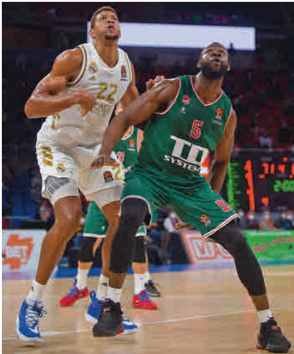
El Real Madrid inició su andadura en la Euroliga con una derrota en la pista del Baskonia

Un claro ejemplo de ello se pudo ver el pasado fin de semana en la Liga Endesa. Dos de los equipos con más cartel, el FC Barcelona y el Real Madrid, no disputaron sus encuentros ante el Acunsa GBC y el Herbalife Gran Canaria, respectivamente, por la misma razón. En el Barça fue su entrenador, Sarunas Jasikevicius, y dos miembros más