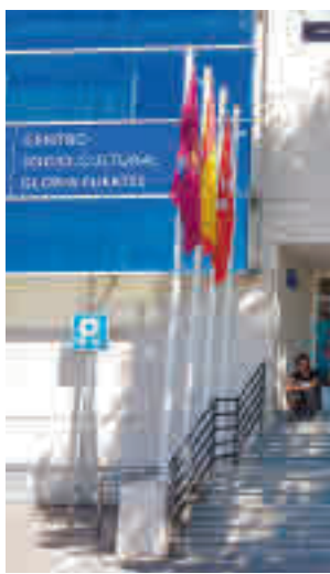
CC Gloria Fuertes