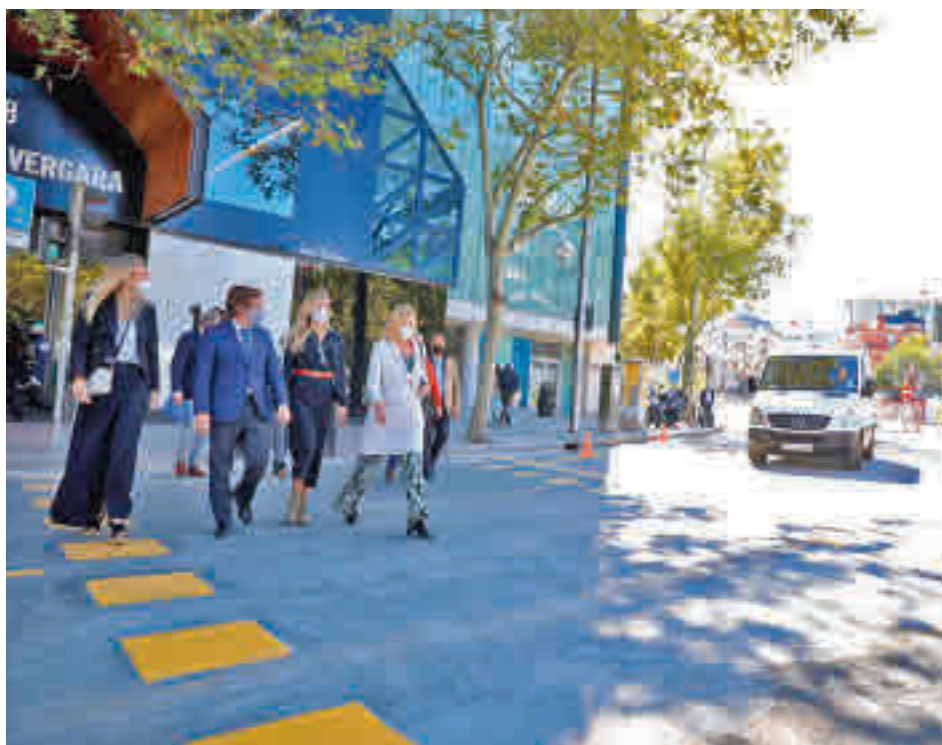
El alcalde supervisó sobre el terreno la reapertura de la intersección el pasado 7 de octubre

De igual modo, quedó suprimido el giro a la izquierda desde Príncipe de Vergara (sentido Norte) hacia la calle Pedro de Valdivia, que fue permitido provisionalmente y que deja de ser necesario porque se podrá volver a acceder a Pedro de Valdivia desde Príncipe de Vergara viniendo desde el Norte.