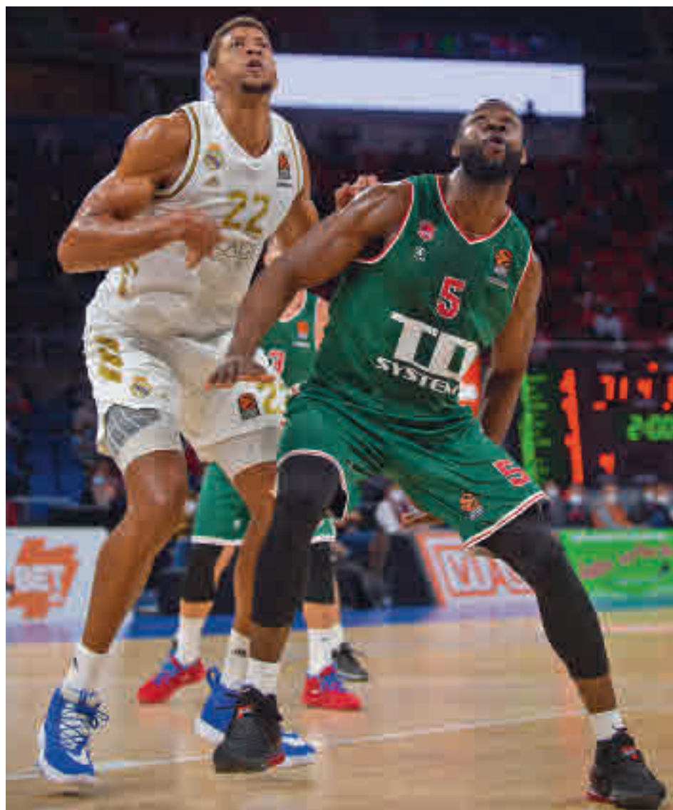
El Real Madrid inició su andadura en la Euroliga con una derrota en la pista del Baskonia

Un claro ejemplo de ello se pudo ver el pasado fin de semana en la Liga Endesa. Dos de los equipos con más cartel, el FC Barcelona y el Real Madrid, no disputaron sus encuentros ante el Acunsa GBC y el Herbalife Gran Canaria, respectivamente, por la misma razón. En el Barça fue su entrenador, Sarunas Jasikevicius, y dos miembros más