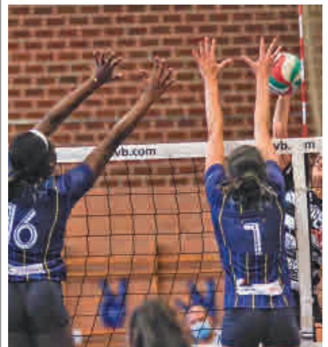
El Madrid Chamberí cayó ante el Algar Surmenor

Los otros representantes madrileños tienen citas desiguales. Mientras el Madrid CFF recibirá a un Espanyol que el curso pasado terminó como colista y que abrió la temporada con una derrota en casa frente al Atlético (0-2), el Real Madrid jugará en el campo de un Valencia que suele crecerse cuando actúa como local. El Rayo descansará.