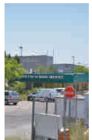
Vertedero de Pinto

La ampliación del vertedero donde acaban los residuos de los municipios del Sur ha sido criticada y rechazada por los municipios de la zona, especialmente por Pinto y Getafe, que son los más afectados.