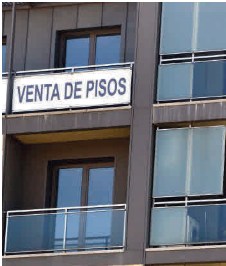
Pisos en venta en la Comunidad de Madrid

“Aunque los datos son positivos, todavía es pronto para definir una tendencia clara en lo que respecta a los precios de la vivienda de segunda mano, ya que el mercado está sujeto a la evolución de la pandemia y a su impacto en el empleo y, por ende, en la demanda compradora”, señala Ferran Font, director de Estudios de Pisos.com. En su opinión, “si la expansión del coronavirus se controla, es posible que se recupere cierto nivel de compraventas y de concesión de hipotecas”, pero que habrá que esperar a un último trimestre “decisivo”.