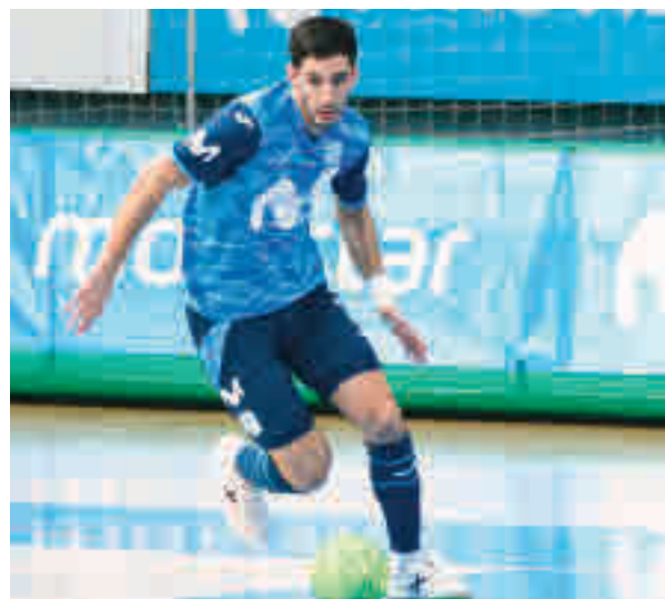
Primer choque del curso en el Jorge Garbajosa

abría la fase regular de la Primera División de fútbol sala visitando la complicada cancha del Jaén Paraíso Interior, pero todas las expectativas que generó el choque se fueron al traste tras el obliga-