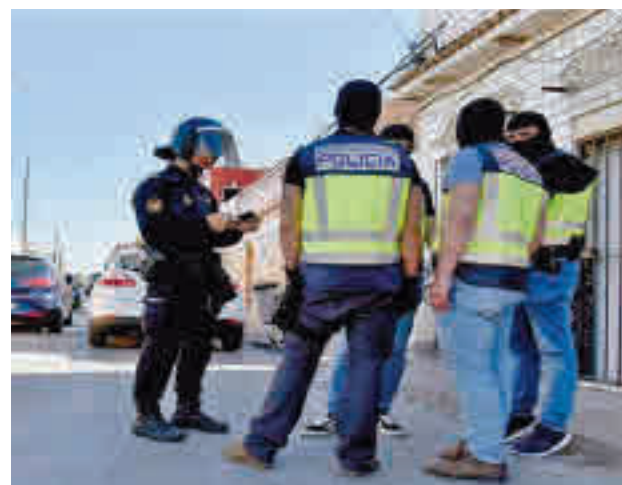
Punto de venta de drogas en la Cañada Real

Varios integrantes de la organización se situaban en el acceso a la parcela para deci-