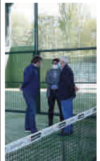
Imagen de las instalaciones

Toda la información de la zona Norte de la región, en la web.