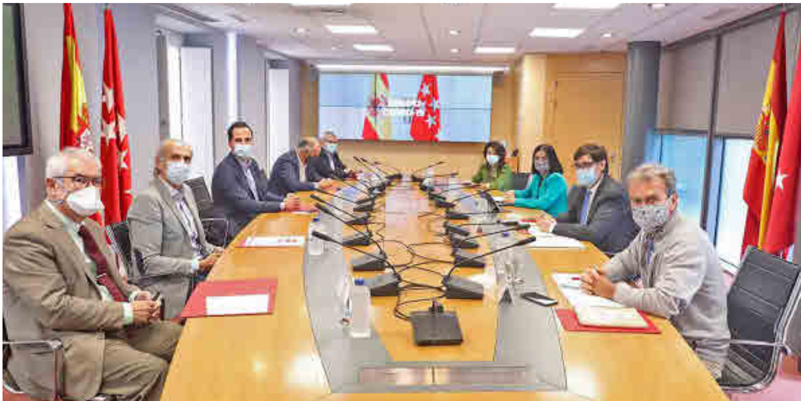
Una de las reuniones que han mantenido en los últimos días la Comunidad de Madrid y el Gobierno central