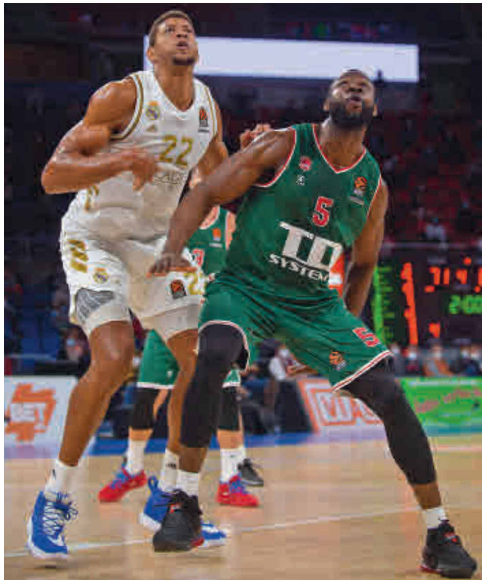
El Real Madrid inició su andadura en la Euroliga con una derrota en la pista del Baskonia

Un claro ejemplo de ello se pudo ver el pasado fin de semana en la Liga Endesa. Dos de los equipos con más cartel, el FC Barcelona y el Real Madrid, no disputaron sus encuentros ante el Acunsa GBC y el Herbalife Gran Canaria, respectivamente, por la misma razón. En el Barça fue su entrenador, Sarunas Jasikevicius, y dos miembros más