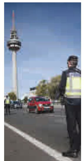
Control en Madrid

“Queda muchísimo por hacer pero las cosas van mejorando”, insistió Ayuso que destacó algunos de los datos que su consejero de Sanidad ha ido desvelando en los últimos días y que el Gobierno central puso en duda en un primer momento. Según estas cifras, la incidencia (número de contagios por cada 100.000 habitantes) en la región habría bajado de 869 a 586 en las últimas dos semanas.