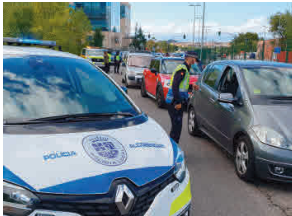
Control policial en Alcobendas

La localidad alcobendense es una de las diez que está bajo las restricciones del Gobierno central • En el caso de Sanse, solo está confinada la Zona Básica de Salud de Reyes Católicos