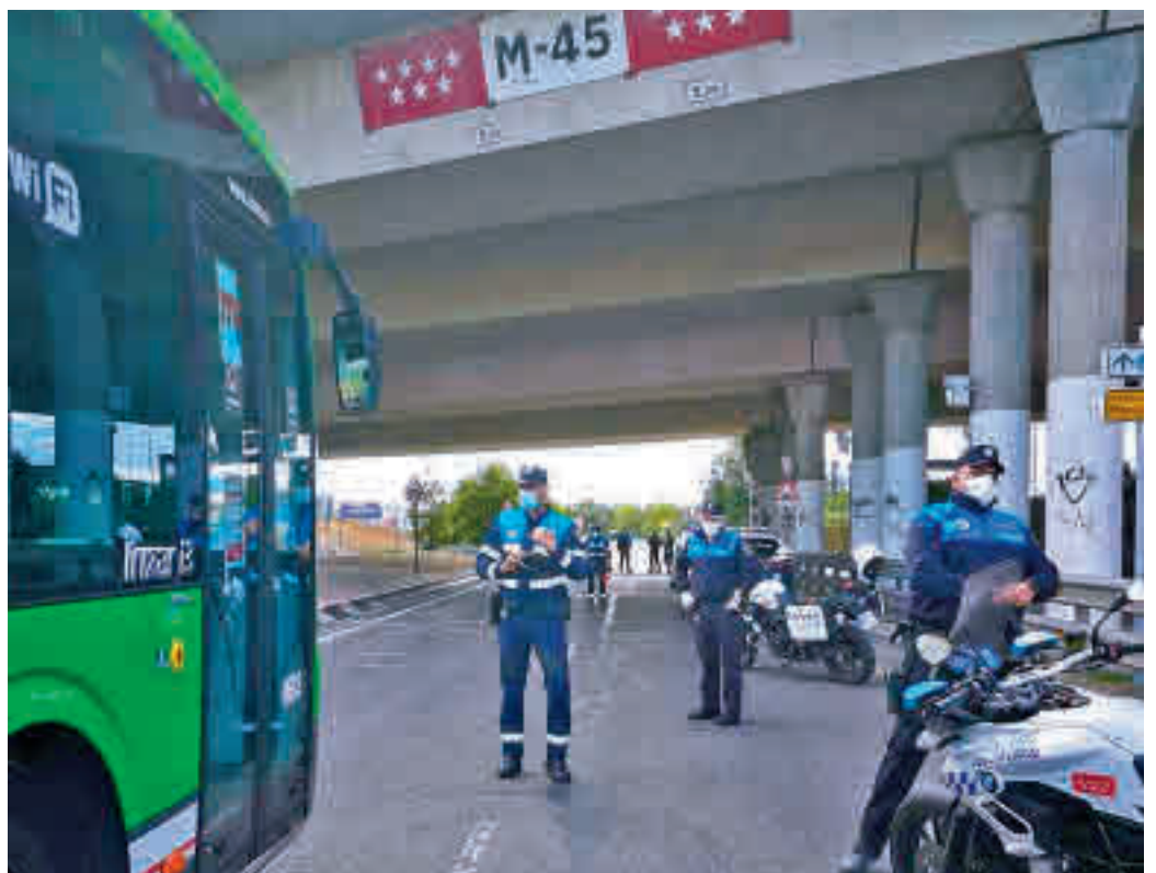
Controles de la Policía Local en Leganés

EL ALCALDE DE PARLA PIDE A LA PRESIDENTA QUE "DEJE DE FRIVOLIZAR"