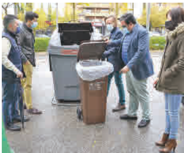
Uno de los nuevos contenedores

La ayuda forma parte del paquete de medidas implantado para paliar en la medida de lo posible las dificultades económicas que se han generado por la Covid-19.