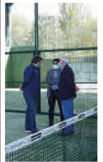
Imagen de las instalaciones

Toda la información de la zona Norte de la región, en la web.