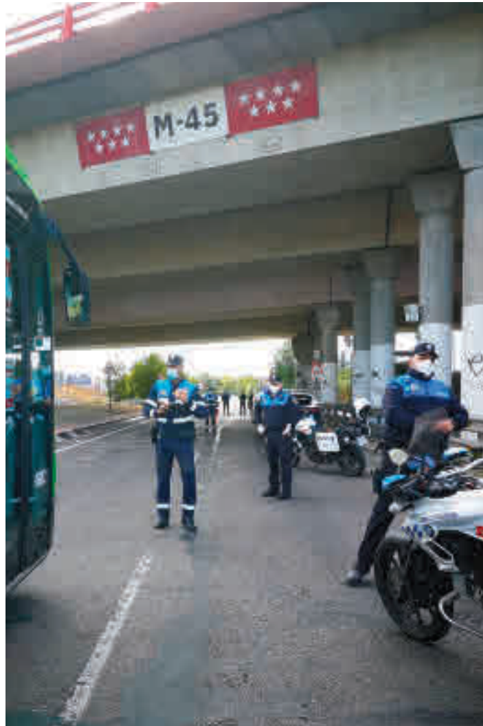
Controles de la Policía Local en Leganés

El detonante fueron unas declaraciones de Díaz Ayuso al diario Abc en las que señalaba que su objetivo era “detectar al 1% que contagia” y