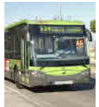
Autobús en Móstoles