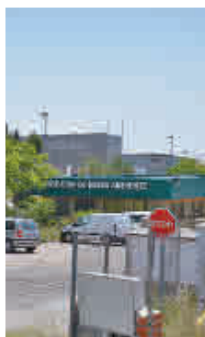
Vertedero de Pinto

La ampliación del vertedero donde acaban los residuos de los municipios del Sur ha sido criticada y rechazada por los municipios de la zona, especialmente por Pinto y Getafe, que son los más afectados.