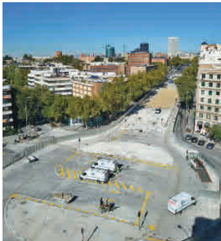
La glorieta de López de Hoyos

Asimismo, recuperan sus itinerarios habituales las últimas tres líneas de la EMT que