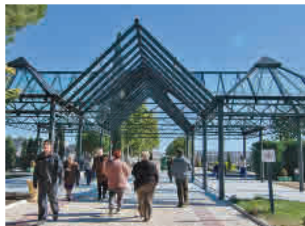
Cementerio de Torrejón

de medidas específicas. A pesar de toda esa labor, hay puntos donde ha crecido la tasa de positivos en la última semana, como es el caso de Torrejón de Ardoz, que en el informe previo lograba reducir la tasa de positivos hasta 363 por cada 100.000 habitantes, pero que en los últimos siete días ha incrementado esos datos hasta los 455, con especial atención a la Zona Básica de Salud de Las Fronteras, donde se abre la posibilidad de un confinamiento perimetral al arrojar una tasa de 539 casos. Arganda del Rey se sitúa en los 458 positivos, aunque la Zona Básica de Salud de Arganda del Rey registra 501 casos.