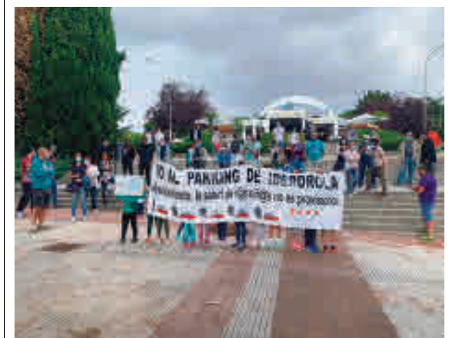
Uno de las protestas de los padres de alumnos

La zona verde se desarrolla al Sur y al Este, entre la calle de Manuel Garrido y la M-30. Por su parte, el arroyo, sin caudal y cuyo trazado ya se vio alterado por las obras de la M-30, se incorporará al parque. El expediente se someterá ahora al proceso de información pública.