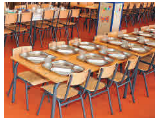
Colegio público de Getafe

El Consistorio señala que 313 menores pueden estar afectados en la ciudad por esta situación.