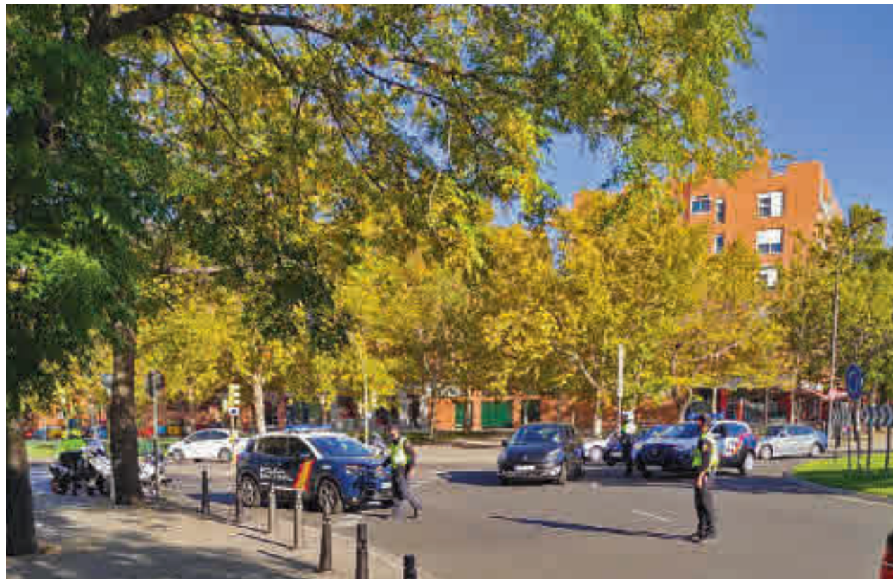
El estado de alarma decaerá este sábado en Getafe

En el conjunto de la ciudad esa cifra se sitúa ahora en 331, lo que supone un descenso muy significativo respecto a los 455 casos que se