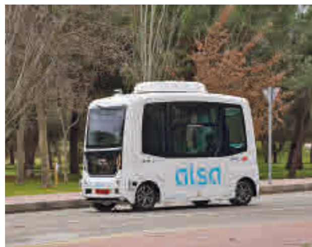
Autobús sin conductor de la Autónoma

El autobús presta servicio entre las 7:15 y las 15:15 horas, con cabecera en la estación de Cercanías. Para en las facultades de Derecho y Psicología, el Rectorado, la Politécnica y las residencias