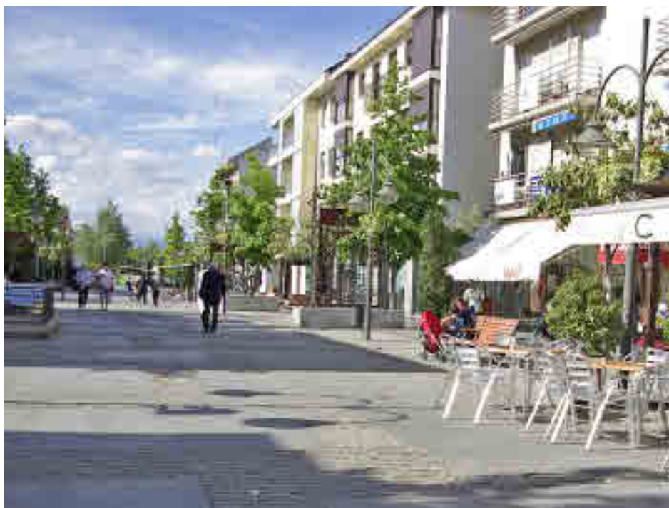
La incidencia se ha disparado en Majadahonda en las últimas semanas

En cuanto a los distritos de la capital, solo dos de ellos muestran una incidencia superior a los 500 casos por cada 100.000 habitantes. Uno de ellos es Puente de Vallecas, donde las restricciones regionales y nacionales se han ido sucediendo desde hace más de un mes.