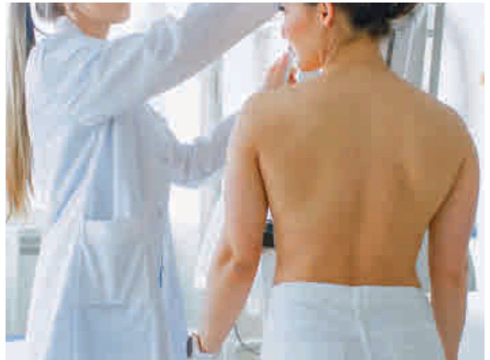
La prevención es la mejor aliada en la lucha contra esta enfermedad

Según explicó el Gobierno regional en un comunicado, “el objetivo es mejorar la experiencia de las mujeres que participan en el programa y que, de esta forma, puedan acceder y gestionar de una forma ágil y sencilla sus citas de mamografía de cribado asintomático, para lograr una mayor adherencia al programa y optimizar el uso de los recursos”. Se trata de un “proyecto novedoso” que facilita a la mujer la realización de una mamografía que permite detectar lesiones en la mama