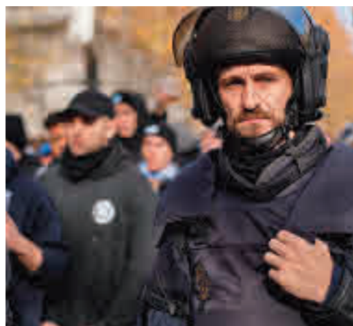
Fotograma de la serie 'Antidisturbios'

EL PERIÓDICO GENTE NO SE RESPONSABILIZA NI SE IDENTIFICA CON LAS OPINIONES QUE SUS LECTORES Y COLABORADORES EXPONGAN EN SUS CARTAS Y ARTÍCULOS