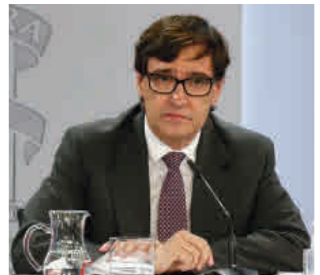
Rueda de prensa de Salvador Illa

Por el momento, parece que habrá que esperar acontecimientos.