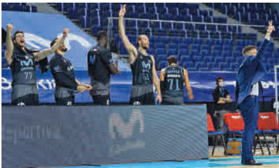
El Estudiante ha escalado hasta el octavo puesto de la clasificación