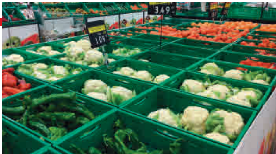
Los productos frescos son más económicos

Pero no solo hay que tener en cuenta el dinero, sino las consecuencias del sobrepeso