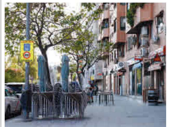
Terrazas en Fuenlabrada

Otro día se asustó cuando su madre sacó del bolsillo una botella de agua llena de heces y no le dieron ninguna explicación y la gota que colmó el vaso fue que se cayó y que no avisaron a la familia, razón por la que decidieron sacarla de la residencia e ingresarla en el hospital, donde se sigue recuperando.