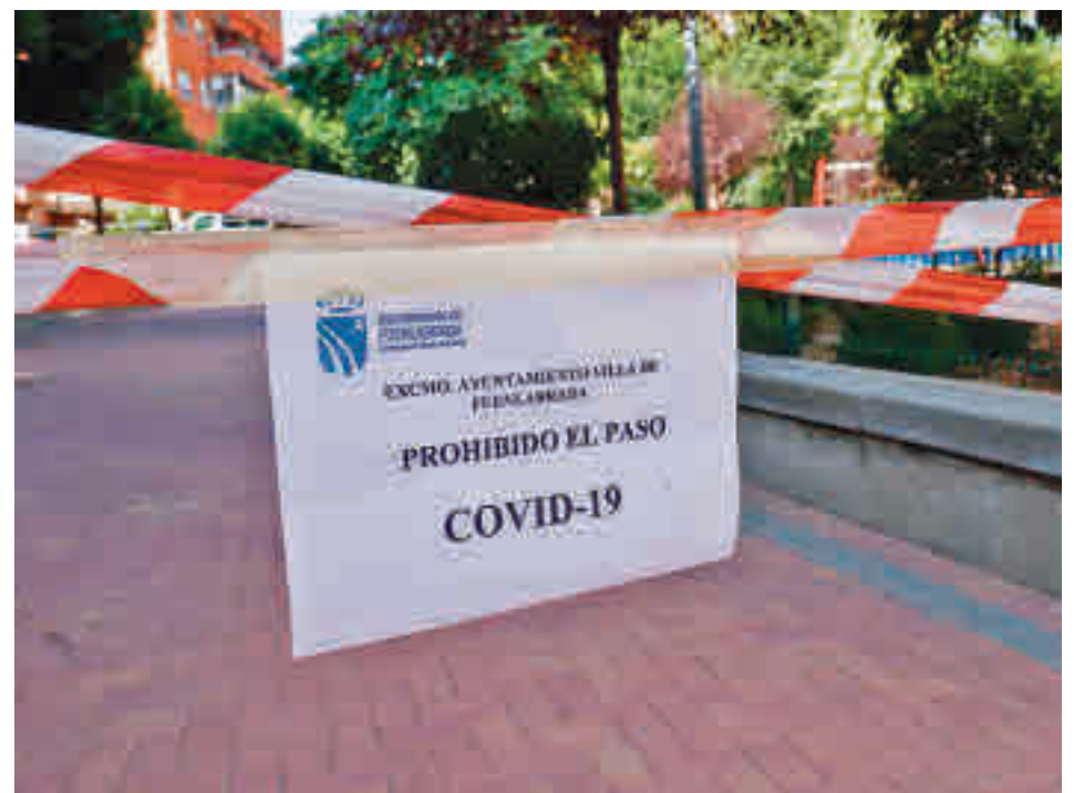
El estado de alarma decaerá este sábado en Fuenlabrada

Mejor ha sido el comportamiento del resto de áreas fuenlabreñas, empezando por la única que hace diez días rompía esa barrera de los 500