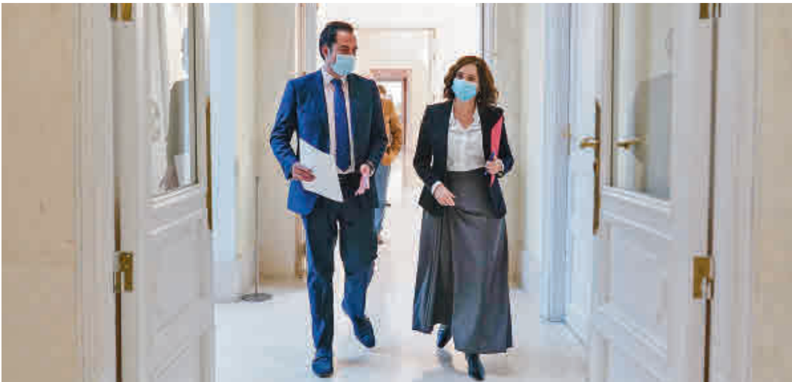
Isabel Díaz Ayuso e Ignacio Aguado, tras la reunión del Consejo de Gobierno