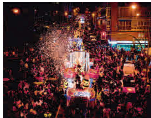
La comitiva real, a su paso por el distrito de Latina

Sobre la Cabalgata de Reyes principal de la capital, añaden que se están valorando las distintas posibilidades, aunque todavía no se ha tomado una decisión al respecto. En estos momentos, dicen desde Cibeles, los traba-