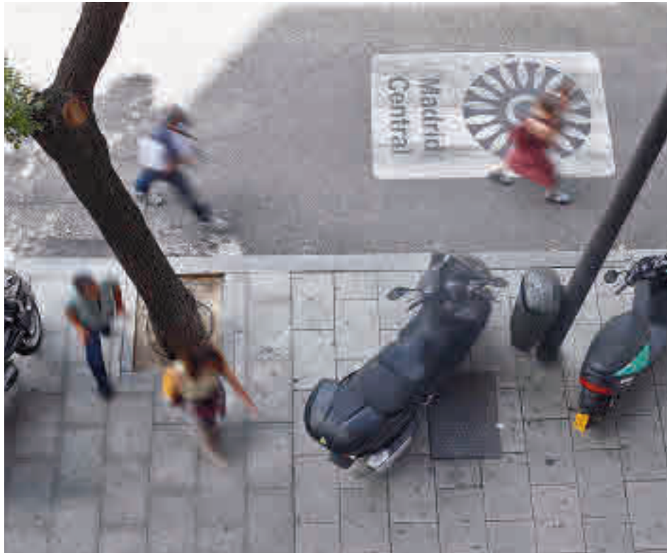
Motocicletas estacionadas en una acera del Centro de la capital

El control sobre las infracciones de estos vehículos se limitaba hasta ahora a los agentes de Movilidad, que en 2019 interpusieron 10.428 multas a motocicletas mal aparcadas (1.177 por obstruir