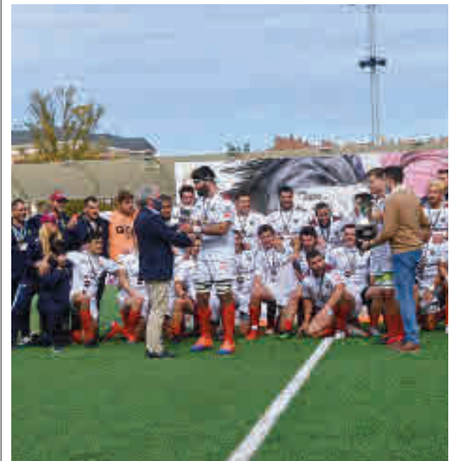
El conjunto alcobendense engorda su palmarés

Por su parte, el otro representante madrileño, el Complutense Cisneros, debería haberse estrenado visitando al Bathco, pero el equipo santanderino ha renunciado a su plaza en la máxima categoría nacional.