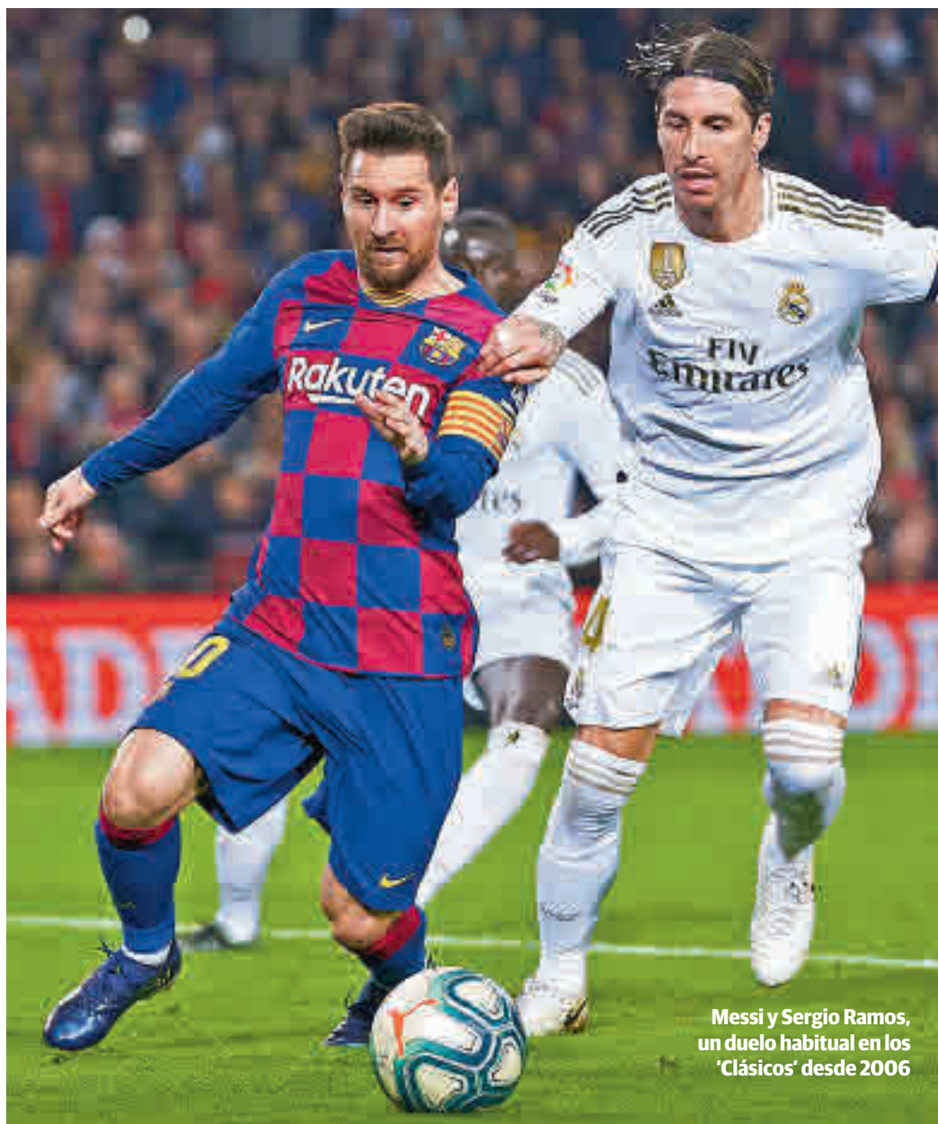
Messi y Sergio Ramos, un duelo habitual en los 'Clásicos' desde 2006

El gris del otoño y de un país que sigue mirando con preocupación a los datos de la segunda ola también parece haberse instalado en el juego de los dos candidatos al título de Liga por antonomasia. El Real Madrid, campeón de la edición anterior, está dejando una versión plomiza en sus primeros partidos, firmando sus actuaciones más floja en años en apenas tres días en Valdebebas, donde el Cádiz y el Shakhtar desnudaron todas las carencias tácticas de los merengues, quienes se presentan en el Camp Nou con dudas en su juego y sin los lesionados Ødegaard y Eden Hazard. Todas estas circunstancias darían en otras oca-