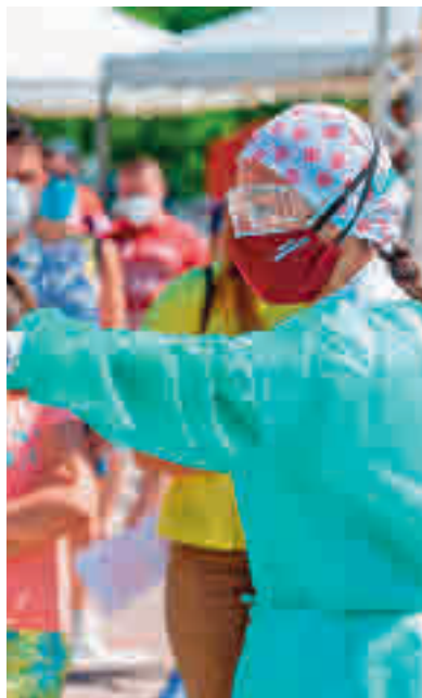
Imagen de los test en Torrejón

Después de que el Gobierno central decretara el estado de alarma el pasado día 9 de octubre, todos los municipios afectados por las restricciones enfocaron sus esfuerzos en reducir el número de contagios por Covid-19. Algunos de ellos han llegado a rebajar la barrera de los 500 casos por cada 100.000 habitantes, una cifra que en ocasiones ha marcado el límite entre el confinamiento y la ausencia