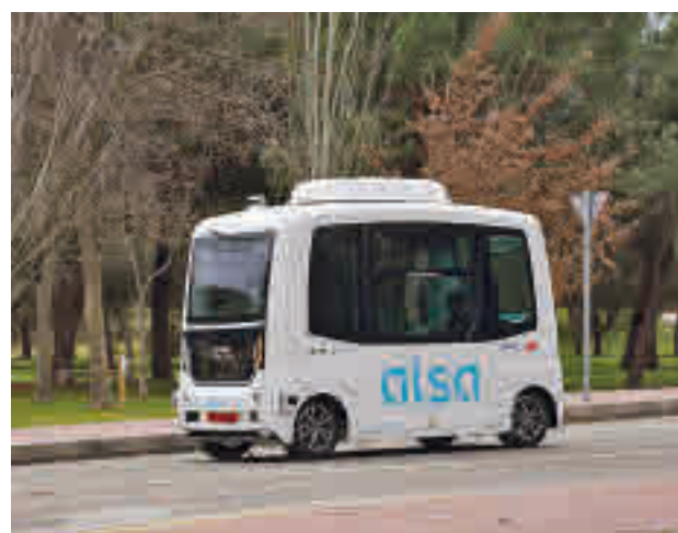
Autobús sin conductor de la Autónoma

El autobús presta servicio entre las 7:15 y las 15:15 horas, con cabecera en la estación de Cercanías. Para en las facultades de Derecho y Psicología, el Rectorado, la Politécnica y las residencias