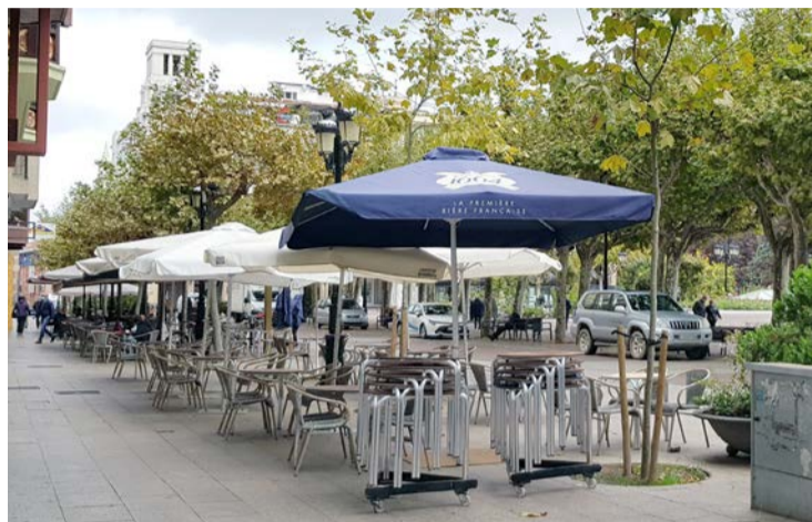
La hostelería riojana deberá cerrar sus puertas a las 21 horas.

Vuelven, asimismo, las reducciones de aforos. En aquellos comercios y servicios abiertos al público se fija en un máximo del 50%. En relación a establecimientos de hostelería y restauración y de juegos y apuestas, será del 50% en el interior y del 60% en el exterior. Asimismo, se mantendrá una distancia de al menos 1,5 metros entre las mesas o agrupaciones de mesas, cuya ocupación máxima será de 6 clientes. Las nuevas restricciones conllevan la prohibición del consumo en la barra. “No hemos considerado necesario de-