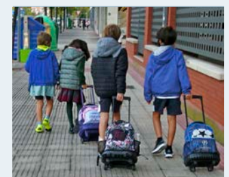
Niños acarreado el maletón.

pequeño... para toda la Primaria y en algunos colegios también para la Secundaria. A lo sumo podrían llevar algún cuaderno para escribir. Nos ahorraríamos arrastrar el maletón todos los días, amén del coste tan alto que tiene el material escolar de los niños o jóvenes en edad estudiantil. Lo que yo más recuerdo del primer día de clase de mis primeros años del cole es que había que presentarse con un cuaderno de dos rayas, un lapicero 'juansindel' y una goma de borrar. Así que echen cuenta de los gastos: 2 pesetas del cuaderno, 1,20 del lapicero y 0,50 de la goma. En fin, ni esto, ni aquello... creo yo.