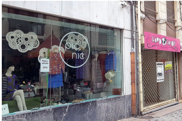
El IBI para los comercios del centro histórico estará bonificado hasta el 90%.