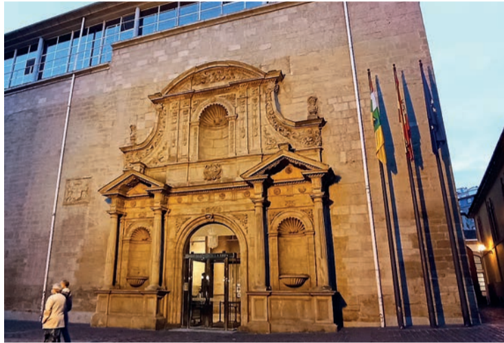
La sanidad ocupó buena parte de la sesión dentro del Parlamento de La Rioja.