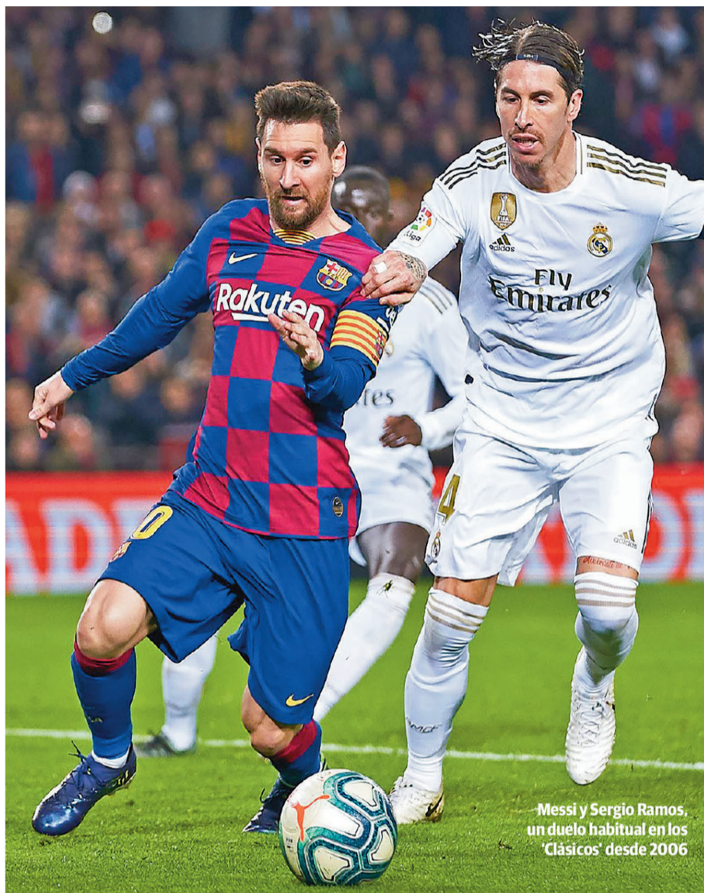
Messi y Sergio Ramos, un duelo habitual en los 'Clásicos' desde 2006

El gris del otoño y de un país que sigue mirando con preocupación a los datos de la segunda ola también parece haberse instalado en el juego de los dos candidatos al título de Liga por antonomasia. El Real Madrid, campeón de la edición anterior, está dejando una versión plomiza en sus primeros partidos, firmando sus actuaciones más floja en años en apenas tres días en Valdebebas, donde el Cádiz y el Shakhtar desnudaron todas las carencias tácticas de los merengues, quienes se presentan en el Camp Nou con dudas en su juego y sin los lesionados Ødegaard y Eden Hazard. Todas estas circunstancias darían en otras oca-