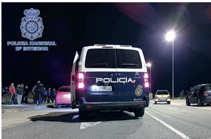
Los agentes identificaron a trece personas, la mayoría jóvenes de entre 20 y 23 años.

Por otro lado, esa misma noche, en una actuación conjunta junto a la Policía Local, sancionaron a un bar por superar el aforo máximo permitido. En el interior descubrieron que había 95 clientes, algunos de ellos sin mascarilla. El refuerzo policial por las noches,