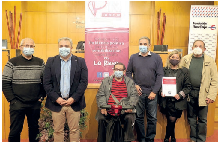
La presentación del décimo informe tuvo lugar el viernes 16.

ra quienes no pueden afrontar, al menos, 4 de los siguientes gastos: vacaciones una semana al año, alimentación básica, vivienda con temperatura adecuada, gastos imprevistos, gastos en vivienda, automóvil y ordenador. Según este indicador esta circunstancia