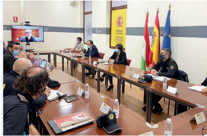
La Junta de Seguridad para estudiar el dispositivo especial se celebró el martes 20.

En la junta se acordó que el final en el Alto de Moncalvillo se cierre al público al considerar que las características orográficas de este alto de montaña supone una enorme dificultad para controlar la distancia mínima de seguridad entre personas. Asimismo, se insistió a la ciudadanía a que siga su desarrollo desde casa como medida de prevención sanitaria y para evitar,