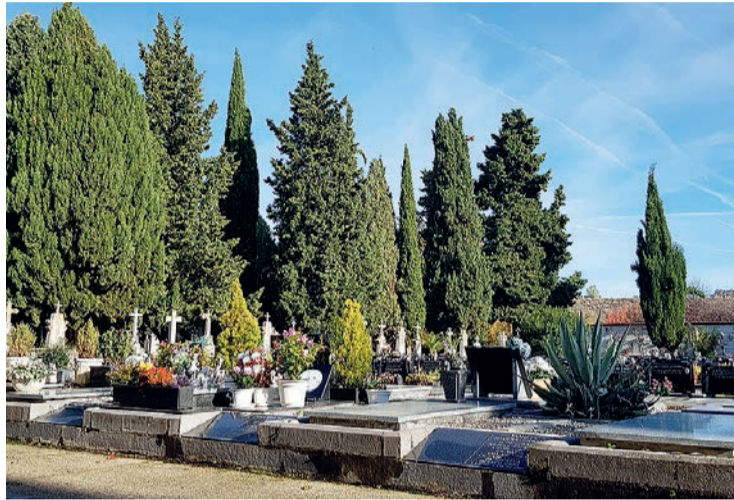
En el camposanto habrá que evitar concentraciones de más de 6 personas.

Entre el 30 de octubre y el 1 de noviembre se cerrarán las fuentes del recinto para evitar contagios a la hora de recoger el agua para las flores. "Pedimos disculpas, pero es necesario". Por ello, solicitó a los logroñeses que lleven el agua