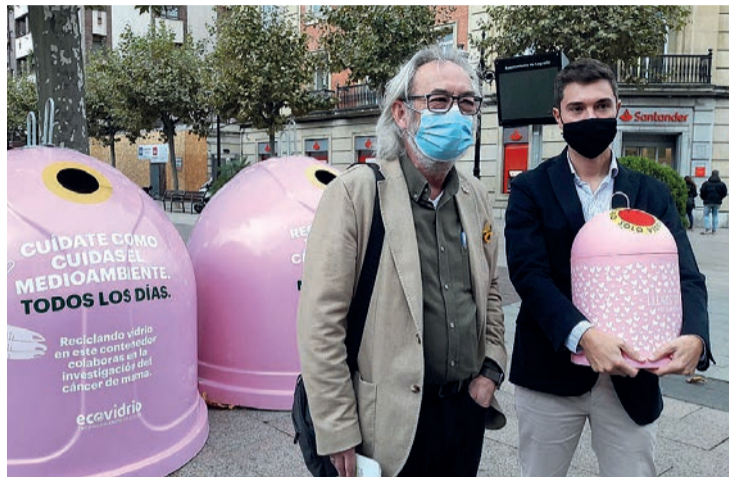
Presentación de la campaña el martes 20 en el paseo del Espolón.

Para poder participar se han instalado hasta final de mes cuatro contenedores rosas, dos en la plaza del Mercado y dos en el paseo del Espolón, al lado del quiosco de La Rosaleda. En la presentación el martes 20, el concejal