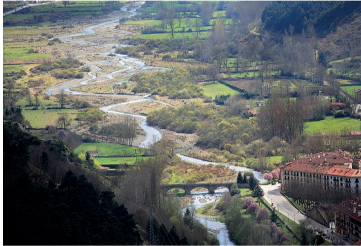
El proyecto para reactivar la zona tendrá una duración de 3 años.

Se persigue dinamizar el turismo en esa zona, así como aumentar su rentabilidad económica y social, con un turismo activo y de naturaleza, cultura, gastronomía y bienestar. También incrementar la estancia media de los visitantes y ampliar los públicos objetivos y mercados, reducir la estacionalidad y reconvertir la estación de Valdezcaray para situarla como referente en la práctica del turismo