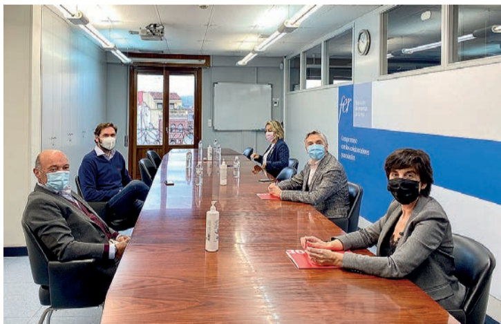
Reunión mantenida el martes 20 entre la FER y dirigentes socialistas.

Señaló que "el tejido empresarial riojano es mayoritariamente muy pequeño, con menos de 9 trabajadores". Planteó la necesidad de "mantener estas pymes y autónomos de sectores con una situación difícil, que han perdido el 70% y 80% de su actividad e incluso