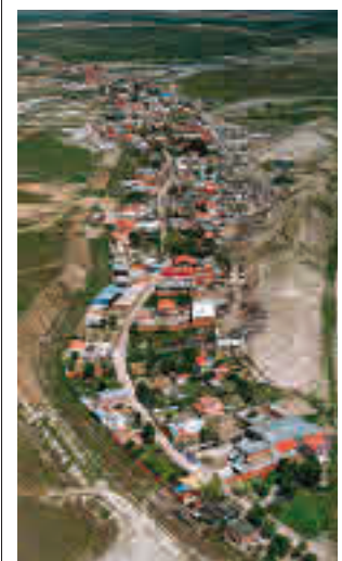
La antigua vía pecuaria

Toda la actualidad de los distritos de Madrid en nuestra web