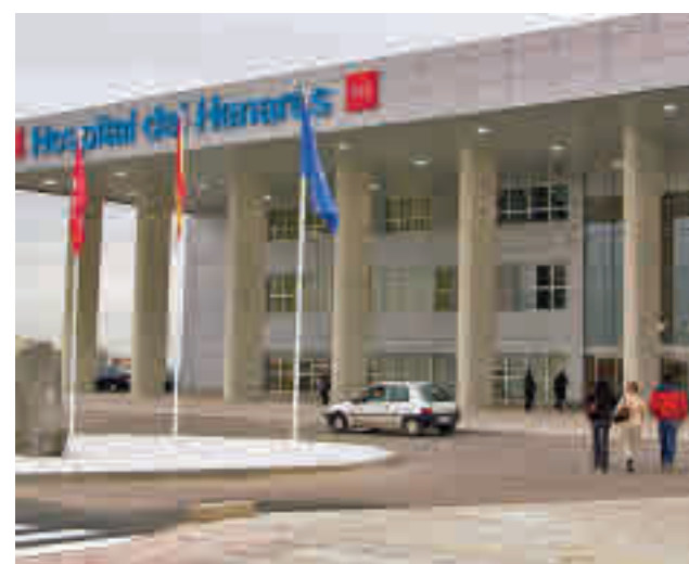
Hospital del Henares, en Coslada