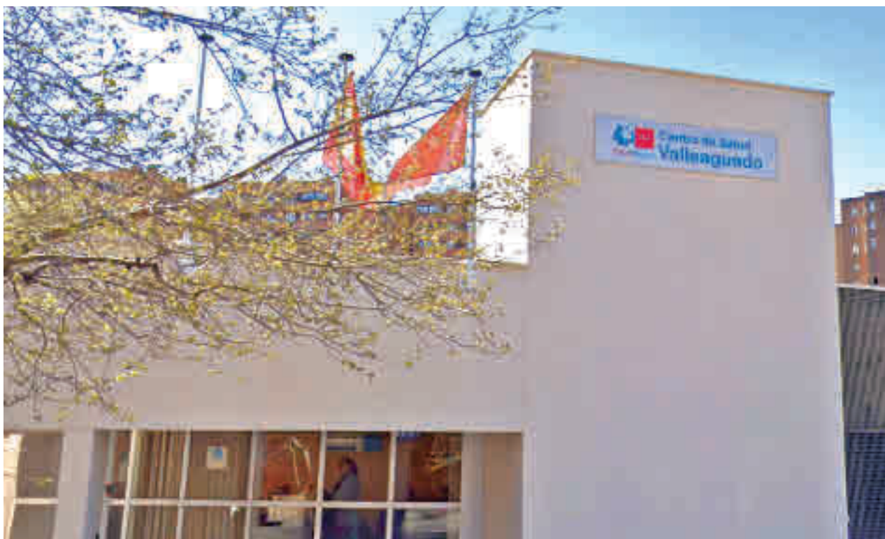
La Zona Básica de Salud de Valleaguado tiene, por el momento, una tasa por debajo de los 500 positivos