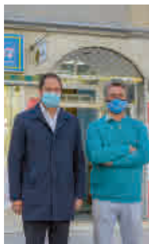
Campaña de floristerías

más extraño que se recuerda en todo el siglo XXI. En el caso de Torrejón de Ardoz, el Ayuntamiento ha decidido ampliar el horario de su camposanto, manteniéndose abierto hasta el próximo lunes día 2 de noviembre de 8 a 20