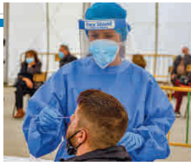
Pruebas diagnósticas en la zona Sur

rus se ha comportado de manera muy desigual en los últimos días. En algunas de ellas, como en Leganés, la evolución está siendo favorable, ya que ha conseguido bajar hasta los 288 casos. También es reseñable el caso de Parla, que era la ciudad