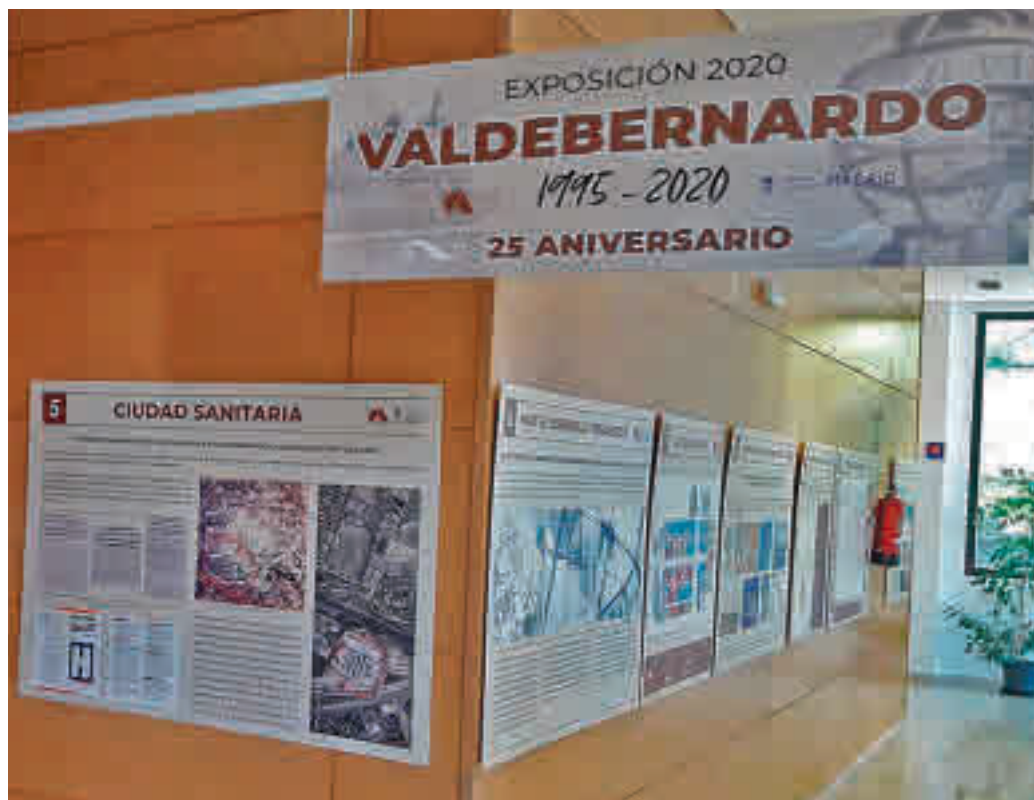
La exposición fotográfica está situada en el centro cultural del barrio

Chapa argumentó que la principal línea de acción la han realizado los Servicios Sociales, que han gestionado cuatro contratos de emergencia para cubrir las necesidades de alimentación y de aseo de personas en situación de vulnerabilidad y con los que se ha atendido a 1.673 familias y se ha beneficiado a 5.500 personas. Además, se han repartido 200 menús al día y 450 cestas mensuales.