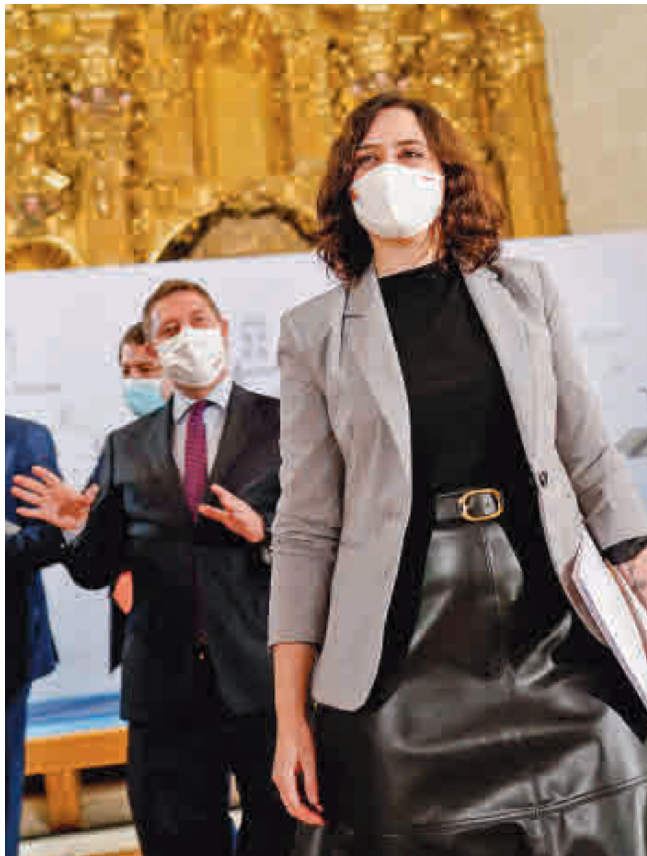
Isabel Díaz Ayuso, tras su reunión con los presidentes de Castilla y León y Castilla-La Mancha

Díaz Ayuso tomó esta decisión solo unas horas después