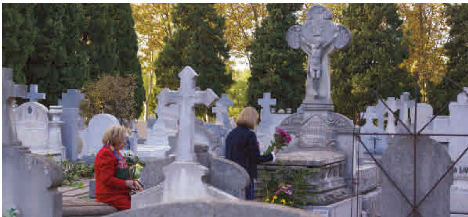
El cementerio de La Almudena es el más grande de la Comunidad de Madrid