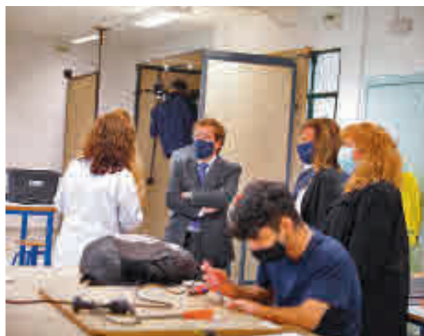
El alcalde de Madrid visitó las instalaciones el 22 de octubre

Durante el curso 2020-2021, este espacio impartirá talleres teóricos y prácticos de cocina, electricidad, estética y peluquería para facilitar la adquisición de conocimientos, habilidades, condiciones y capacidades para acceder al mercado laboral a jóvenes de entre 16 y 20 años.