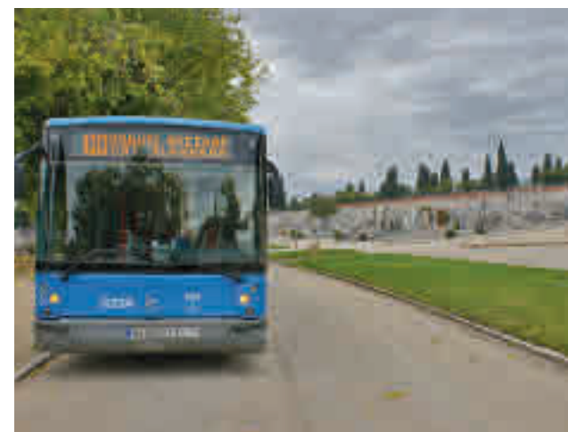
La línea 110 da servicio al cementerio de La Almudena

Por último, los mejores buses urbanos de conexión con la necrópolis de San Isidro son los 17, 25 y 50.