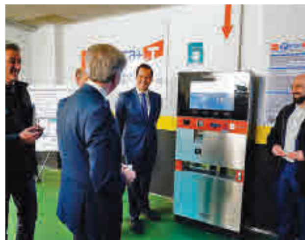
Aparcamiento de Colmenar Viejo

La iniciativa comenzó con un proyecto piloto en Colme-