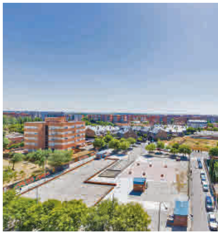
La zona de El Naranjo se podría cerrar

Además de El Naranjo, las otras zonas básicas de salud