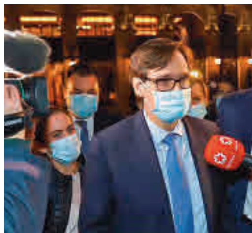
El ministro Illa, a la llegada a la fiesta de El Español

EL PERIÓDICO GENTE NO SE RESPONSABILIZA NI SE IDENTIFICA CON LAS OPINIONES QUE SUS LECTORES Y COLABORADORES EXPONGAN EN SUS CARTAS Y ARTÍCULOS