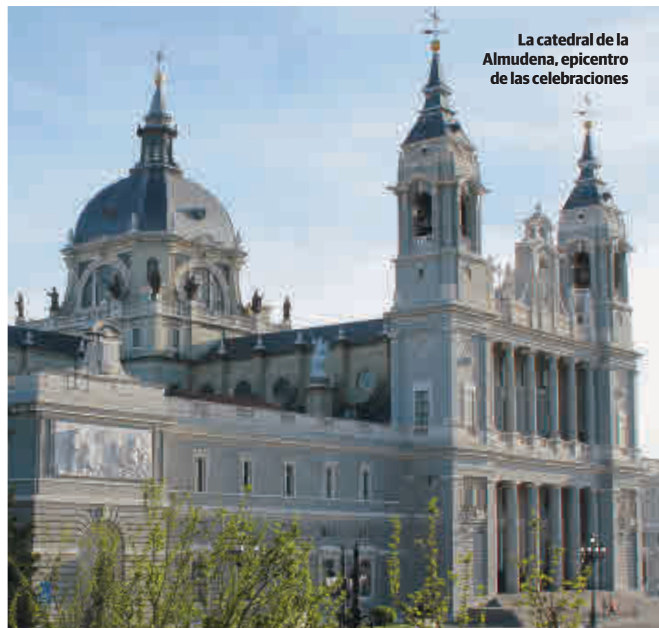
La catedral de la Almudena, epicentro de las celebraciones

El material recibido se subirá a la cuenta de Flickr del Arzobispado (Flickr.com/archimadrid), a las redes sociales a modo de ofrenda virtual y se