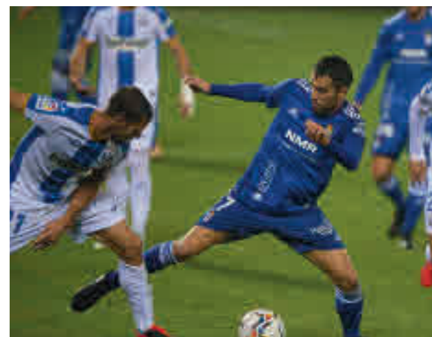
El Leganés se impuso en Butarque al Real Oviedo LALIGA.E5

Por su parte, Leganés y Fuenlabrada jugarán el domingo como locales ante el Mirandés y el Tenerife, respectivamente, mientras que el Rayo rendirá visita al campo de un renacido Lugo.