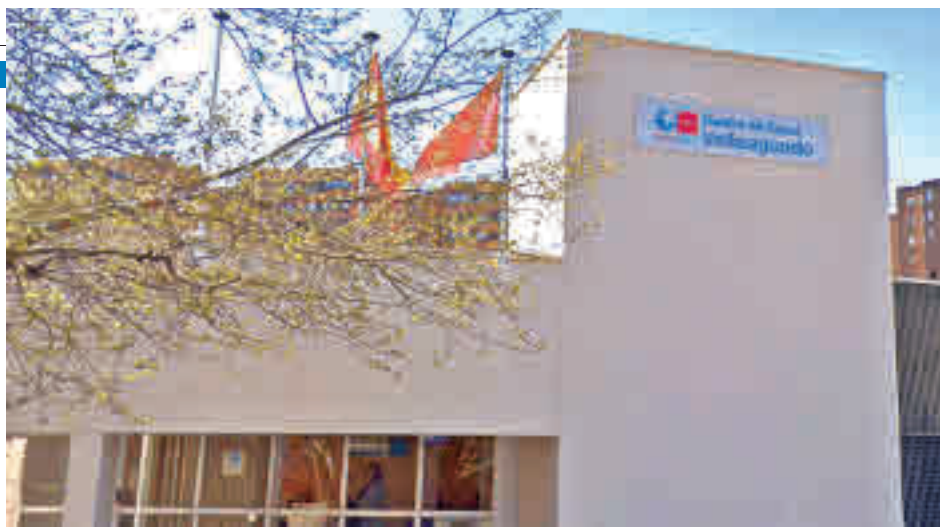
La Zona Básica de Salud de Valleaguado tiene, por el momento, una tasa por debajo de los 500

Por su parte, Alcalá de Henares mira con especial preocupación a la Zona Básica de Salud de Nuestra Señora del