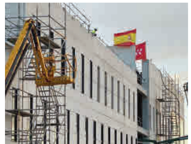
Obras del Hospital Isabel Zendal

El consejero ha apuntado que “evidentemente, como primera opción, va a ser activarlo para pacientes Covid”, por lo que esperan abrirlo “cuanto antes”.