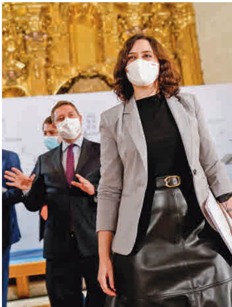
Isabel Díaz Ayuso, tras su reunión con los presidentes de Castilla y León y Castilla-La Mancha

Díaz Ayuso tomó esta decisión solo unas horas después