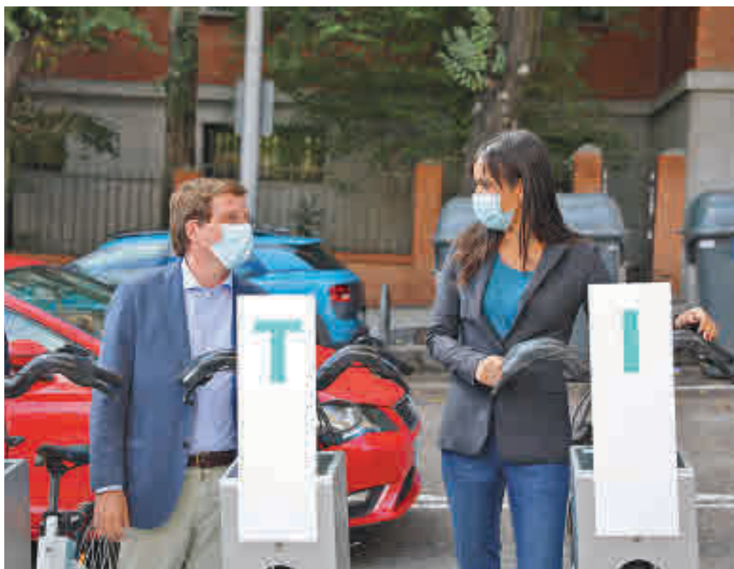
José Luis Martínez-Almeida y Begoña Villacís, en la Plaza de Puerta del Ángel

La Galería comercial Luyego es un centro al estilo de los mercados tradicionales. En su variada oferta hay fruterías, pescaderías, casquerías, charcuterías y reparación de calzado, entre otros puestos.