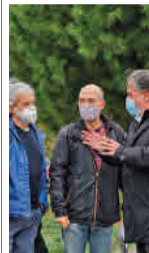
Un momento de la visita

Toda la información de Madrid capital en nuestra web