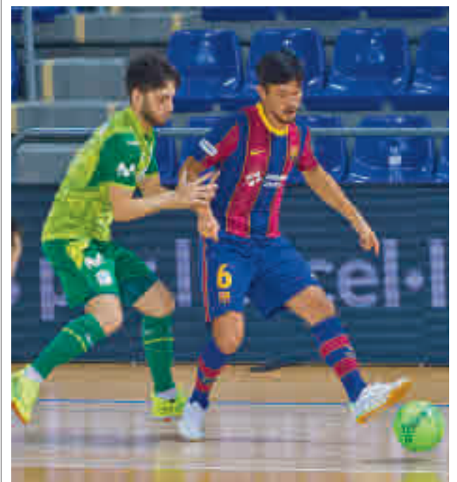
El Inter es tercero a pesar de su brillante triunfo en el Palau

La OK Liga Femenina alberga este fin de semana el derbi madrileño entre el CP Alcorcón y el CP Las Rozas. Ambos equipos están empatados a tres puntos después de cuatro jornadas.