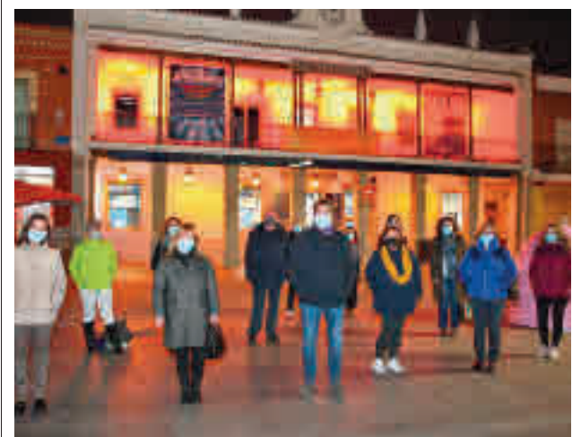
Concentración en el Espacio Joven La Plaza

Los datos con los que se ha elaborado el estudio provienen del análisis de 2.965.799 capturas procedentes de 138.556 vehículos distintos que circularon por las principales vías de Fuenlabrada durante 252 días, entre el 10 de febrero y el 18 de octubre.