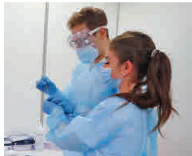
Pruebas diagnósticas de Covid-19