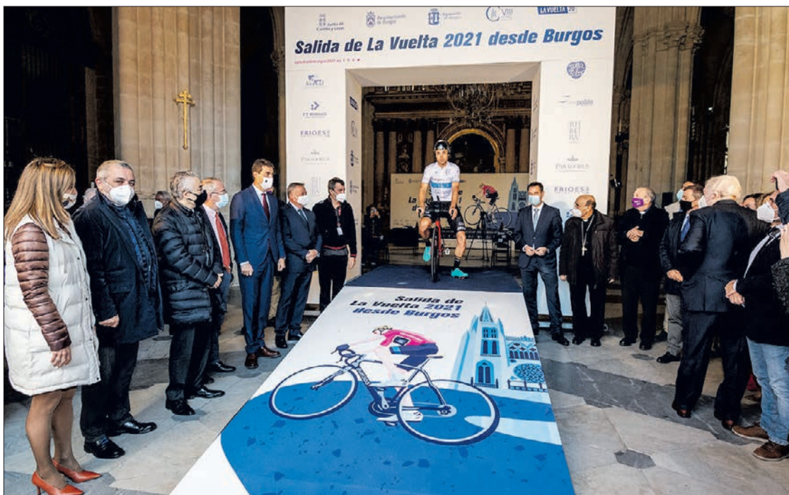
La Vuelta comenzará en Burgos en 2021 con motivo del VIII Centenario de la Catedral de Burgos.