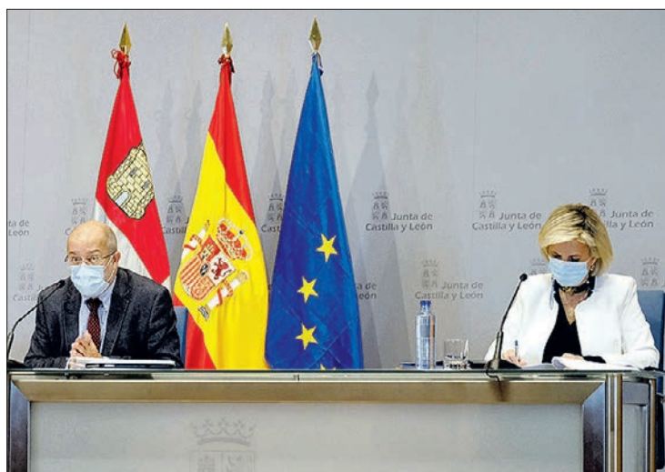
Comparencia del vicepresidente de la Junta y la consejera de Sanidad el jueves 29.

Es por esta situación que Casado pidió que se practique el denominado "confinamiento inteligente", que se trata de limitar el contacto social "al máximo" y permanecer