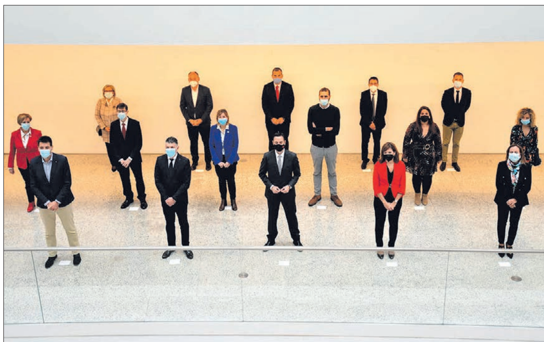
Foto de familia de los 16 concejales del PSOE y Cs que integran el nuevo Gobierno de coalición.

car adelante asuntos esenciales e inaplazables para Burgos en medio de una crisis sin precedentes”.