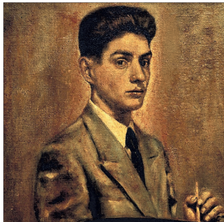
Imagen de uno de los retratos pintados por Ignacio del Río.

Ignacio del Río, con su pintura y forma de vida, dejó más que un legado artístico, enseñó a la población "lo importante y bella que es la vida". "Que no importa cuál sea la coyuntura del momento si se sabe uno emparar de las corrientes adecuadas. Su actitud vital que le acompañaba queda reflejada en mucha de su obra, llena de vida y pasión".