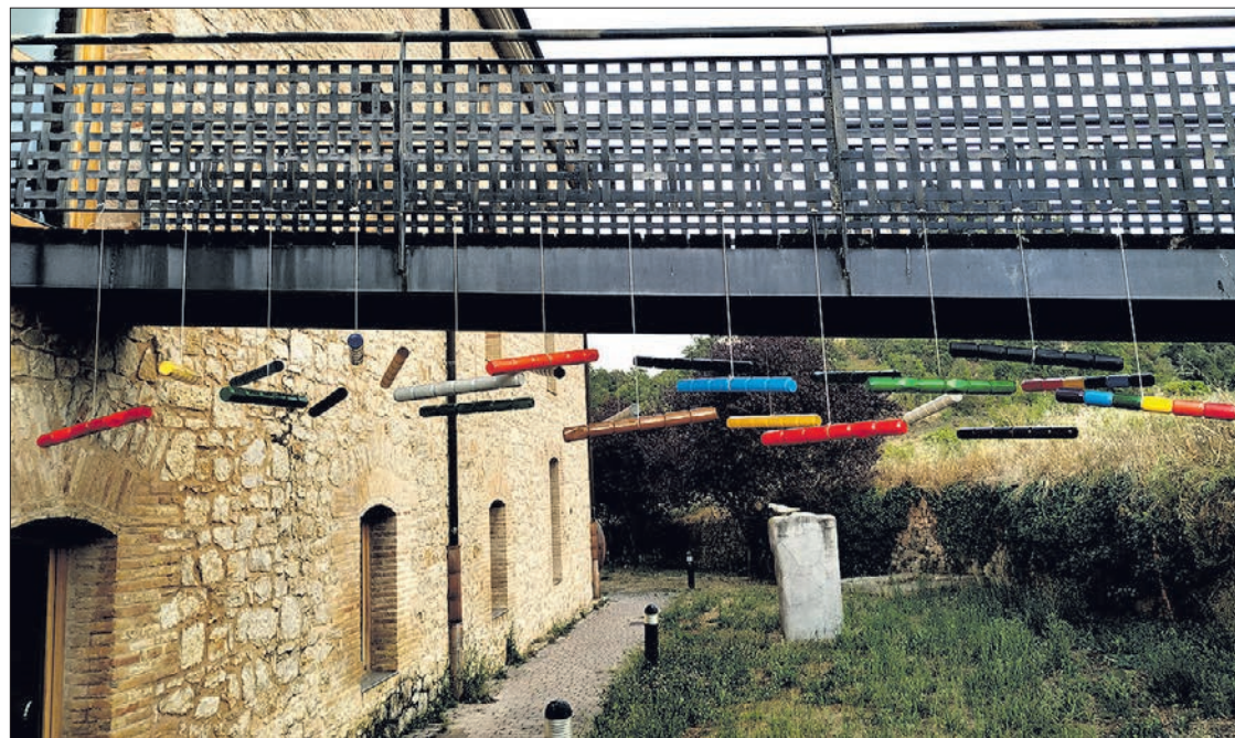
Imagen de la exposición ubicada al aire libre en el municipio de Oña.