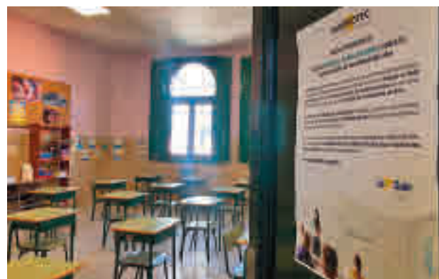
Aula con el dispositivo CTA

Murprotec, líder en Europa en el tratamiento contra las humedades estructurales, instaló el pasado 28 de agosto en un aula del colegio La Salle La Paloma una Central de Tratamiento del Aire (CTA). Este dispositivo aspira aire nuevo tomado del exterior, lo filtra y lo introduce