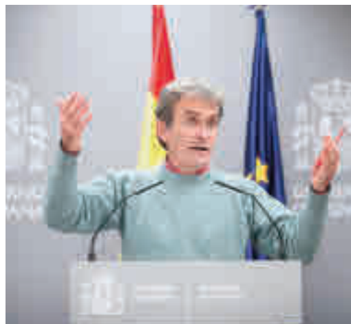
Fernando Simón, en una comparecencia reciente

EL PERIÓDICO GENTE NO SE RESPONSABILIZA NI SE IDENTIFICA CON LAS OPINIONES QUE SUS LECTORES Y COLABORADORES EXPONGAN EN SUS CARTAS Y ARTÍCULOS