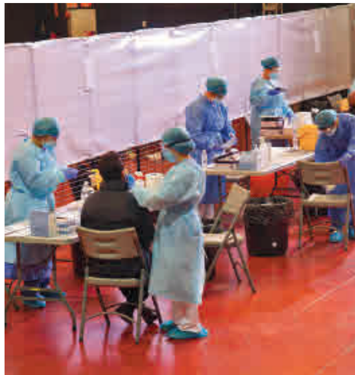
Test de antígenos en Alcobendas

Aunque el resto de ZBS de Alcobendas y Sanse no se acercan a ese dato, sí que llama la atención el hecho de que mientras algunas experimentan leves descensos, en otras la tasa de infectados continúa creciendo. Esos son los casos de Rosa Luxemburgo (tasa de incidencia acumulada de 443); en San Sebastián de los Reyes, y La Moraleja (361), Chopera (435) y Marqués de la Valdavia (324), pertenecientes a Alcobendas.