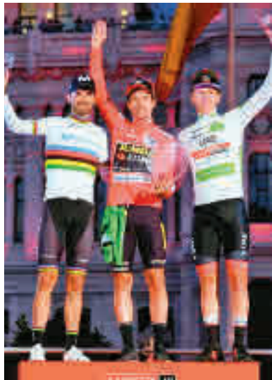
Podio del año pasado

Lo que no ha variado respecto a ediciones previas es