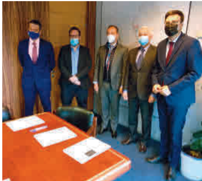
Representantes de diferentes localidades

Por esta razón, los ayuntamientos de estas dos localidades, Madrid y Paracuellos de