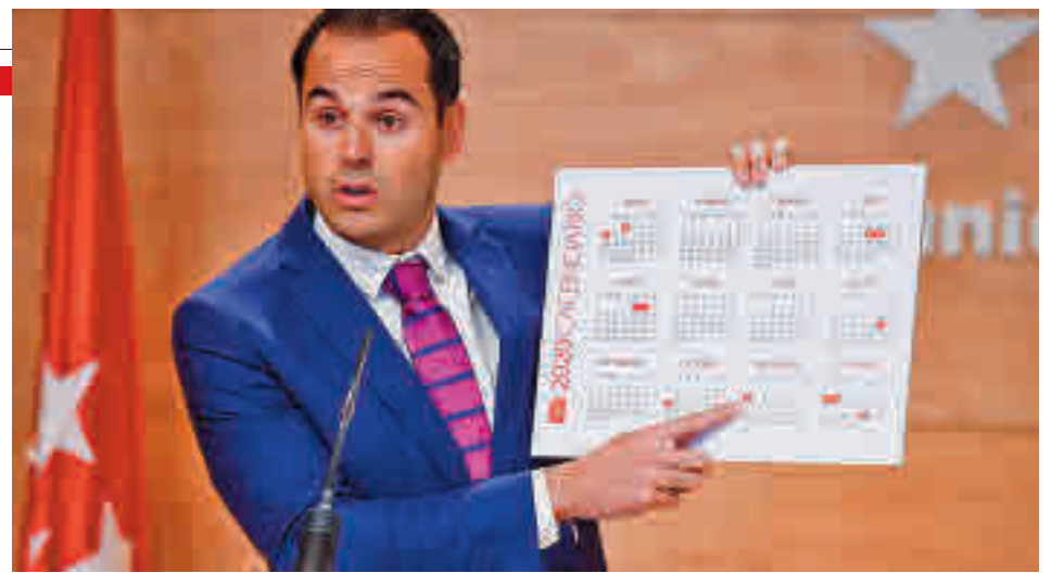
Ignacio Aguado, durante la presentación del calendario laboral de 2020

munidad (si es que se puede) serán los cinco días del Puente de Diciembre (del sábado 4 al miércoles 8, aunque el martes 7 es laborable) o las cuatro jornadas de la Semana Santa (del jueves 1 al domingo 4 de abril). El resto será para escapadas cortas.