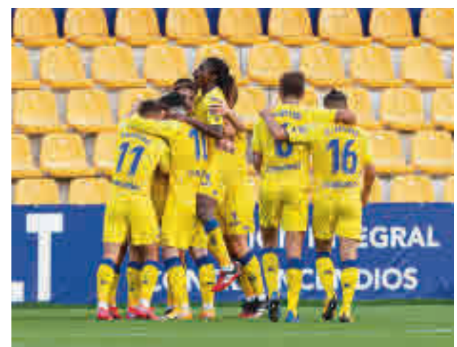
El Alcorcón solo ha ganado un partido esta temporada

En esa parte noble está instalado el Leganés, que visita este viernes al Albacete, mientras que el Rayo, que es quinto, recibirá el domingo (16 horas) al Almería.