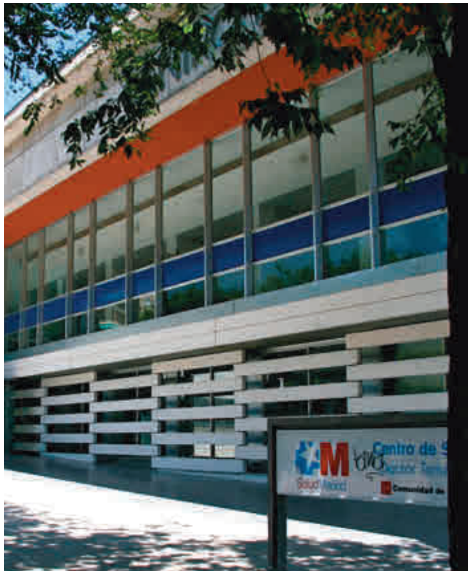
Centro de Salud de Doctor Tamames. en Coslada

En el caso de Doctor Tamames, su tasa se ha rebajado levemente, hasta los 615