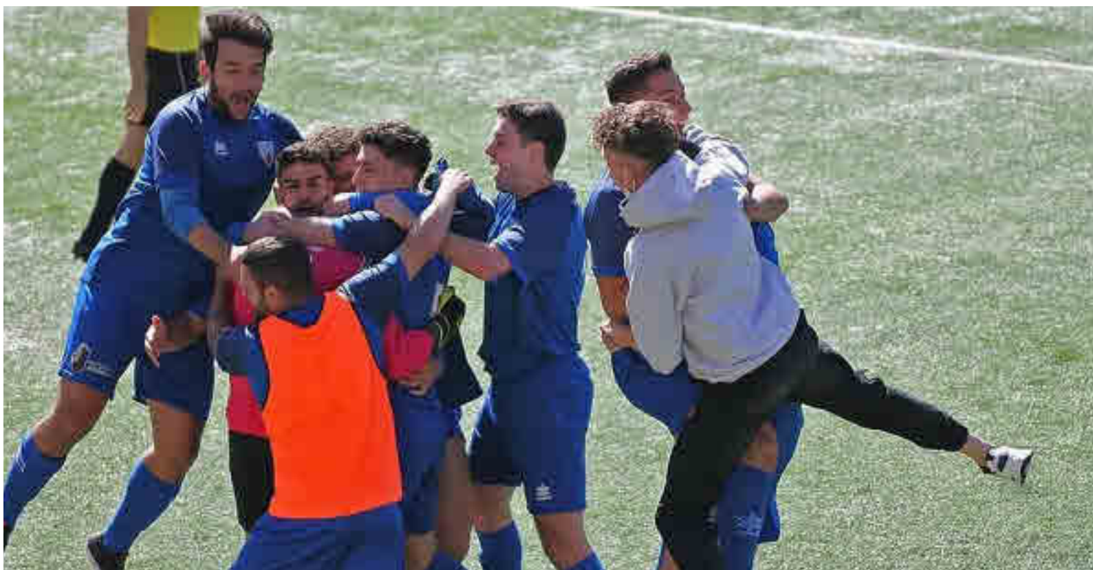
En pocos meses, el Móstoles CF ha pasado de jugar en Preferente a disputar la Copa del Rey