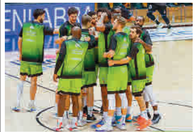
El Urbas Fuenlabrada ha logrado tres triunfos seguidos

El Club de Campo defiende este domingo su liderato ante el RC Polo. Segundo es el SFV Complutense, que recibirá a la UD Taburiente.