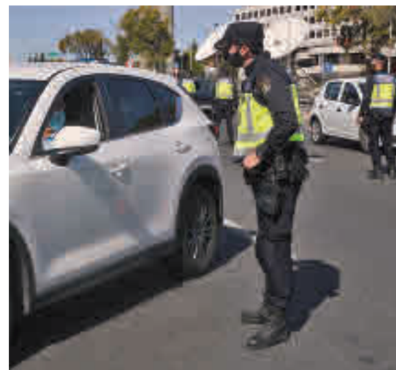
Control policial en la Comunidad de Madrid

nes 6 para evitar entradas y salidas no justificadas con motivo del Puente de La Almodena. La medida estará en vigor hasta el próximo martes 10 de noviembre, día en el que ya se podrá