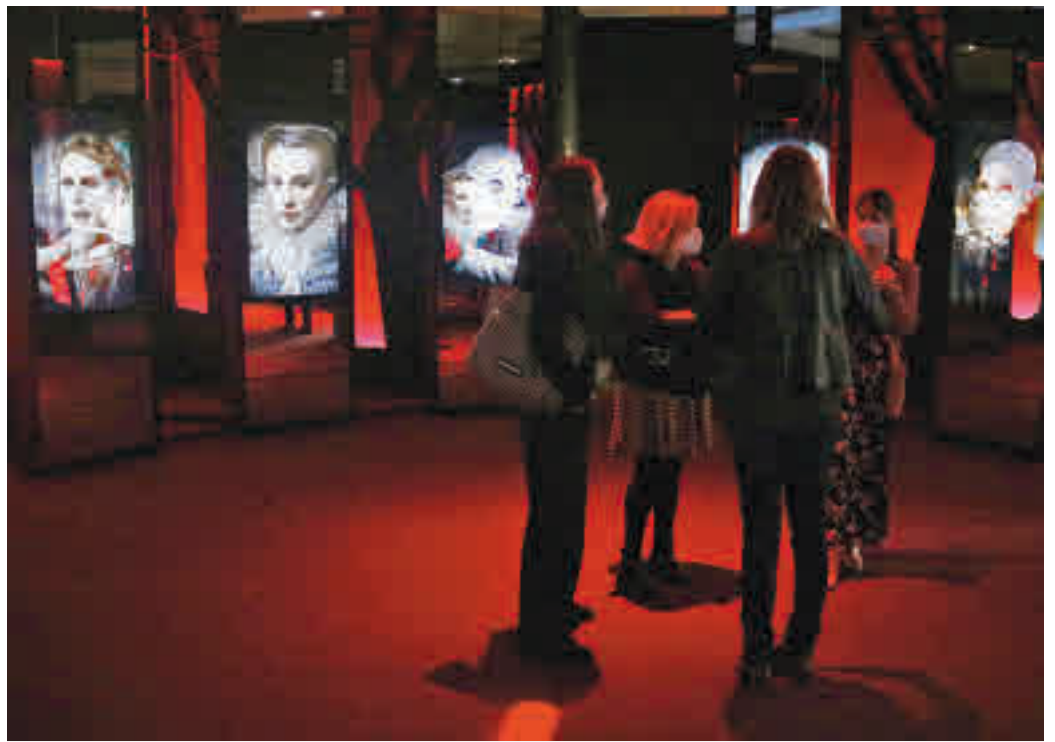
Una de les sales de l'exposició del CaixaForum sobre vampirs.

Entre les peces incloses, s'inclou una reproducció del guió de Bram Stoker per a la primera adaptació de 'Dràcula' al teatre, vestuari per a les pel·lícules 'Dràcula' de Francis Ford Coppola i 'Entrevista amb el vampir' de Neil Jordan, gravats de Goya, obres de Jean-Michel Basquiat, o la màscara i altres ob-