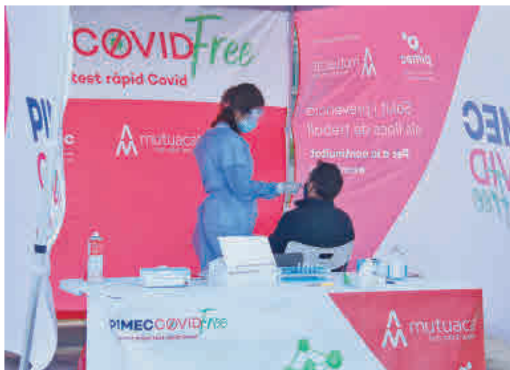
Realització de tests d'antígens al polígon de Sant Quirze del Vallès.

Amb les xifres actuals, només es compleix el requisit