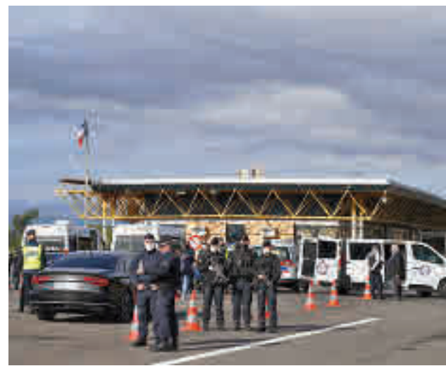
Despliegamiento policial per evitar infraccions. ACN

El polifacético Mario Vaquerizo forma parte del reparto de la obra teatral 'La última tournée'