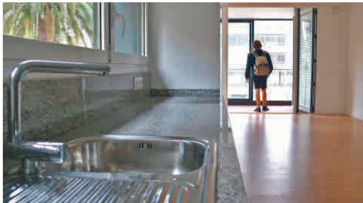
Interior d'un dels pisos d'una promoció d'habitatge al carrer Comte Borrell.

CCOO ha afirmat també que tant la prestació extraordinària anunciada aquest dimarts pel Ministeri de Treball per a les persones desocupades que van exhaurir la seva prestació entre el 14 de març i el 30 de juny, com els 102,6 MEUR anunciada pel Govern -dels quals 40 MEUR corresponen a la Renda Garantida de Ciutadania- són insuficients.