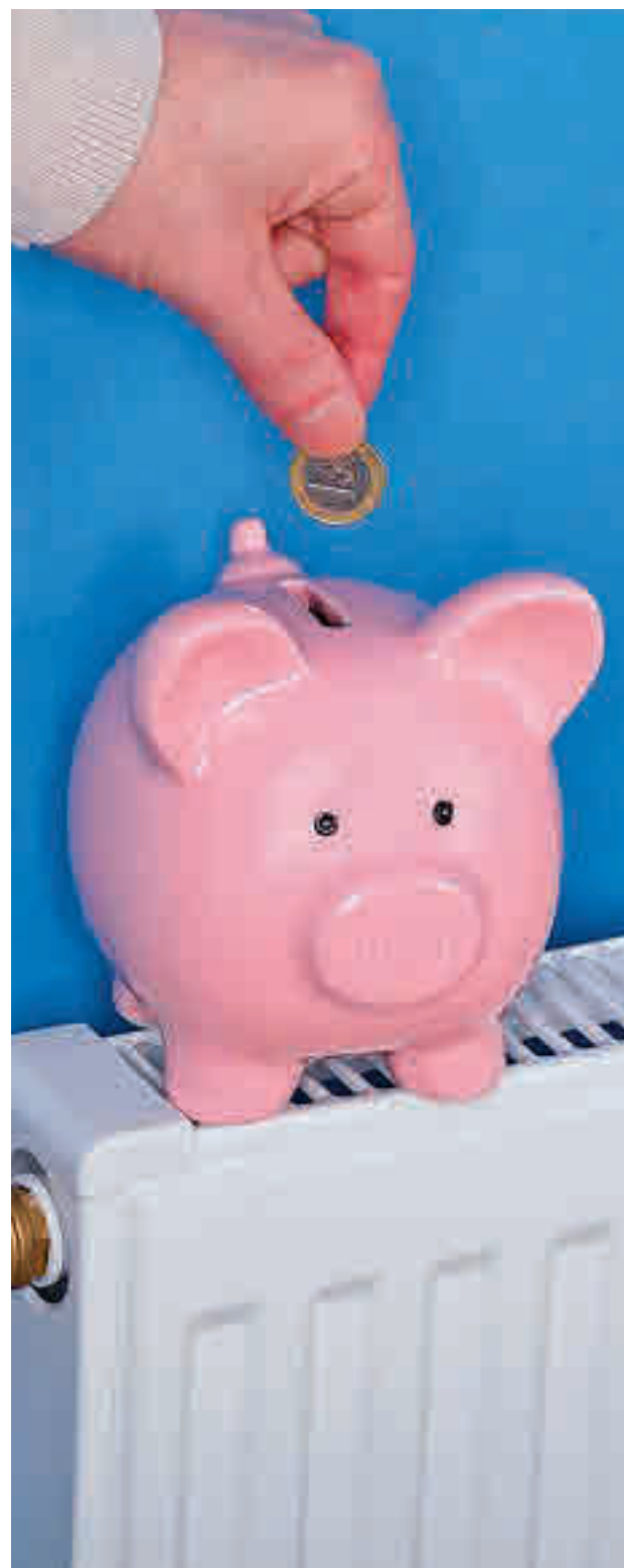
El gasto energético se dispara en invierno

6: Las fuentes de energía renovables como la aerotermia (bomba de calor que utiliza aire) o la geotermia (calor de agua que viene del subsuelo) suponen grandes ahorros, aunque es necesario que la vivienda sea compatible,