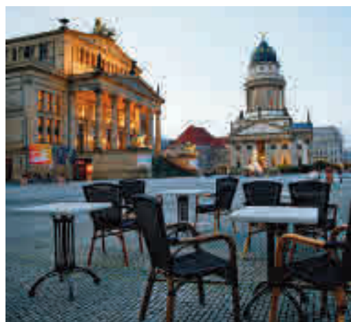
Una terrassa buida en una plaça de Berlín.

EL PERIÓDICO GENTE NO SE RESPONSABILIZA NI SE IDENTIFICA CON LAS OPINIONES QUE SUS LECTORES Y COLABORADORES EXPONGAN EN SUS CARTAS Y ARTÍCULOS