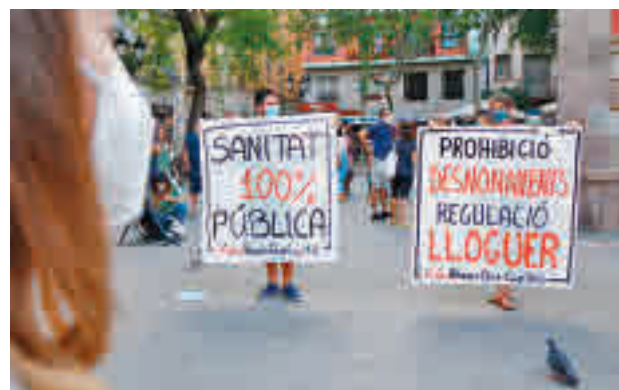
Manifestación para regular los precios del alquiler.

Son datos recogidos en el laboratorio 'La oferta y la demanda de viviendas de alquiler. Datos mensuales de los portales inmobiliarios. Julio 2020', y que que analizan