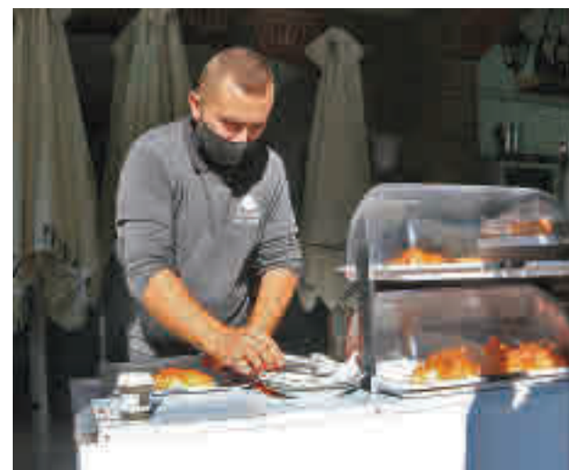
Un cambrer preparant menjar per emportar.

Segons han anunciat, seran ajuts de 750 euros i s'hi podran acollir persones amb ingressos de fins a 18.555 euros entre gener i setembre.