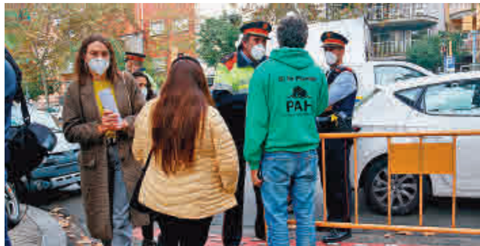
La PAH conversa amb agents dels Mossos després de la suspensió d'un desnonament.

Amb el decret, l'executiu "vol assegurar que les persones amb risc d'exclusió residencial puguin romandre al domicili mentre duri l'estat d'alarma", ha afegit. El decret no afecta els inquilins de pisos propietat de petits tenidors. Però sí a famílies que ja van declarar-se vulnerables el 2019.