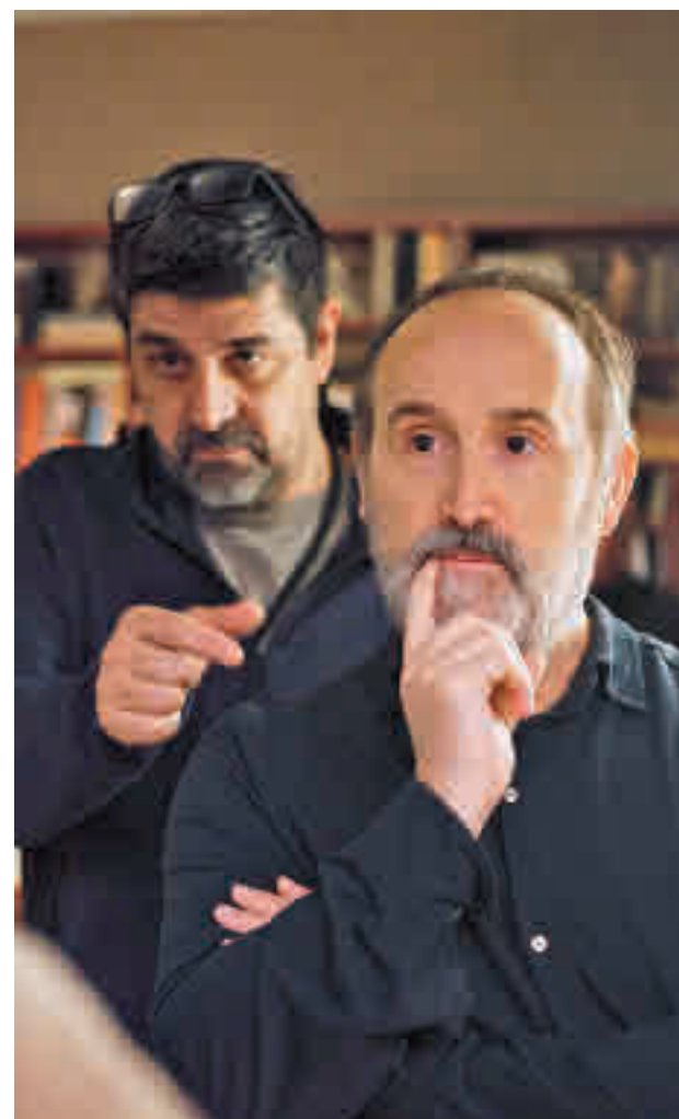
El rodatge va finalitzar una setmana abans del confinament.

La pel·lícula, en tot cas, s'estrena encara en plena crisi sanitària. I tot i que no hi hagi referències directes a la situació, en el relat d'un matrimoni immers en una crisi que esclata dins de casa hi poden ressonar els mesos de confinament. Per Gay, però, tot plegat es pot mirar en clau positiva. "Com els passa als protagonistes de la pel·lícula, la situació actual pot generar divorcis però també fer sortir coses que estaven tapades, i que es posen sobre la taula. A vegades això ajuda a fer net". I és que no totes les crisis condueixen a la ruïna.