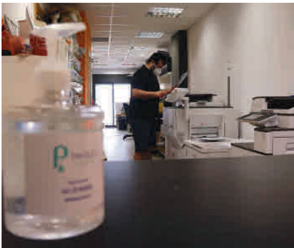
Un empresari autònom d'arts gràfiques.