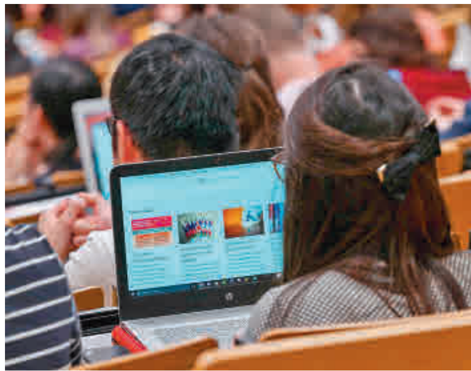
Aquest dimecres s'han repartit 15.000 connectivitats a alumnes.

Els resultats indiquen on és que s'ha de prioritzar l'entrega d'aquests dispositius i aquestes connexions, que ha començat aquesta setmana. En concret, aquest dimecres s'han començat a repartir 15.000 connectivitats entre