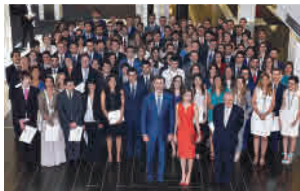
Una de las promociones becas por 'la Caixa'

En cuanto a las disciplinas elegidas por los becarios, destacan las formaciones en