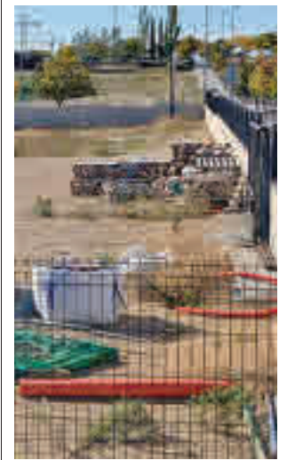
Estado de las obras

Toda la información de Tres Cantos y Colmenar, en la web.