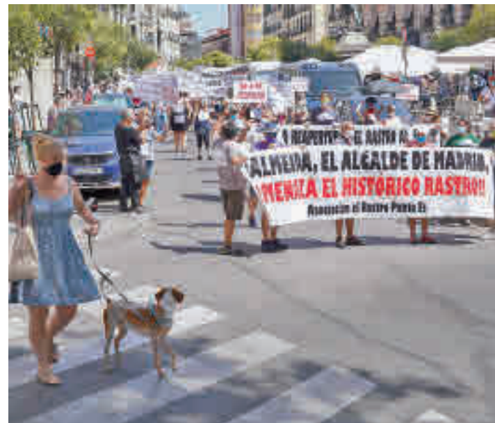
Una de las múltiples protestas de los comerciantes

"Pondremos todos los esfuerzos necesarios. Hay cuestiones logísticas a establecer, cuestiones prácticas de los comerciantes a solucionar para que sea este domingo. Y