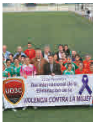
Homenaje de UD Tres Cantos

En el marco de las celebraciones del 25 de noviembre, Día Internacional de la Eliminación de la Violencia contra la Mujer, el Ayuntamiento de Tres Cantos ha aprobado una declaración institucional contra la violencia