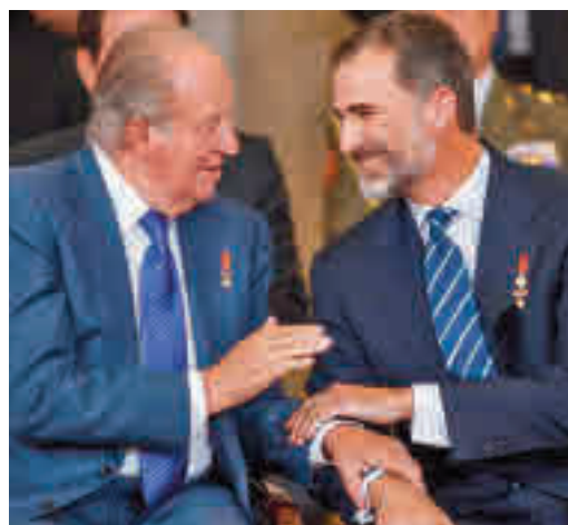
El rey emérito, junto a su hijo, Felipe VI

EL PERIÓDICO GENTE NO SE RESPONSABILIZA NI SE IDENTIFICA CON LAS OPINIONES QUE SUS LECTORES Y COLABORADORES EXPONGAN EN SUS CARTAS Y ARTÍCULOS