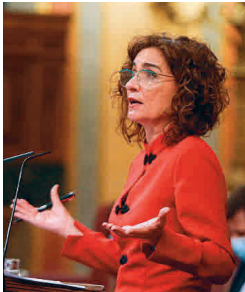
María Jesús Montero, en el debate de los presupuestos

Sin embargo, la organización espera que esta propuesta se acompañe finalmente de una significativa reducción del precio máximo en todas las mascarillas, no solo las quirúrgicas, y pide al Gobierno que contemple el reparto gratuito de mascarillas