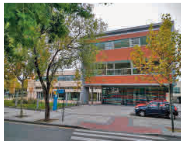
Fachada del edificio

Para ello, los profesionales del centro ofrecerán actividades de lunes a viernes en distintos horarios a elegir entre baile y castañuelas; gimnasia de mantenimiento, estiramientos y pilates; manejo