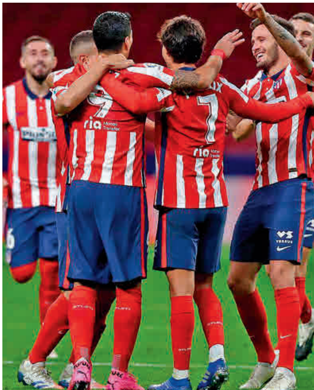
La alegría reina en el vestuario del Atlético de Madrid

peón en la campaña 2013-2014. Con un balance de 17 puntos sobre 21 posibles, los de Simeone están lejos del pleno que sumaban aquel curso después de 7 jornadas. Sin embargo, sí comparten el hecho de tener su casillero