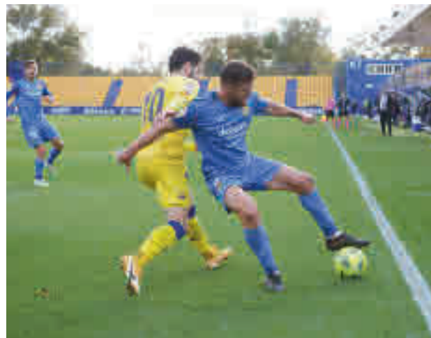
El Fuenlabrada se llevó los tres puntos de Santo Domingo

Los otros dos representantes de la región afrontan una fecha complicada. El Fuenlabrada ejercerá como local este sábado 14 (14 horas) ante un Espanyol que es líder gracias