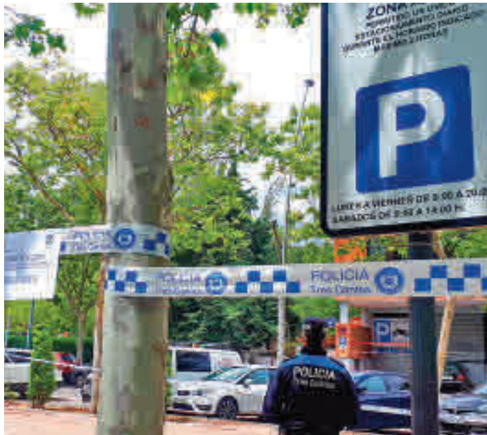
La Policía Local vela por la seguridad vial

“La mayor parte de los problemas de atascos que se sufren en la ciudad vienen derivados de vehículos que se encuentran mal estacionados, principalmente en doble fila, o sobre pasos de cebra, o en cruces de calles que obstaculizan el paso a otros vehículos, que además de infringir las normas de circulación suponen un grave peligro para la seguridad vial”. Así expli-