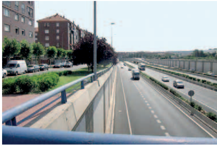
La circunvalación de Logroño LO-20 está limitada a 80 km/h.

El nuevo anteproyecto modifica la velocidad en las ciudades, limitándola a 30 kilómetros por hora en vías de un único carril por sentido de circulación, a 50 km/h en vías de dos o más carriles por sentido y la rebaja a 20 km/h en calles de plataforma única de calzada.