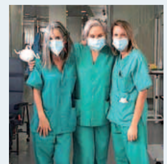
Doctoras del hospital San Pedro.

estos pero me hacen sentirme seguro. Así que no solo ellos, sino todos los pacientes actuales y futuros debemos luchar porque esta Sanidad Pública se mantenga, y si puede ser -que sí puede ser-, que vaya a mejor, porque ello redundará en beneficio de todos. El personal hospitalario, seguro que con mejores y más medios, nos podrán 'parhear' mejor. Así que si un día se manifiestan para luchar por ello, que cuenten conmigo, que tengo probada experiencia... Estuve en la famosa huelga del metal del 79... Por cierto, ¡qué jóvenes éramos!