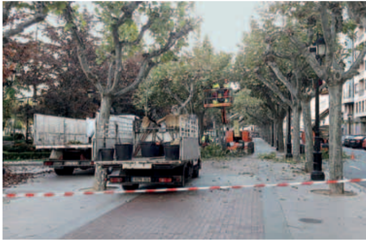
Trabajadores de Parques y Jardines podan los árboles del Espolón sobre una grúa.

Hasta mediados de marzo también se aprovechará para "la revisión, mantenimiento y conservación del ramaje débil o enfermo de los 43.600 árboles de la ciudad para garantizar su buen estado y la