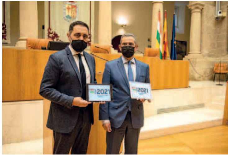
González con el presidente del Parlamento en la entrega de los presupuestos.

Por departamentos, el Servicio Riojano de Salud (Seris) y la Consejería de Salud elevan su cuantía presupuestaria un 25% y un 15%, respectivamente. Entre las áreas de Gobierno que más crecen porcentualmente están también