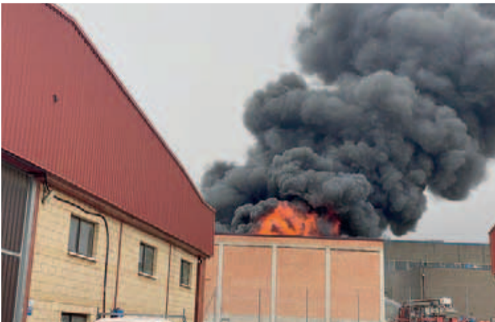
El fuego afectó a una de las ocho naves de Kupsa Coatings.

El fuego en la factoría, a escasos metros del límite provincial con La Rioja y a menos de 4 kilómetros del centro de Logroño, se produjo el miércoles 11 sobre las 12.50 horas, cuando consta un primer aviso al SOS Rioja 112 que movilizaba de inmediato a recursos de emer-