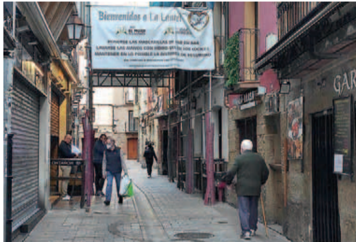
Los establecimientos hosteleros de Logroño permanecen cerrados.

En la nueva reunión mantenida el martes 10 entre el Gobierno regional y los hosteleros riojanos, la tercera desde que se puso en marcha el grupo de trabajo, los representantes del sector solicitaron la apertura de algunas terrazas con condiciones especiales de "burbuja social" planteando la posibilidad de "reducir el número de personas por mesa, que sean del mismo núcleo familiar, y que cuenten con mayor distancia para así evitar la concentración de per-