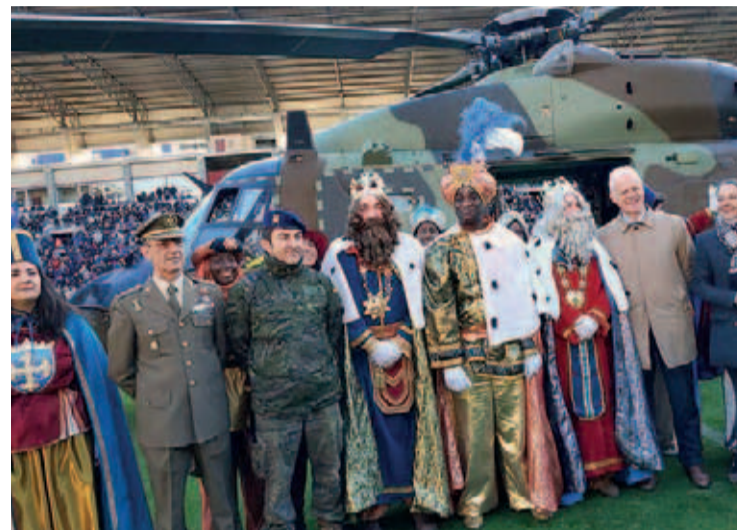
Llegada de Sus Majestades los Reyes Magos de Oriente a Las Gaunas en 2020.

Respecto a la salubridad en la ciudad, Adda Ops SA se encargará del control de la población de palomas por un importe de 35.670,48 euros durante un año, desde el día 16. El contrato incluye diferentes servicios como el ahuyentamiento.