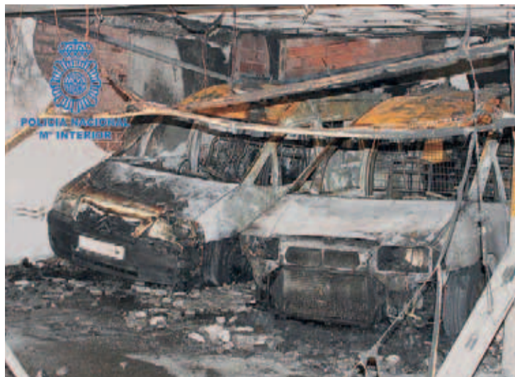
Destrozados causados por los acusados en un garaje de la capital riojana en 2018.

El 14 de junio de aquel año, dos de los acusados prendían fuego de madrugada a un vehículo estacionado en la calle Los Olivos de Lardero y el 4 de julio quemaban un ciclomotor previamente sustraído de un garaje de la calle Fundición, así como otro vehículo robado en el camino de Prado Viejo.