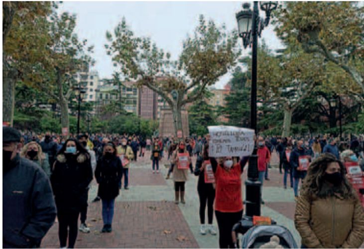
La protesta del jueves 12 en el Espolón congregó en torno a 2.000 personas.