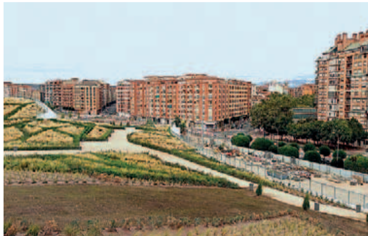
En 2021 se hará el pago final de la deuda de la integración del ferrocarril en la ciudad.