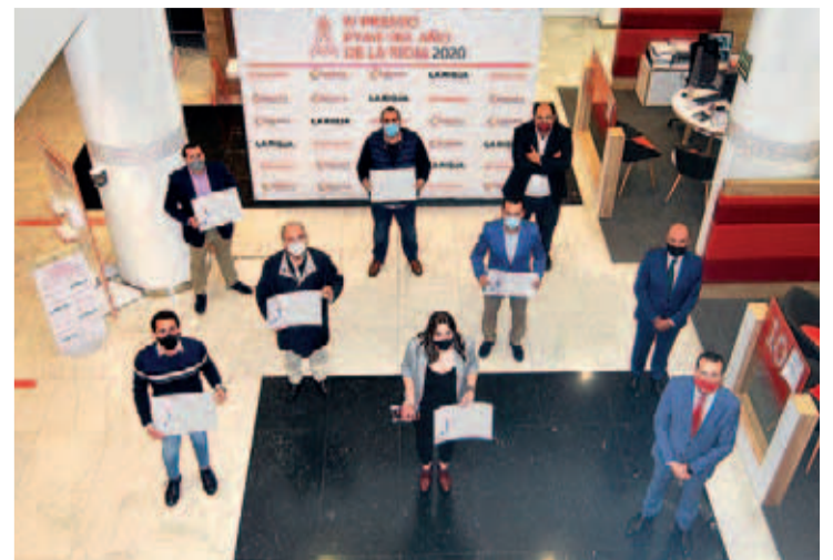
Foto de familia de la entrega del Premio Pyme de La Rioja 2020.