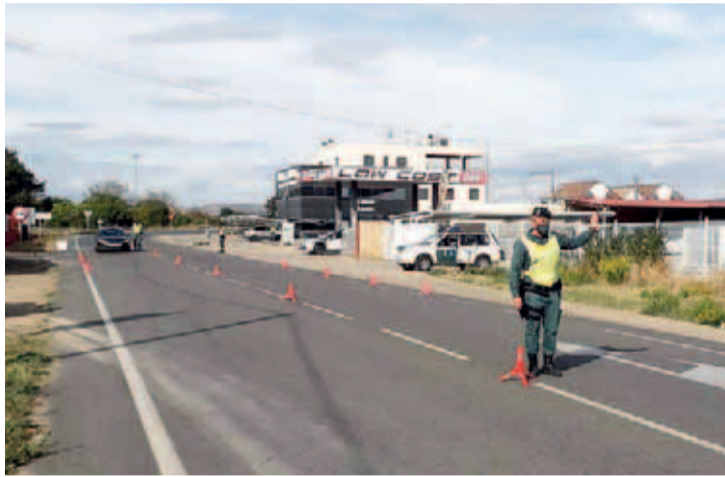
No se puede entrar ni salir de La Rioja, ni de Arnedo y Logroño dentro de la comunidad.

En esos siete días se identificó a 152 personas por no cumplir el confinamiento nocturno, 96 en Logroño, y se propusieron 9 sanciones por reuniones y encuentros