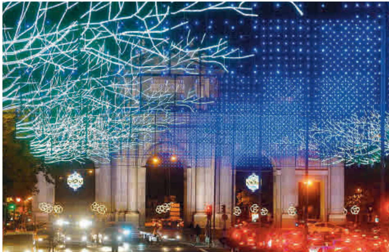
Los motivos navideños de la Puerta del Alcalá

Toda la actualidad de los distritos de Madrid en nuestra web