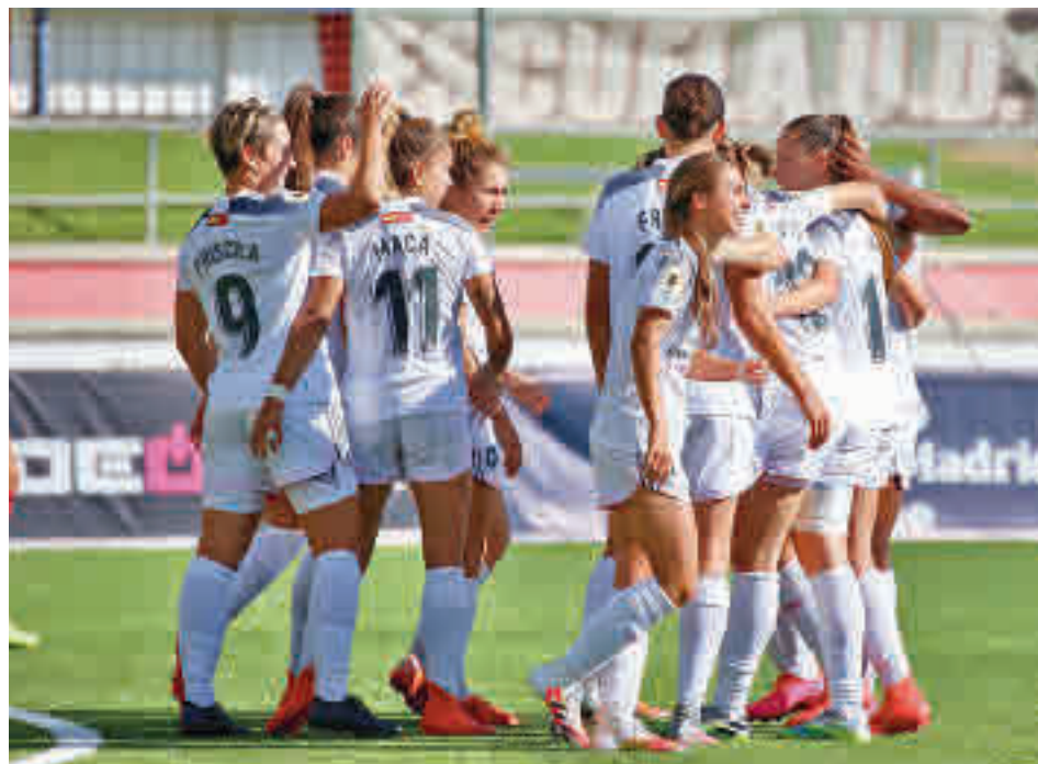
El Madrid CFF está firmando una temporada notable