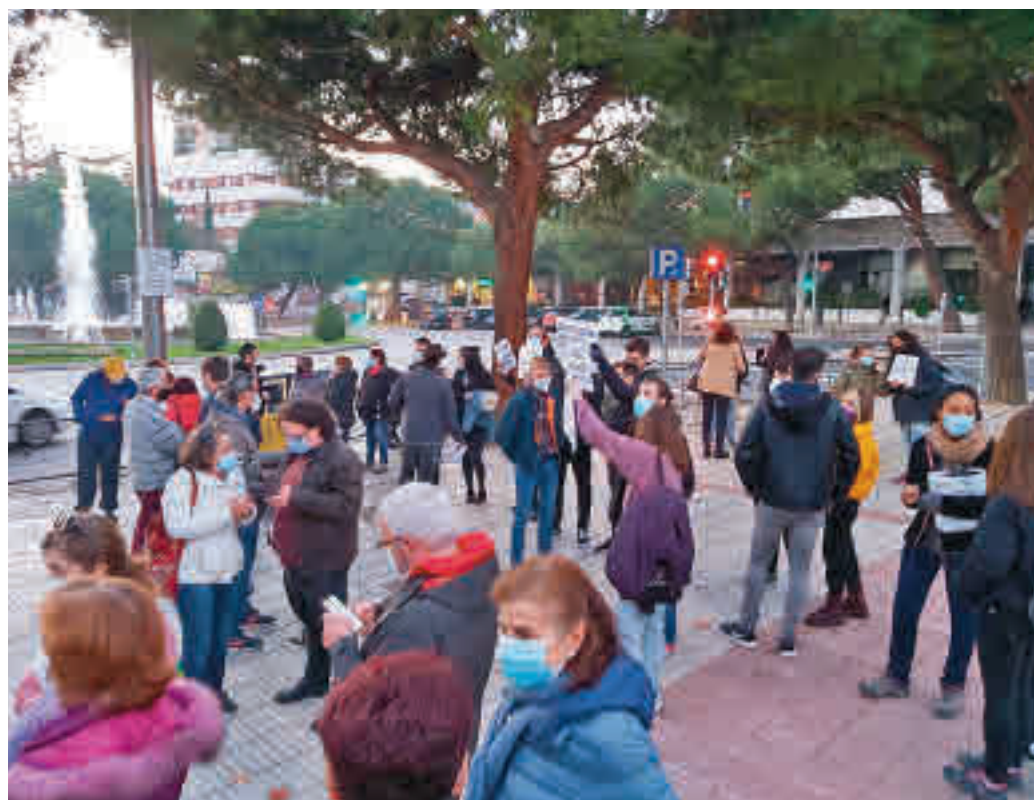
La protesta vecinal del pasado 18 de noviembre

Los voluntarios realizarán actividades y juegos sobre la importancia del uso de la mascarilla y del respeto a las medidas de seguridad. La intervención estará adaptada a la normativa sanitaria actual, en el marco del programa 'QuedaT' de intervención socioeducativa a través del ocio y tiempo libre para jóvenes de 14 a 20 años.