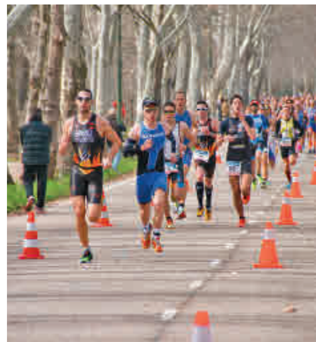
Imagen de una edición anterior

Por su parte, al Madrid CFF esos tres últimos puntos le han servido para escalar posiciones hasta situarse en la novena plaza gracias a las 12 unidades que acumula, las mismas que el octavo, el Sevilla, y a solo una del Levante y el Valencia, equipo este último que cuenta con tres partidos más que el conjunto de la capital y con el que, además, se enfrentará en la jornada del 6 de diciembre en el campo de Matapiñoneira-José Luis de la Hoz.