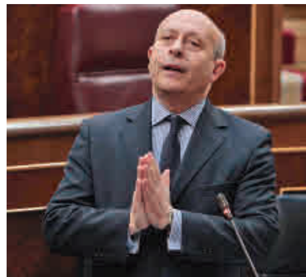
José Ignacio Wert

Posteriormente llegarían la LOPEG de 1995 y la LOCE, promulgada en 2002 con José María Aznar en el poder y paralizada en el 2004 por José