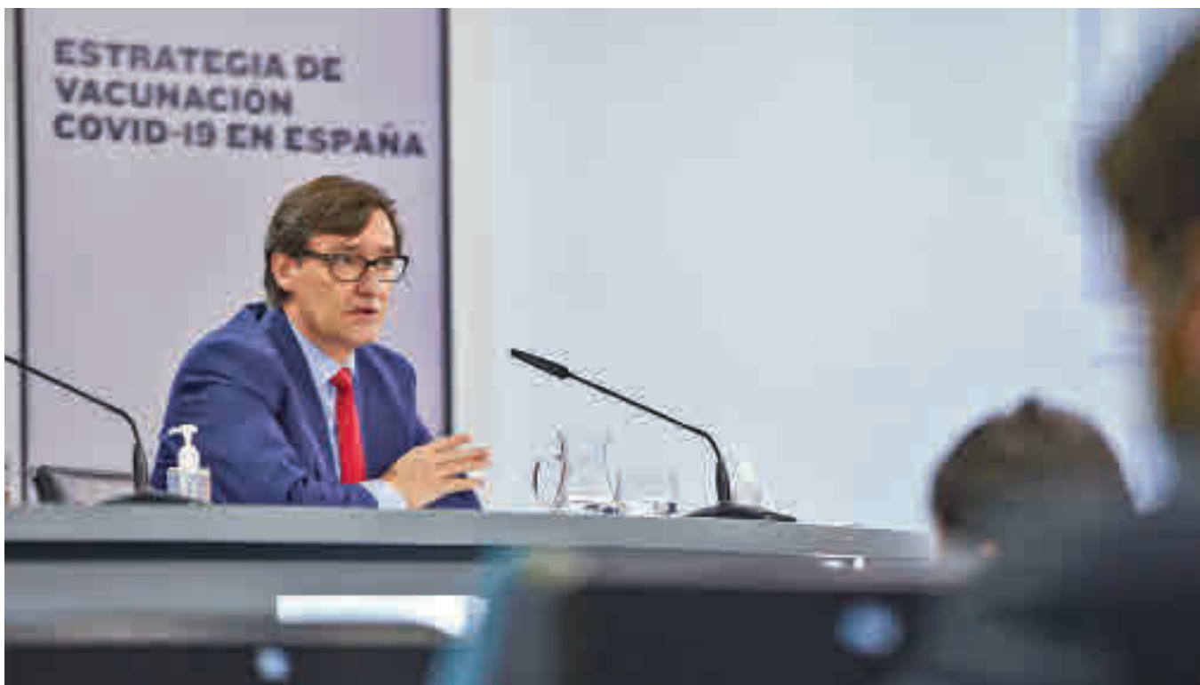
Salvador Illa, durante la presentación del plan de vacunación