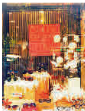
Un escaparate del año 2019

actividad, podrán inscribirse hasta el 30 de noviembre de forma telemática presentando una instancia general normalizada en la sede de Madrid.es, de forma presencial registro de la propia Junta (calle de Simancas, 6) o en cualquier oficina de Línea Madrid.