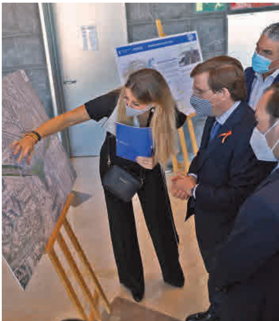
El alcalde recibe explicaciones del proyecto en uno de los paneles

La reforma eliminará los citados cuatro trenzados, que serán sustituidos por nuevos pasos a distinto nivel: tres son inferiores y uno superior, el de la M-607, con conexión al paseo de la Castellana. También se va a proceder a la reorde-