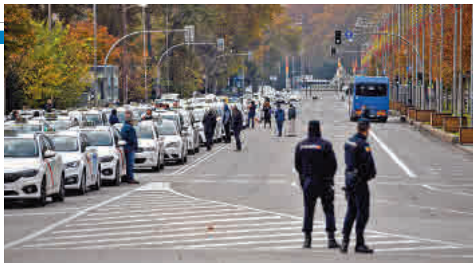
Imagen de las protestas

vilidad, Borja Carabante, ha indicado que el estado de alarma no permite regular la oferta como sí lo hacía el de marzo, pero que si se incluye en el decreto actual se tomaría "de inmediato". Asimismo, recuerda que "en el corto y medio plazo" no tienen estas facultades.