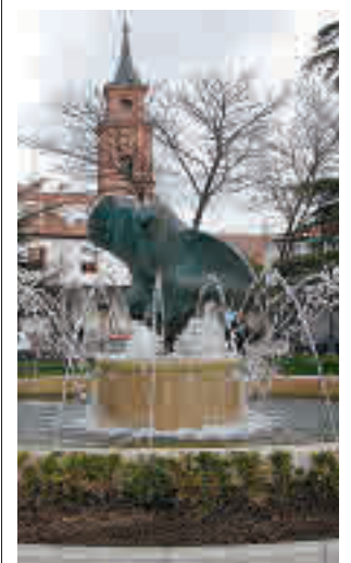
La plaza Mayor de Barajas

LOS RESIDENTES ANUNCIAN NUEVAS MOVILIZACIONES A CORTO PLAZO