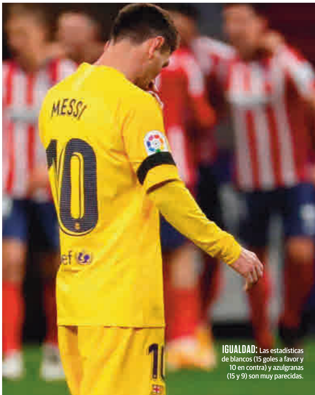
IGUALDAD: Las estadísticas de blancos (15 goles a favor y 10 en contra) y azulgranas (15 y 9) son muy parecidas.

2014, la excepción que confirma la regla. El Barça era líder en la octava fecha gracias a su pleno de puntos, con el Madrid sumando 22 en 9 fechas. La principal diferencia es que les aguantaba el paso un Atlético que terminaría siendo el más regular.