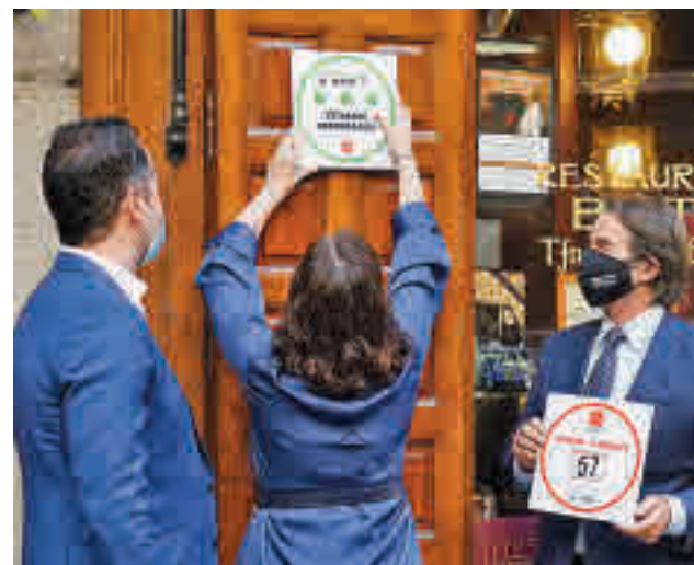
La hostelería también se prepara para la Navidad