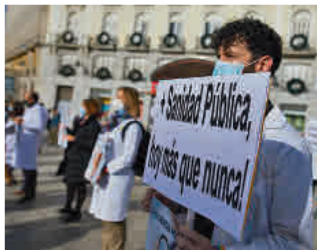
Protesta de los médicos en la Puerta del Sol