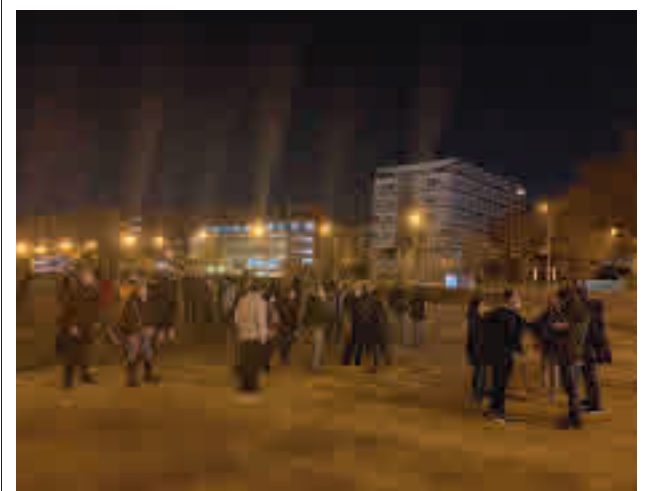
Una de las movilizaciones vecinales de los últimos meses

Según fuentes policiales, la investigación arrancó en julio, cuando los agentes tuvieron conocimiento de la existencia de un punto de venta de sustancias estupefacientes. Las averiguaciones practicadas permitieron a los agentes localizar la vivienda.