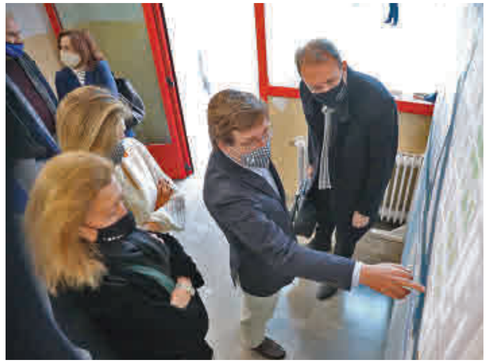
El alcalde de Madrid, José Luis Martínez-Almeida, presentó el proyecto el 30 de noviembre

Por otro lado, los trabajos incluirán la plantación de 330 árboles que se dispondrán en las aceras y en la mediana central tanto en Joaquín Costa y Francisco Silvela como en el tramo que se recupera