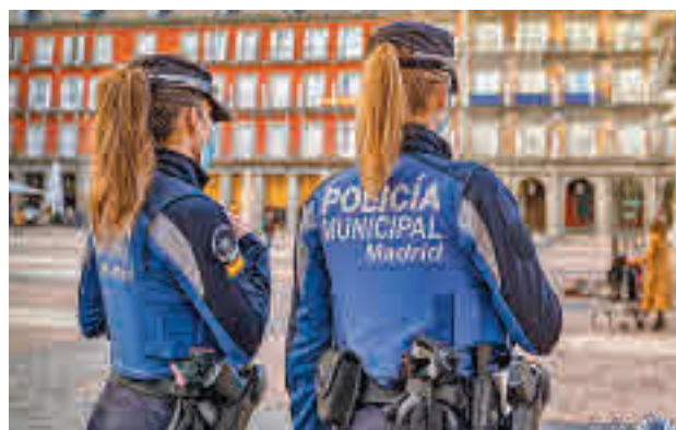
Dos agentes patrullan a pie por la Plaza Mayor

Desde el pasado viernes 27 de noviembre y hasta el 7 de enero, un dispositivo de Policía Municipal controla los