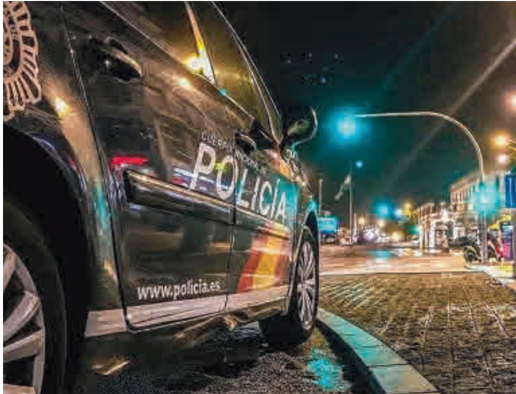
El 59% de los delitos denunciados en la región de Madrid, tuvieron lugar en la capital

Sin embargo, a diferencia del conjunto de España, tanto en la Comunidad de Madrid como en la capital los