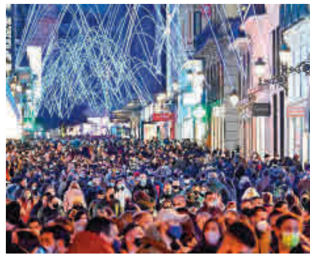
Los madrileños no podrán salir de la región