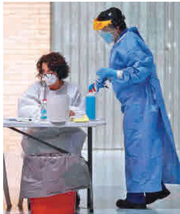
La incidencia ha bajado en toda la zona Sur

A continuación de Parla nos encontramos a la ciudades vecinas de Pinto y Valdemoro, con número muy similares. La localidad pinteña registra 207 positivos por cada 100.000 habitantes tras acumular tres descensos consecutivos en las últimas semanas desde los 382 casos que tenía el pasado 10 de noviembre. En cuanto a Valdemoro, ha compensado el ligero repunte de la semana pasada,