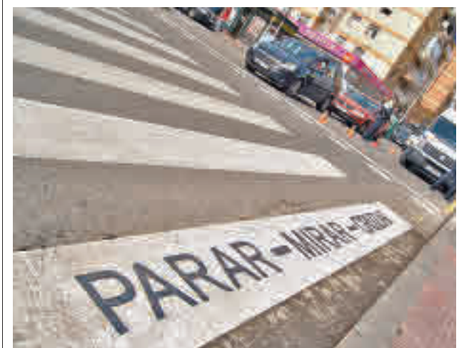
El galardón reconoce la labor en educación vial