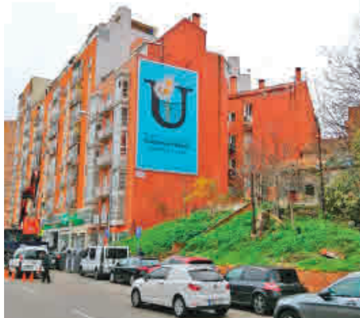
Uno de los carteles instalados en un edificio de la avenida de Córdoba

'Confía en Usera. Compra en Usera' es el lema de la campaña puesta en marcha por la Junta Municipal para fomentar y apoyar al comercio de proximidad en su distrito. Esta iniciativa estará en la calle hasta finales del mes de diciembre y cuenta con una inversión superior a 20.000 euros. Según fuentes municipales, se busca así impulsar el consumo en las tiendas de