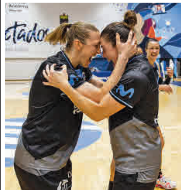
El cuadro colegial atraviesa un buen momento

La undécima jornada de la máxima categoría nacional femenina de voleibol depara un interesante partido entre el Madrid Chamberí y el segundo de la tabla, el Avarca Menorca, este sábado (19 horas).