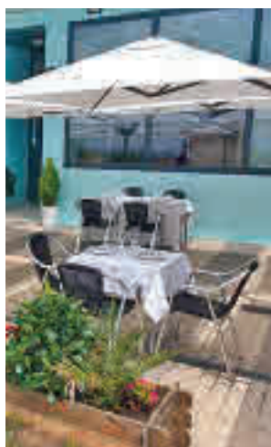
Una ayuda para la hostelería

Concejalía de Hacienda para suprimir en 2021 la tasa por ocupación de terrenos de uso público por mesas y sillas con finalidad lucrativa (terrazas), así como la propuesta para suprimir la tasa por instalación de puestos, barracas, ca-