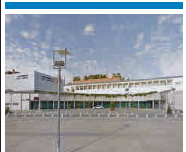
El Consistorio destina más de 460.000 euros para este fin

De este modo, la Concejalía de Cultura anunciaba la activación de la venta de entradas para los espectáculos que se irán sucediendo por las tablas de este recinto, arrancando este viernes 4 con 'Maestrissimo (Pagagnini 2)', para dar paso al concierto de la Constitución (sábado 5) y 'Crusoe' para este domingo 6. Como siempre, los tickets para estos eventos se pueden adquirir de forma telemática (a través de la web Auditorio.colmenarviejo.com) y de forma física en las taquillas del Auditorio los viernes, sábados y domingos.