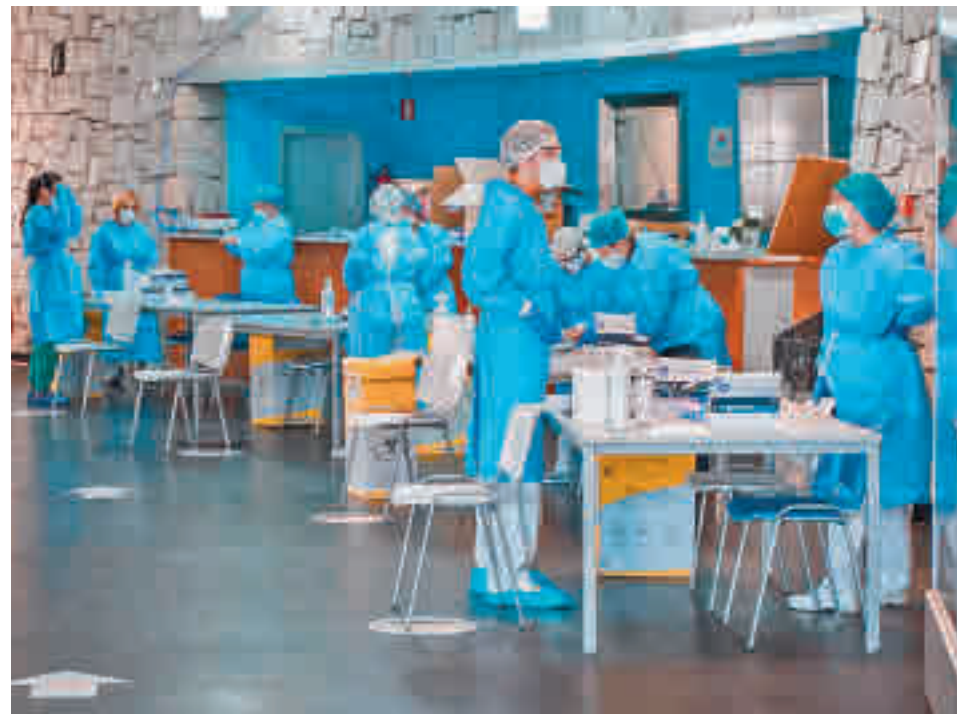
Test de antígenos en Colmenar Viejo

Esa tendencia a la baja se ha mantenido en los últimos siete días, tal y como confirmó el balance epidemiológico del Gobierno regional publicado el pasado martes. En concreto, la ZBS de Colmenar Viejo Norte tiene un tasa de 239 casos por cada 100.000 habitantes, con 44 positivos detectados en las últimas dos semanas. Por unas cifras similares se mueve el otro área