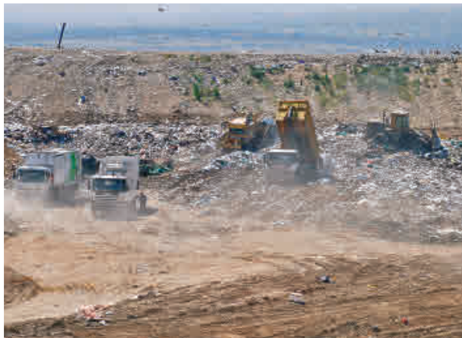
Imagen de uno de los vasos de este emplazamiento

gentedigital.es Toda la actualidad de Tres Cantos y Colmenar, en la web.