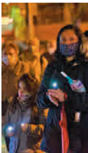
La protesta vecinal