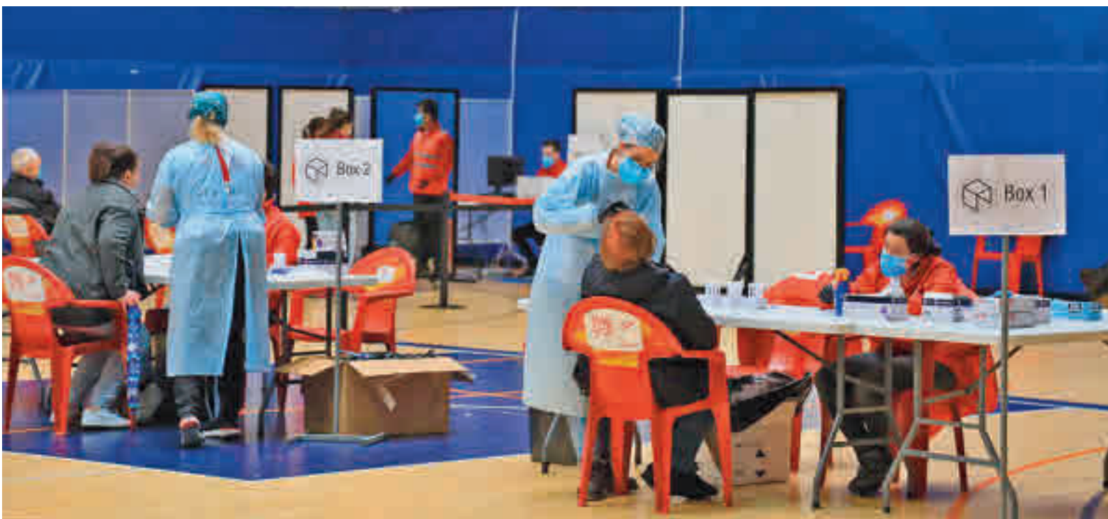
La incidencia ha bajado en Getafe