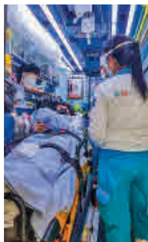
Traslado al hospital

Fue la propia madre la que llamó señalando que había