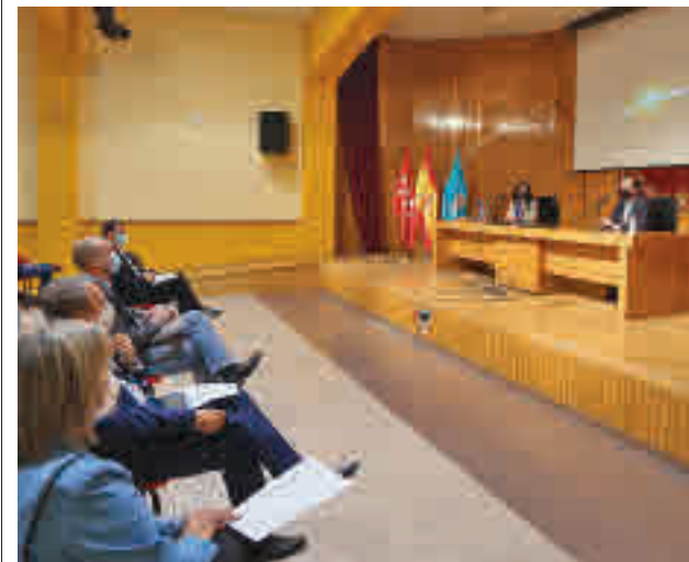
Presentación de la Liga de Debate Escolar

Cada centro educativo leganense podrá presentar al certamen un equipo de nueve personas: cuatro alumnos titulares y dos suplentes, un profesor titular y un suplente y un coordinador. El equipo ganador al completo tendrá una beca de gratuidad para cada uno de sus miembros en dos cursos de verano organizados por UNED Madrid Sur. El combinado finalista obtendrá una beca para uno de ellos.