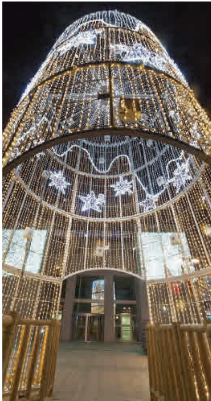
Iluminación navideña de Leganés