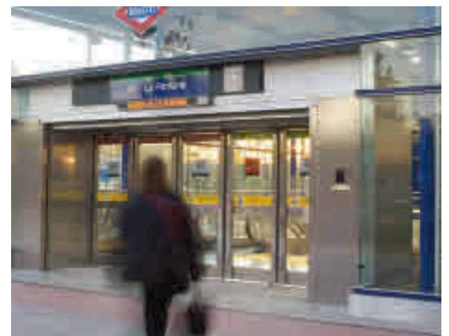
Estación de Metro de La Fortuna