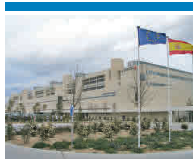
Hospital Universitario de Fuenlabrada