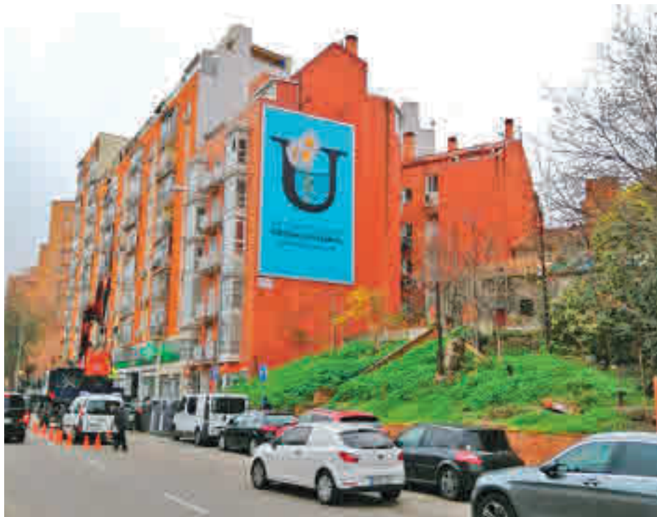
Uno de los carteles instalados en un edificio de la avenida de Córdoba, 8

Su objetivo es informar de las medidas que deben tomar los comerciantes para que los vecinos puedan seguir comprando en condiciones de seguridad, confiando y consumiendo en sus comercios más cercanos "Tras el esfuerzo y la conducta ejemplar de nuestros vecinos para ser uno de los barrios con menos incidencia de la Covid-19, toca no bajar la guardia y apoyar con determi-