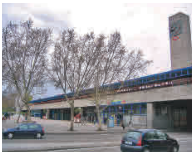
El intercambiador de transportes de Aluche

Águilas, Doce de Octubre, Laguna y Puente Alcocer. La licitación de los contratos de consultoría y asistencia técnica para la redacción de los proyectos básicos y de construcción de todas estas actuaciones tiene un presupuesto de 2,8 millones de euros. Estos proyectos forman parte del Plan de Mejora de Cercanías de la Comunidad de Madrid.