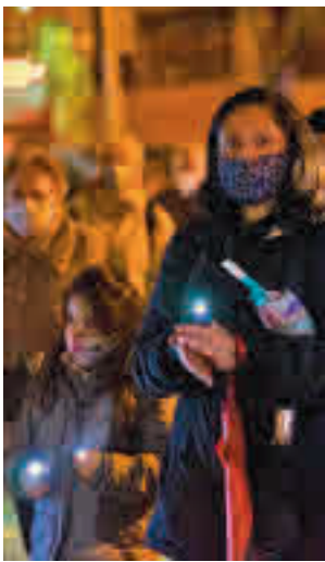
La protesta vecinal