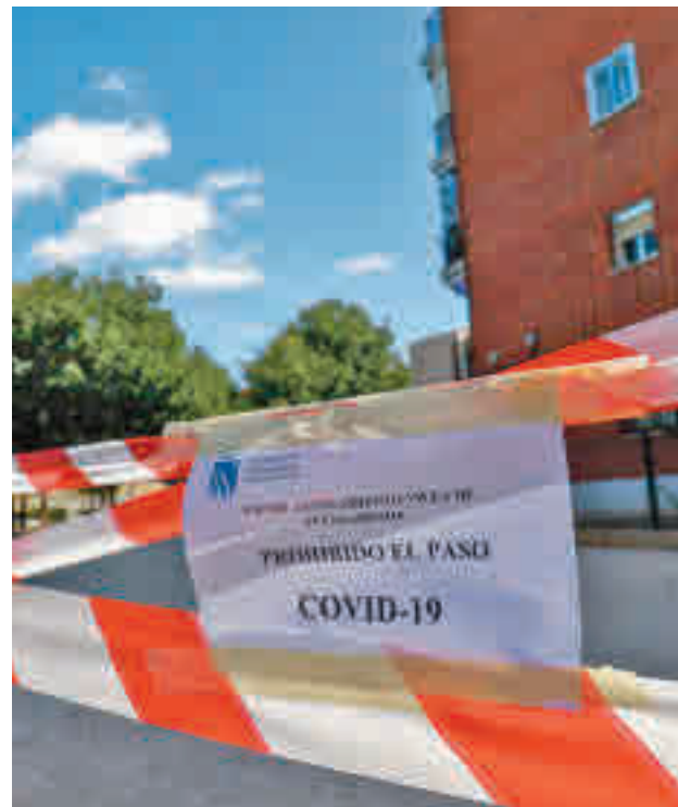
La incidencia baja en Fuenlabrada

En cuanto a las Zonas Básicas de Salud (ZBS), la Consejería de Sanidad mantiene el cierre perimetral de Cuzco, Castilla La Nueva y Alicante. La situación de la última podría cambiar en los próximos días, ya que es el área de Fuenlabrada con una menor incidencia acumulada con 140 contagios por cada 100.000