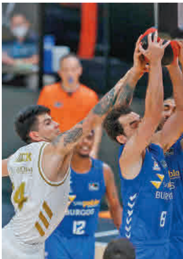
Imagen de un duelo de la pasada temporada

EL CUADRO BURGALÉS ES ACTUALMENTE CUARTO EN LA CLASIFICACIÓN