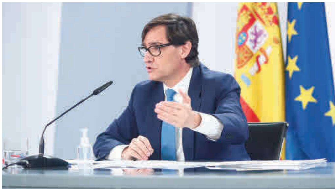
El ministro de Sanidad, Salvador Illa, anunció este miércoles las medidas para la Navidad