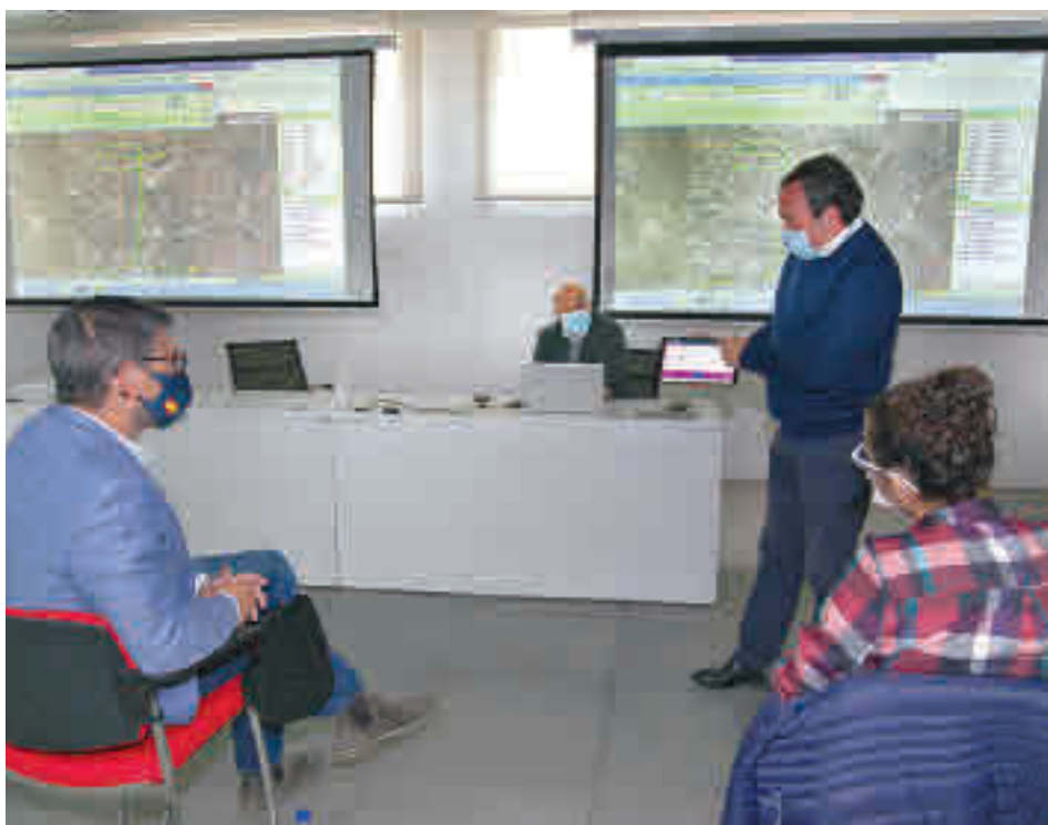
El alcalde y la edil de Medio Ambiente conocieron las mejoras