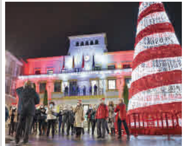
Así luce la plaza donde está el Ayuntamiento