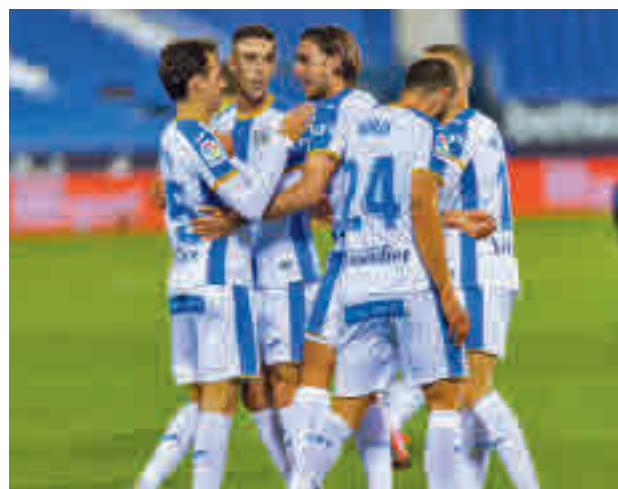
El 'Lega' atraviesa una buena racha

Mucho menos tendrá que esperar el Rayo Vallecano para disputar su encuentro. Los franjirrojos abren la jornada recibiendo este sábado 5 (14 horas) a la UD Logroñés, un recién ascendido que tratará de dar la sorpresa en Vallecas. Los de Iraola siguen en