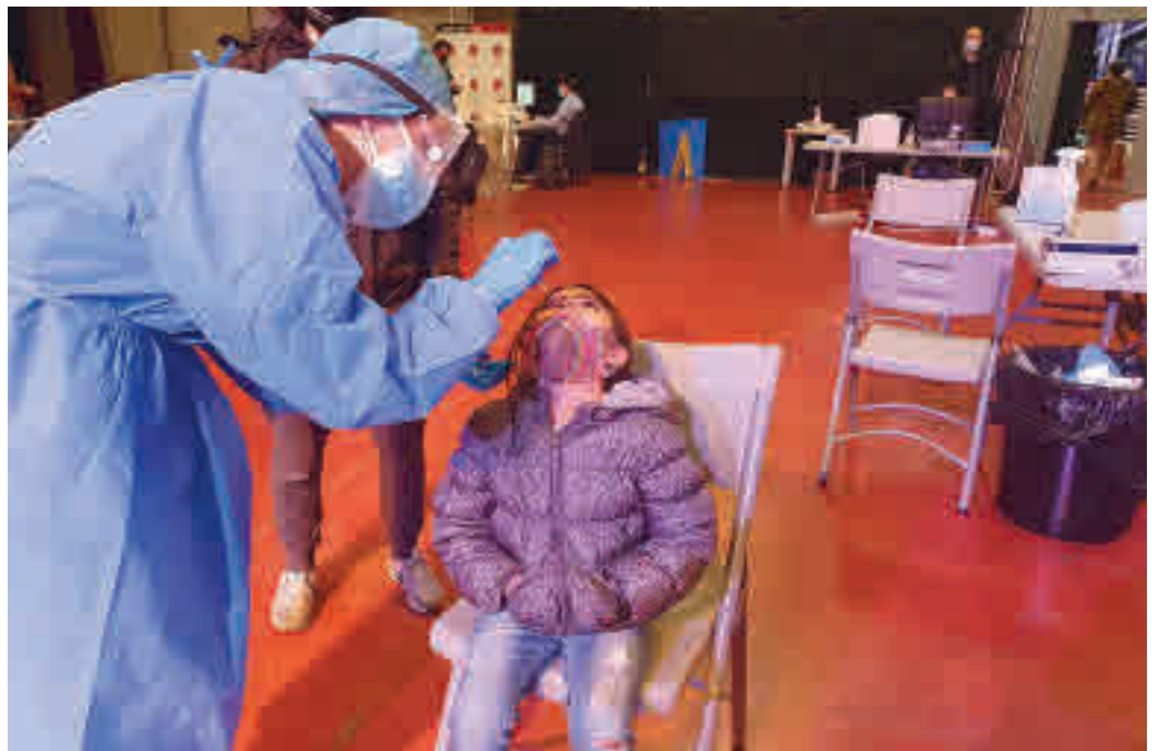
Los test de antígenos ya son una realidad en La Moraleja y Chopera

En este sentido, V Centenario ha dejado atrás unos días de descensos en sus positivos para dispararse hasta los 336 casos por cada 100.000 habitantes, cuando la semana precedente solo tenía registrados 221. Por tanto, este área