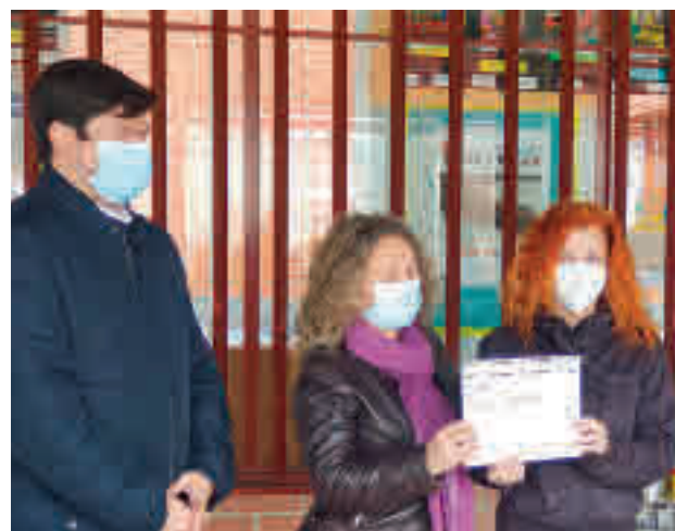
Entrega de uno de los diplomas

por la pandemia del coronavirus”, ha anunciado el Consistorio. De este modo, ambos centros se hacen con sendos premios valorados en 5.000 euros cada uno. En el caso del V Centenario, ha sido acreedor por el proyecto ‘Sharing time, connecting learnings: Sanse en Europa’, mientras que el Joan Miró fue premiado por ‘Talking science/monólogos científicos’.