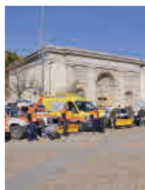
Presentación de la campaña

El dispositivo consta de 160 efectivos entre Policía Local, Protección Civil, Emergencias y servicios municipi-