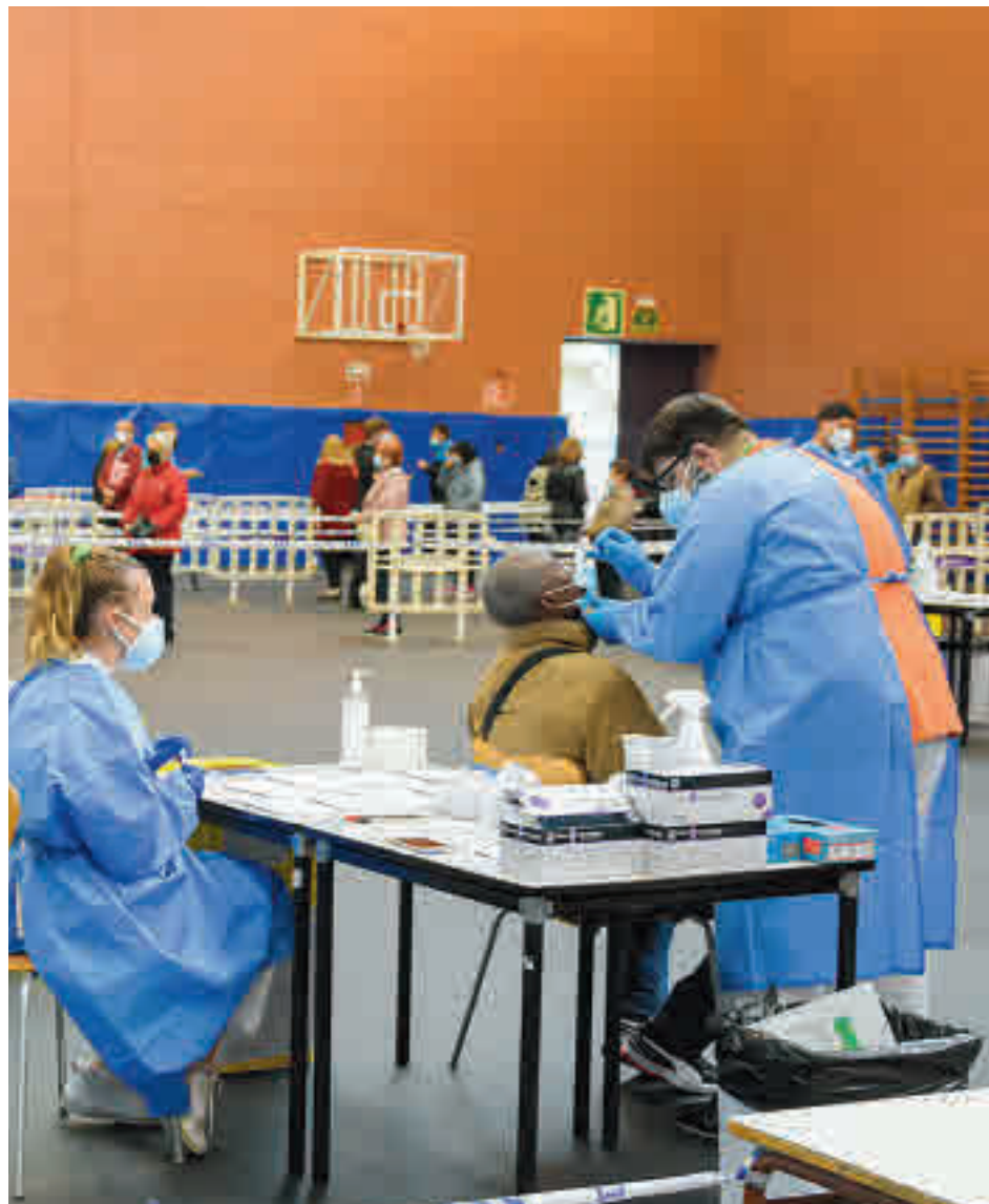
Test de antígenos en Torrejón de Ardoz

semanas de relativa calma. Unos claros ejemplos de esa buena labor en las áreas del Corredor del Henares son las ZBS de Brújula, Las Fronteras, Doctor Tamames y Barrio del Puerto. Las dos primeras, pertenecientes a la localidad de Torrejón, salen bien paradas del último informe epidemiológico de la Consejería de Sanidad. Así, a 1 de diciembre, Las Fronteras tenía una tasa