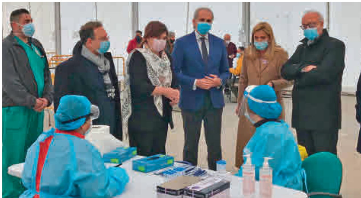
Pruebas de antígenos en Collado Villalba

El Ayuntamiento de Majadahonda ha mejorado la seguridad en el Punto Limpio de la ciudad mediante la instalación de un nuevo vallado, una caseta de control y varias cámaras de videovigilancia. Los vecinos tendrán que mostrar el DNI para acceder a la dotación.