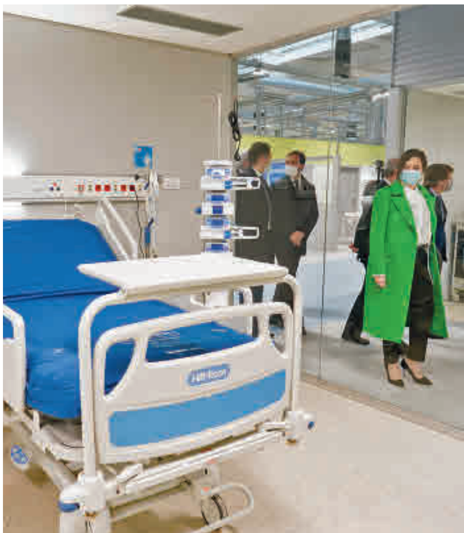
Inauguración del Hospital Enfermera Isabel Zendal