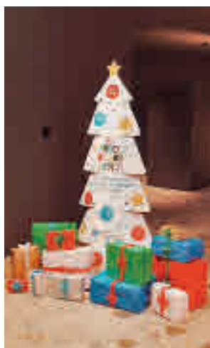
Árbol de los Sueños

Miles de personas, entre entidades colaboradoras, trabajadores sociales, voluntarios, empleados y clientes de la entidad financiera, participarán en hacer posibles los deseos de los pequeños de las familias que peor lo están