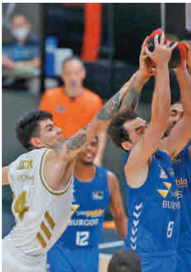
Imagen de un duelo de la pasada temporada

EL CUADRO BURGALÉS ES ACTUALMENTE CUARTO EN LA CLASIFICACIÓN