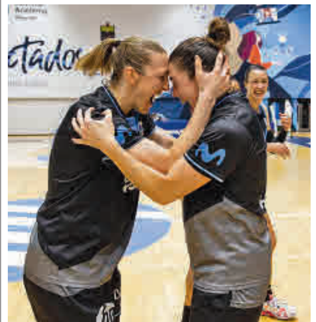
El cuadro colegial atraviesa un buen momento

La undécima jornada de la máxima categoría nacional femenina de voleibol depara un interesante partido entre el Madrid Chamberí y el segundo de la tabla, el Avarca Menorca, este sábado (19 horas).