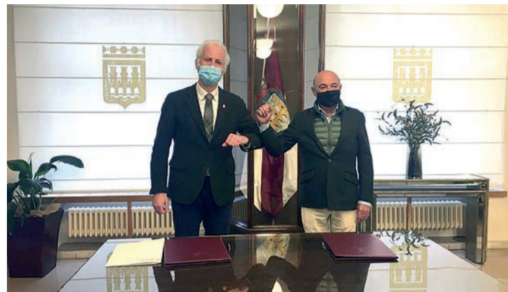
Firma del convenio de colaboración entre el Ayuntamiento y la FER el miércoles 2.

ble, la digitalización, la potenciación e incentivación del comercio local y el turismo o la organización de eventos en la ciudad, principalmente relacionados con la nueva economía y la sostenibilidad.