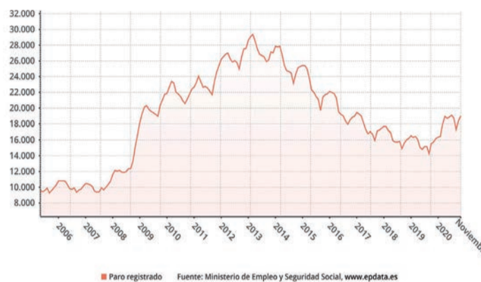
Evolución del paro en La Rioja desde el año 2006

definida que "muestra el segundo mejor dato desde 2008 con un incremento de 2,31 puntos respecto al año anterior".