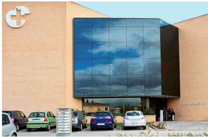
El concierto con la clínica Viamed-Los Manzanos se prorroga hasta mayo.

La recuperación se hará progresivamente a través de dos vías: la reinternalización directa de los servicios sanitarios en el Servicio Riojano de Salud, tal y como ha sucedido con las TAVI (prótesis valvular aórtica percutáneas) y los accidentes de tráfico, y mediante convenios institucionales con