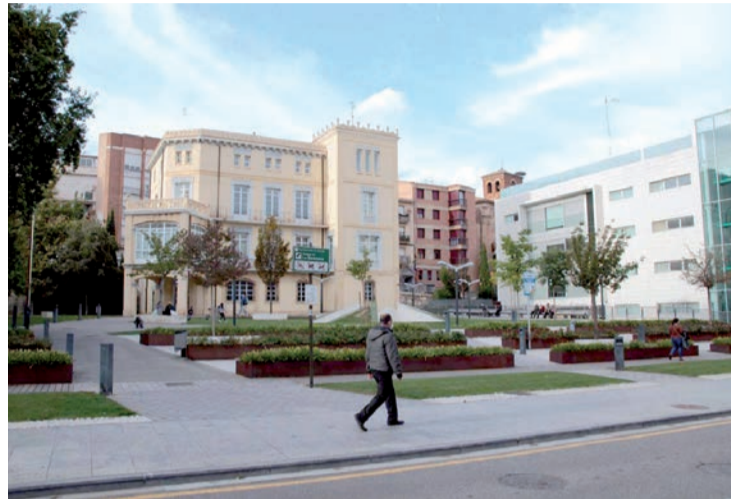
El confinamiento perimetral de Arnedo se mantendrá de nuevo una semana más.

Por último, destacó la importancia de utilizar herramientas que ayuden a cortar las cadenas de contagio como 'COVID QR', cuyo