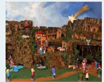
Belén con figuras de los años 40.

ción mariana aparecida en Tenerife (Islas Canarias) a principios del siglo X. Tiene lugar el 2 de febrero, y en algunos lugares (Canarias, Campillos, Palencia...), se extiende durante varios días, generalmente por ser la patrona del lugar. La Asociación de Belenistas, que todos los años monta una impresionante exposición de belenes en la Esdir, los pone y quita como yo. El Belén Monumental de la Plaza del Ayuntamiento también, aunque lo más probable es que lo hacen por problemas de infraestructura, vamos, igual que yo.