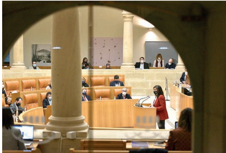
La presidenta, durante su comparecencia en la Cámara para hablar sobre la pandemia.

Durante su comparecencia, la responsable del Ejecutivo no desarrolló las medidas específicas que