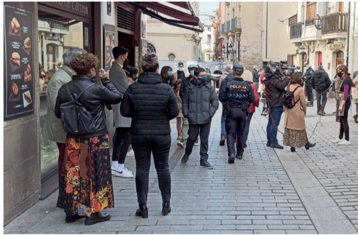
Policía Local, público y televisiones nacionales en la zona de la Laurel el domingo 29.

Desde la asociación de hosteleros de la zona subrayaron que entienden "que es necesario extremar las medidas de seguridad dada la actual crisis sanitaria, pe-