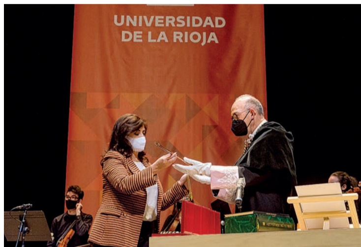
Andreu entrega el bastón de mando al nuevo rector de la UR en su toma de posesión.

El nuevo responsable de la UR señaló como una de las premisas de su mandato "el diálogo real, directo y sincero con toda la comunidad universitaria y la sociedad riojana" y anunció la creación de un Consejo Asesor, formado