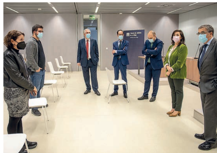
Visita de las autoridades a las últimas reformas realizadas en el Palacio de Justicia.