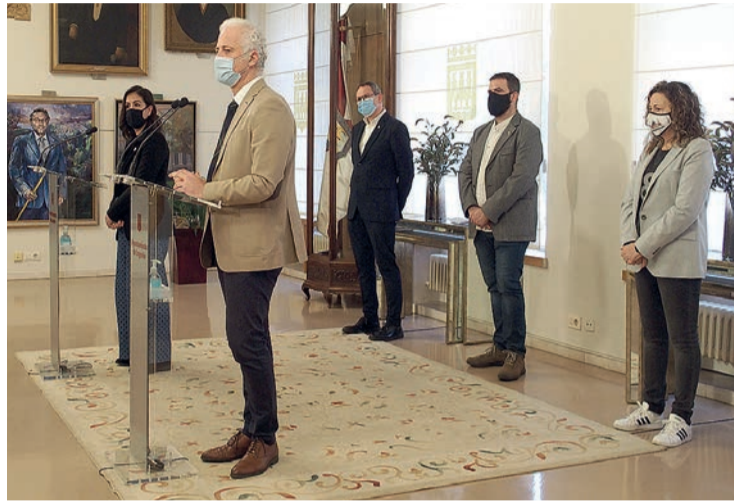
El alcalde explicó las cuentas definitivas arropado por ediles del PSOE, UP y PR+.