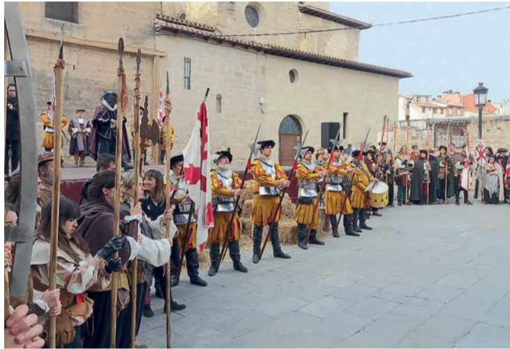
Logroño conmemorará a partir del próximo año el V Centenario del Sitio de 1521.

Estos 500 años son el pistoletazo de salida a más hitos para la ciudad