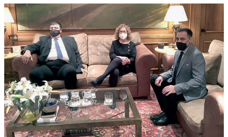
El CERMI La Rioja mantuvo un encuentro con el presidente del Parlamento.