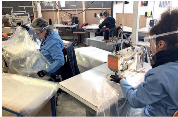
El Plan de Rescate incluye ayudas directas a empresas y autónomos.

El responsable de la ADER resaltó que este esfuerzo presupuestario se ha traducido en "un enorme trabajo de gestión" que ha obliga-