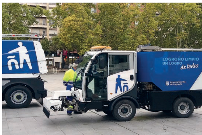
Desde el martes 1 se han ampliado los distritos de limpieza y la recogida selectiva.