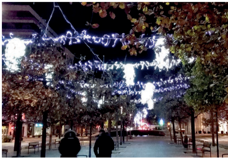
Iluminación en la plaza salón de la Gran Vía las pasadas Navidades.

Las composiciones luminosas que se conectarán este viernes 4 de diciembre iluminarán las fachadas del Ayuntamiento, gracias a una es-