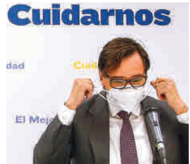
El ministro de Sanidad, Salvador Illa

"Por eso ahora pedimos extremar las medidas de precaución y también al valor de la solidaridad: lo que hacemos afecta al resto de ciudadanos", recordó Illa, que insistió en que hay que reducir mucho más las cifras de contagiados.