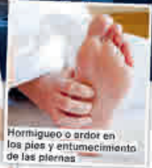
Hormigueo o ardor en los pies y entumecimiento de las piernas

¿Pregunte a su farmacia de confianza por el nuevo complejo Mavosten Forte!