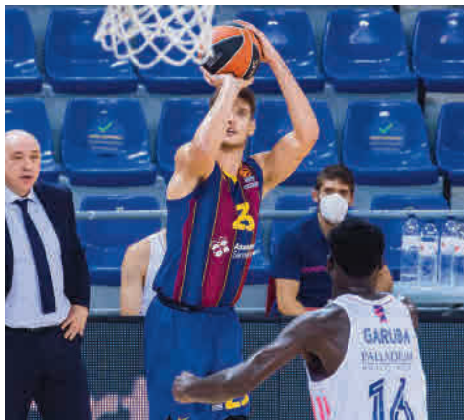
El 'Clásico' marcará la actividad navideña en la Liga Endesa

Por lo general, la Liga Endesa suele regirse por unos parámetros diferentes a LaLiga. Aprovechando el vacío que