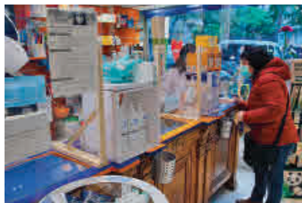
Farmacia de la Comunidad de Madrid

cribados masivos en poblaciones de una alta incidencia acumulada, contando, además, con esta red de farmacias", señaló el vicepresidente regional, Ignacio Aguado, que participó en el encuentro junto a la secretaria de Estado de Sani-