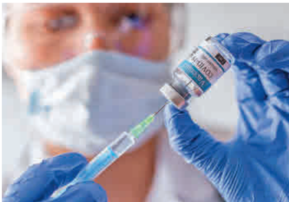
La vacuna de Pfizer llegará antes de lo previsto

"A este paso, tal y como se están desarrollando las cosas, me temo que nos vamos a quedar sin vacuna incluso