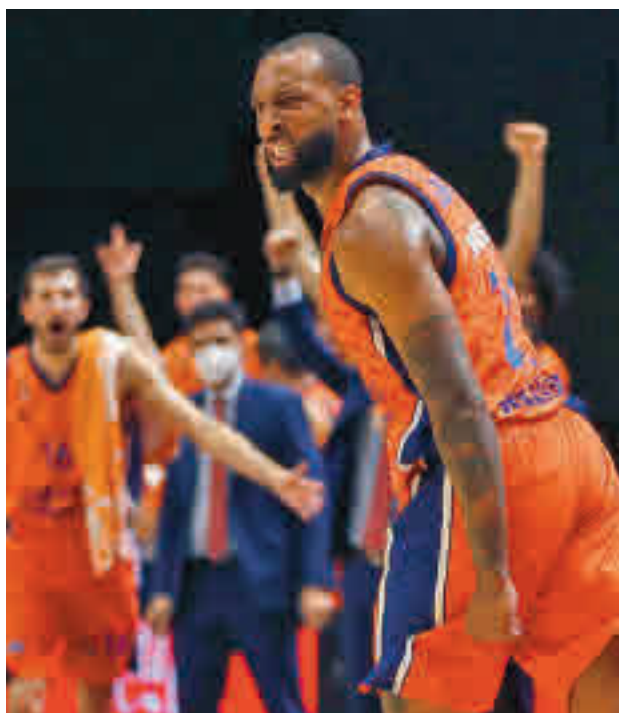
La Euroliga despidió el año con varias jornadas