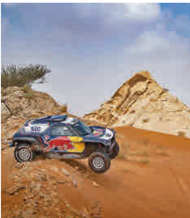
Carlos Sainz defiende título en el Dakar