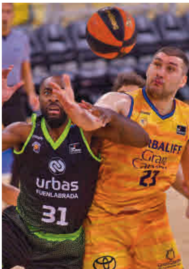
El Urbas cayó en la pista del Herbalife Gran Canaria

Con este panorama, el cuadro fuenlabreño afronta la recta fi-