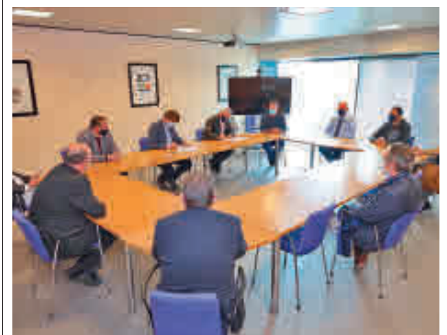
Firma del acuerdo

En cuanto a las Zonas Básicas de Salud (ZBS) en las que se divide la localidad, todas ellas están todavía lejos de los 400 casos que marca la Consejería de Sanidad para llevar a cabo restricciones como el cierre perimetral. La situación más preocupante es la de Francia (294), seguida muy de cerca por Parque Loranca (292). En el extremo opuesto están las áreas de Castilla la Nueva (201), Alicante (204) y Cuzco (208).