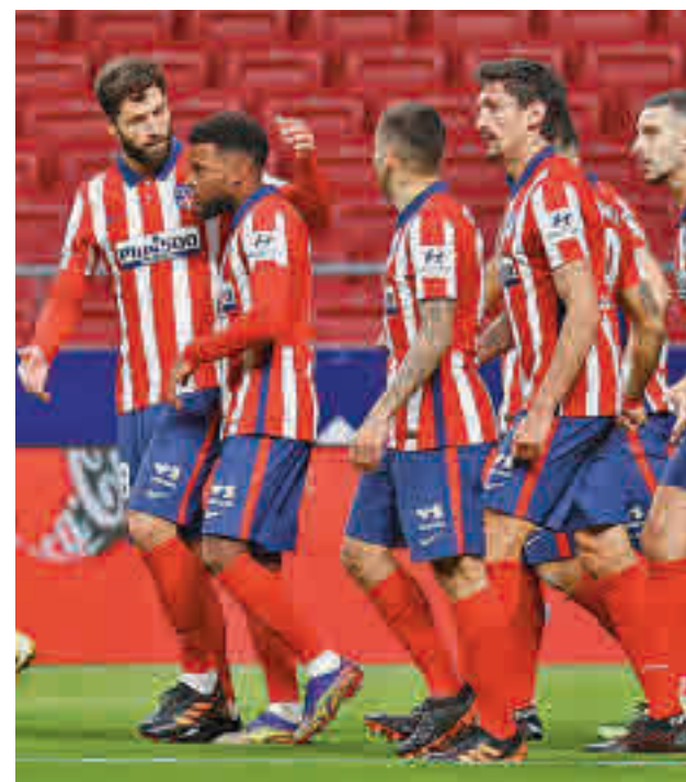
En LaLiga habrá menos vacaciones de lo habitual