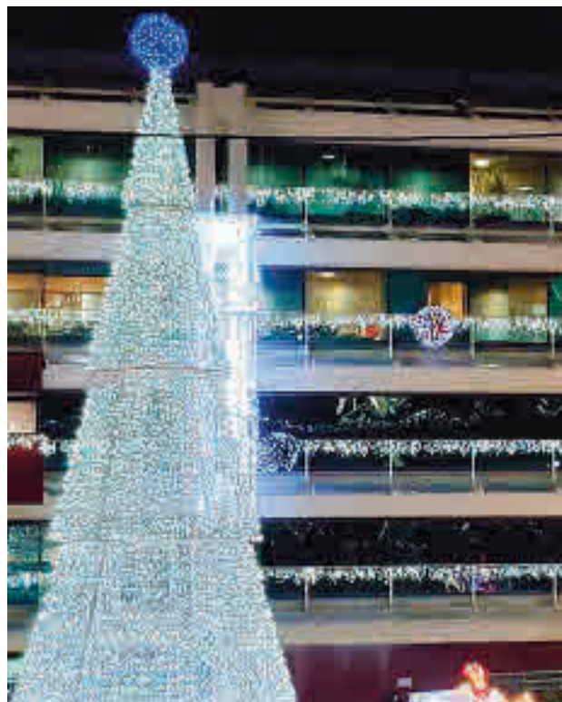
Fuenlabrada ya vive su Navidad

Algunas de las iniciativas, como los mercados de la plaza de la Constitución y de la calle de la Plaza, ya comenzaron el pasado 4 de diciembre, pero el grueso de las actividades se concentran alrededor de las fechas más señaladas. Desde este sábado 19 hasta el jueves 31 de diciem-