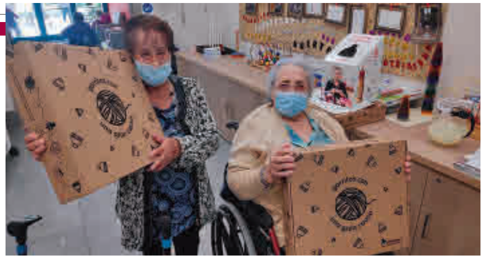
La campaña recaudó en 2019 en España 14.000 euros

que llegué y me senté, todo se pasó". "Después, me puse a tejer como una más, disfrutando de lo que hacía. La experiencia fue muy agradable", recuerda.