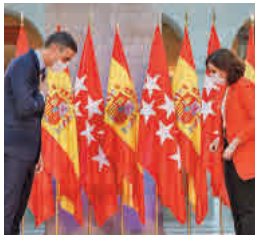
Sánchez y Ayuso tras una reunión en septiembre

EL PERIÓDICO GENTE NO SE RESPONSABILIZA NI SE IDENTIFICA CON LAS OPINIONES QUE SUS LECTORES Y COLABORADORES EXPONGAN EN SUS CARTAS Y ARTÍCULOS