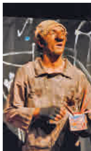
Escena de 'Papyrus'

El centro cultural también acogerá el ciclo de proyecciones 'Pequeños cinéfilos', con una retrospectiva dedicada al maestro de la animación japonesa Hayao Miyazaki, cofundador del célebre Estudio Ghibli. Los más pequeños de casa podrán descubrir