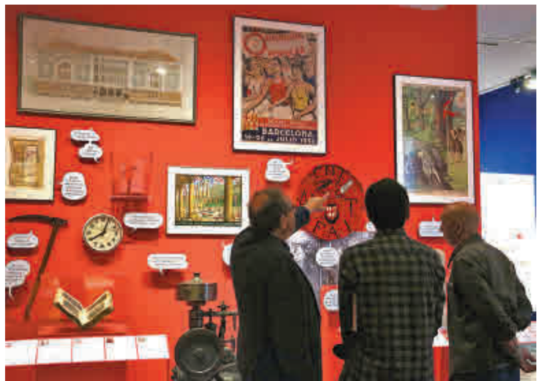
Moltes de les instal·lacions ja permeten la visita individual dels espais i les exposicions.

familiar japonès gràcies a l'activitat 'Fukuwarai, riguem i atrapem la felicitat'. I abans, el 20 de desembre, s'hi ensenyarà 'Estels i garlandes amb fibres vegetals' i, el 27 de desembre, boles de guarnir en l'activitat 'Feltre en família'.