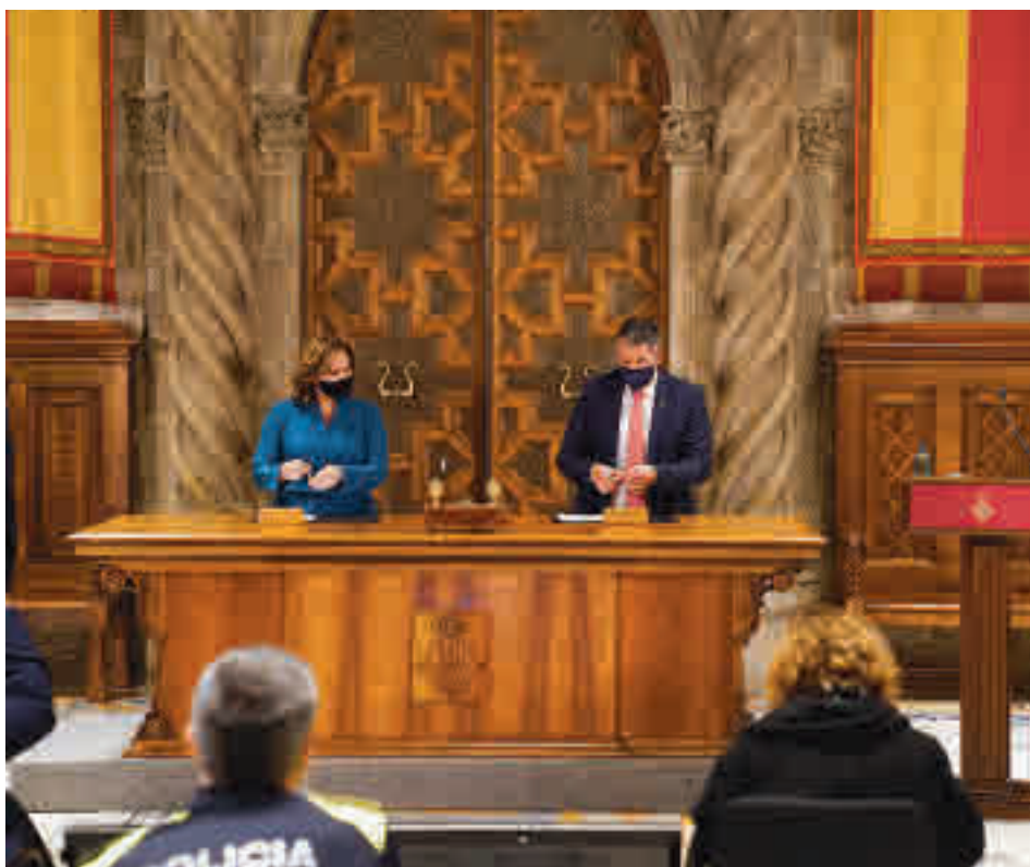
L'alcaldessa de Barcelona, Ada Colau, i el conseller d'Interior, Miquel Sàmpel. ACN