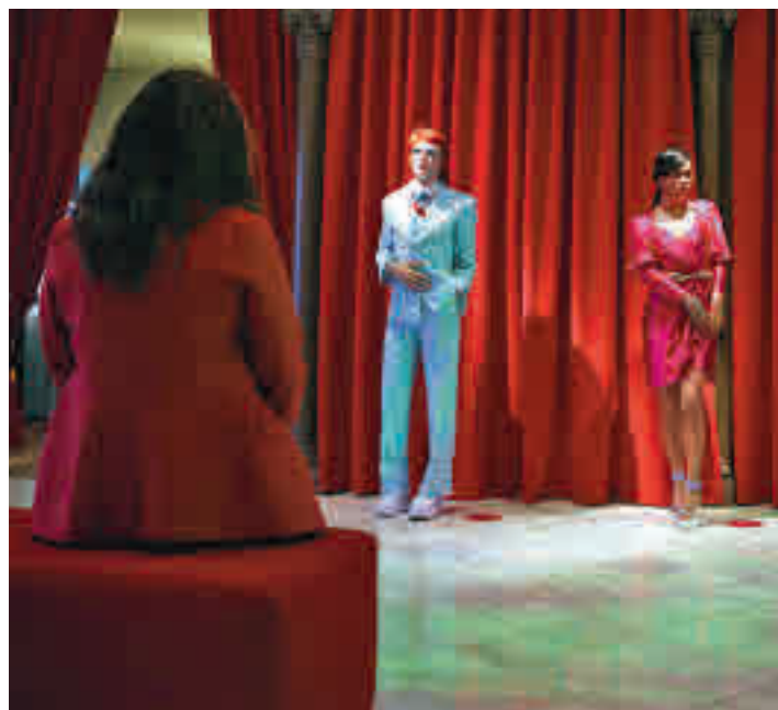
MÚSICS, REIVINDICADORS I ESPORTISTES: La cantant catalana Rosalía, David Bowie, Rihanna i Adele són altres de les noves figures del renovat Museu de Cera, que ha apostat per personatges que copen l'actualitat com Greta Thunberg o Pau Gasol.

E l Museu de Cera reobre les seves portes després d'una renovació integral dels personatges i una actualització tecnològica. Els germans Roca, Rosalía, Messi i Pau Gasol, Floquet de Neu, Greta Thunberg, Adele, Frida Khalo i Harry Potter, són només alguns exemples de l'intent d'actualització del museu. La renovació ha durat al voltant d'un any, després que els antics gestors es van vendre l'explotació de l'espai, entre altres raons, per la cai-