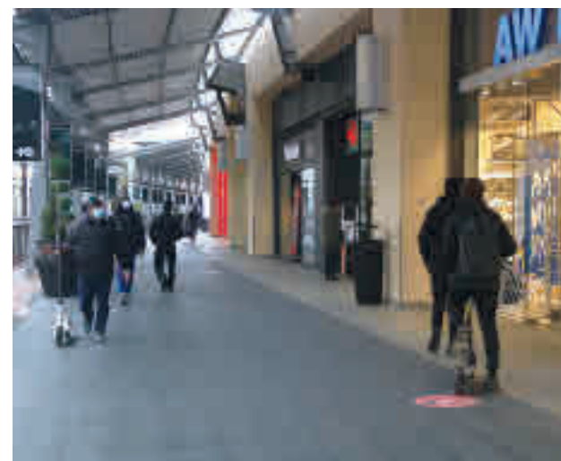
Han estat gairebé un mes tancats.

També es plantejarà al govern de l'Estat que inclogui la Sala Conjunta de Coordinació i Emergències de Barcelona, situat al número 28 del carrer Lleida, com a infraestructures crítiques. També es millorarà la comunicació entre els diferents cossos per agilitzar les accions, segons exposa el consistori en un comunicat.