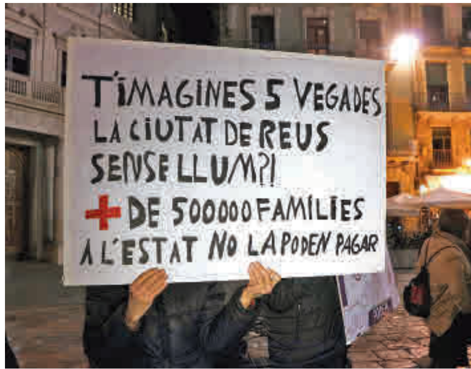
El mes d'agost va ser la quarta factura de llum més cara de la història, segons FACUA.

Concretament, l'associat a la retribució de les renovables. Si fins ara aquest cost l'abonaven els consumidors, amb aquest mecanisme seran les empreses energètiques les que ho cobreixin