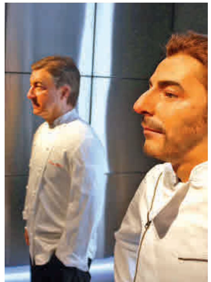
NOVES FIGURES I VELLES FIGURES RESTAURADES: Leo Messi, l'exjugador del Barça Samitier i sobre aquestes línies els germans Roca, una de les noves incorporacions del museu. El centre ha organitzat el seu recorregut segons àrees temàtiques.