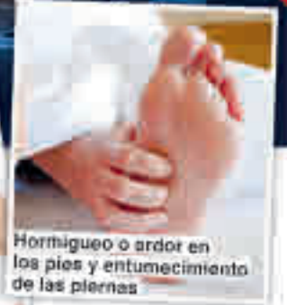
Hormigueo o ardor en los pies y entumecimiento de las piernas

¿Pregunte a su farmacia de confianza por el nuevo complejo Mavosten Forte!