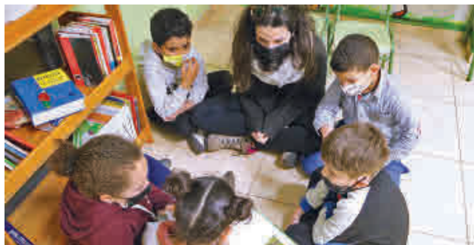
Els alumnes romandran tres dies més a casa.

L'últim dia lectiu abans de les vacances de Nadal es manté: serà el dilluns 21.