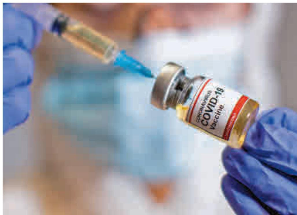
Les infermeres aniran a les residències geriàtriques en la primera fase.

LES INFERMERES HAURAN DE FER UNA BREU FORMACIÓ PER A VACUNAR