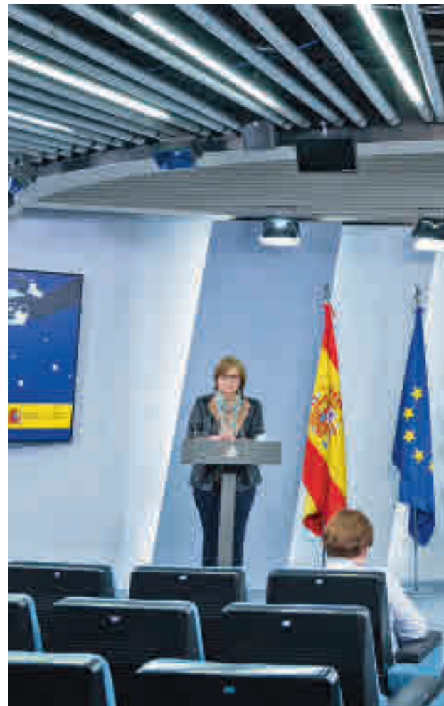
La directora d'epidemiologia de l'Institut de Salut Carles III.

Al conjunt de l'estat, el percentatge se situa en el 9,9%, és a dir, pràcticament 1 de cada 10. Aquesta xifra suposaria que 4,7 milions de persones haurien passat la Covid, una xifra que gairebé triplicaria la que dona el ministeri: 1.751.884 casos. La tercera