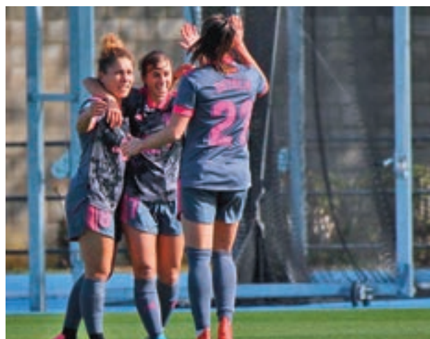
El Madrid CFF está firmando una gran temporada

y aspira a clasificarse para la Liga de Campeones, un objetivo al que se acercan tanto el Atlético de Madrid como el Madrid CFF. Este último protagonizará un derbi con el Rayo Vallecano, mientras que las rojiblancas actuarán como locales ante la Sociedad Deportiva Eibar.