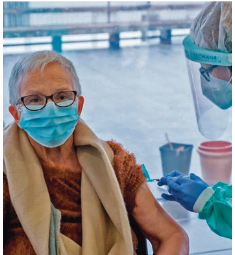
La Comunidad no pondrá más primeras dosis hasta el 8 de febrero

Estaba previsto que la Agencia Europea del Medicamento diera el visto bueno a esta vacuna este viernes 29 y que en los próximos días empezaran a llegar las primeras dosis.