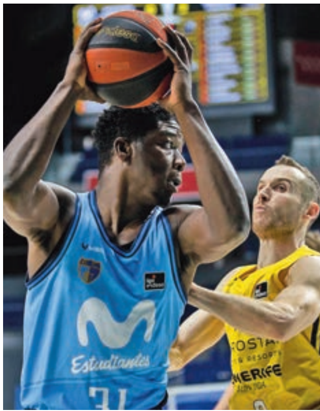
El equipo colegial quiere acercarse a la permanencia

Una agenda similar tendrá un Real Madrid que este vier-