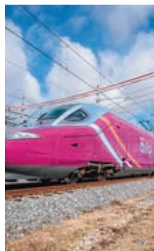
El nuevo tren Avlo

entre junio y diciembre entre Madrid y Barcelona. La compañía ya utilizó esta promoción el año pasado, momento en el que debía haberse estrenado el Avlo, algo que se tuvo que posponer por la pandemia. A diferencia de