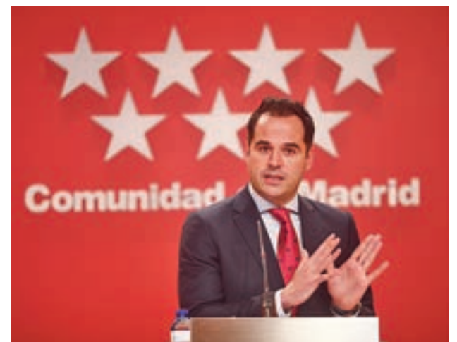
No habrá nuevas restricciones en la región

Entre la última batería de medidas que entraron en vigor este lunes 25 destaca el toque de queda a las 22 horas, el cierre de la hostelería y el comercio a las 21 horas o la prohibición de reunirse en domicilios con personas que no son convivientes.