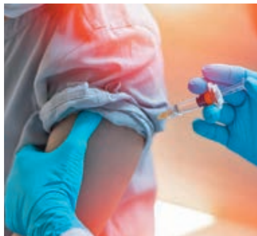
Las vacunas, en el punto de mira

EL PERIÓDICO GENTE NO SE RESPONSABILIZA NI SE IDENTIFICA CON LAS OPINIONES QUE SUS LECTORES Y COLABORADORES EXPONGAN EN SUS CARTAS Y ARTÍCULOS