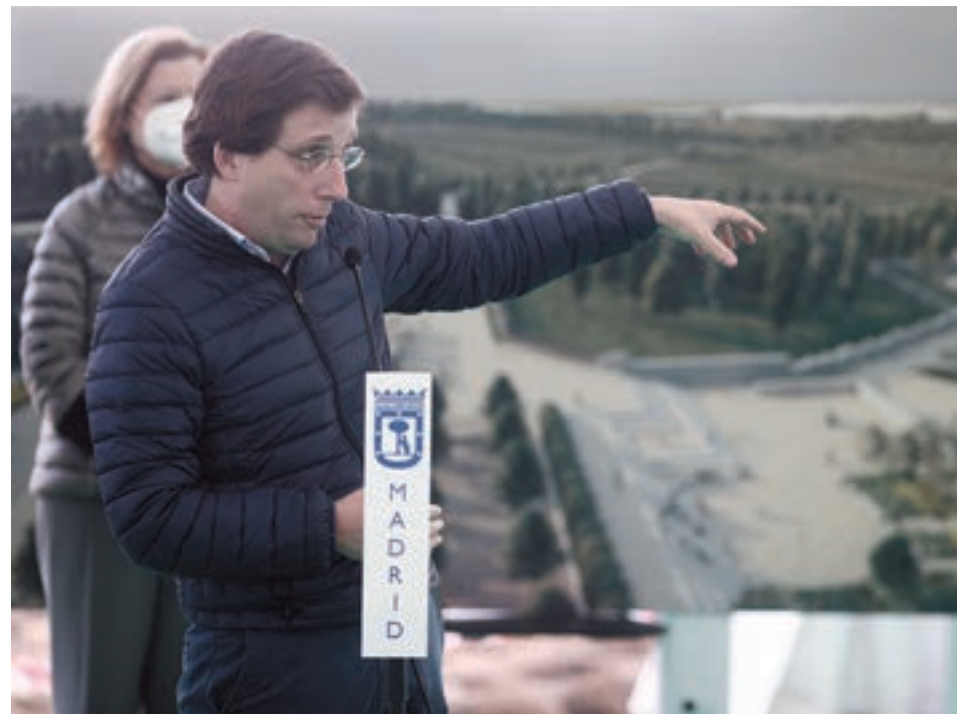
La zona de actuación donde se ha iniciado el proyecto

Precisamente el alcalde de Madrid, José Luis Martínez-Almeida, obró de maestro de ceremonias y, pala en mano, plantó el primero de los árboles de la futura zona verde.