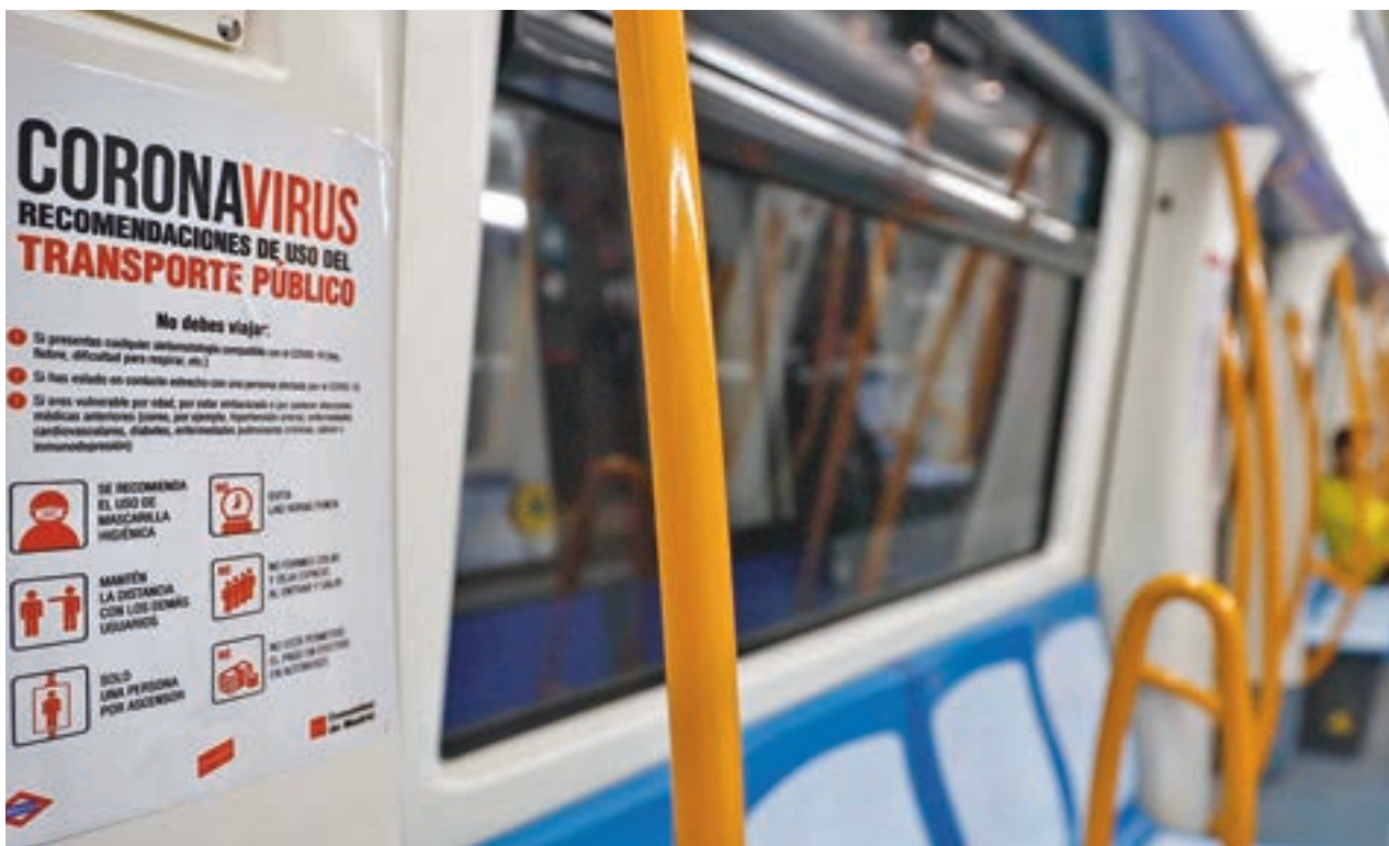
Normativa contra la Covid-19 en el Metro de Madrid