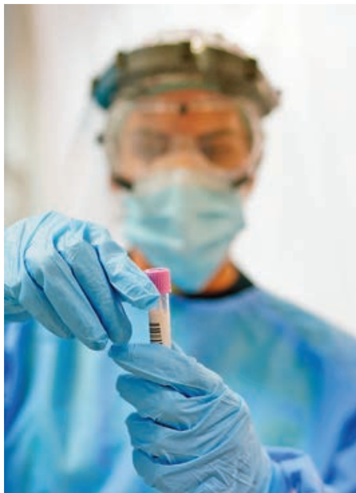
Un sanitario realiza una prueba PCR

Por su parte, Barajas que era la zona más sacudida por