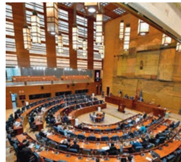
Asamblea de Madrid