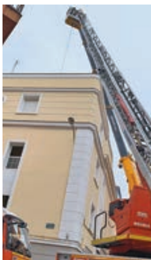
El operativo de los Bomberos