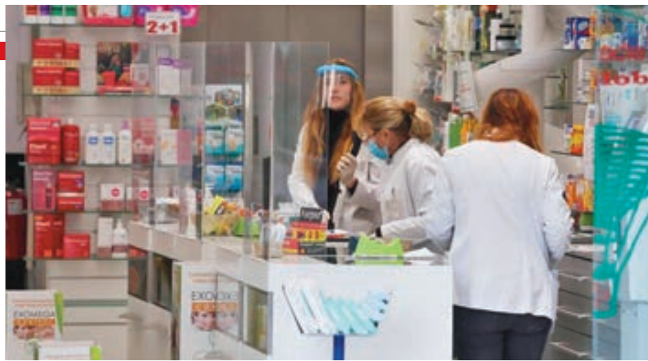
Las farmacias podrán hacer test de antígenos

Por su parte, el consejero de Sanidad, Enrique Ruiz Escudero, señaló que la participación en este programa se ofrecerá de manera voluntaria y los profesionales deberán realizar previamente en un curso formativo, impartido por sus respectivos colegios, al tiempo que ha insistido en que los test serán solo para aquellas personas asintomáticas que sean deriva-