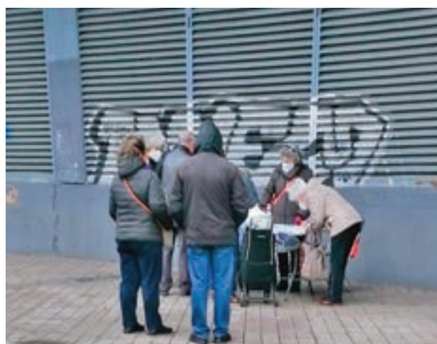
La mesa informativa del pasado 23 de enero

una campaña que contempla el reparto de más de 5.000 octavillas, así como la recogida de firmas en una mesa informativa, con el objetivo de dar a conocer e los planes del Ayuntamiento con respecto a la construcción de una zona