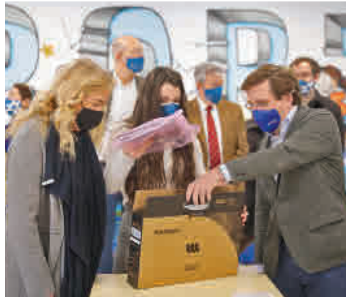
El alcalde de Madrid entrega un ordenador a una alumna

En el transcurso del acto, José Luis Martínez-Almeida, entregó a alumnos de Primaria, Secundaria y Formación Profesional dispositivos portátiles con los que podrán continuar las clases en caso de un nuevo confinamiento, tener acceso a la edu-