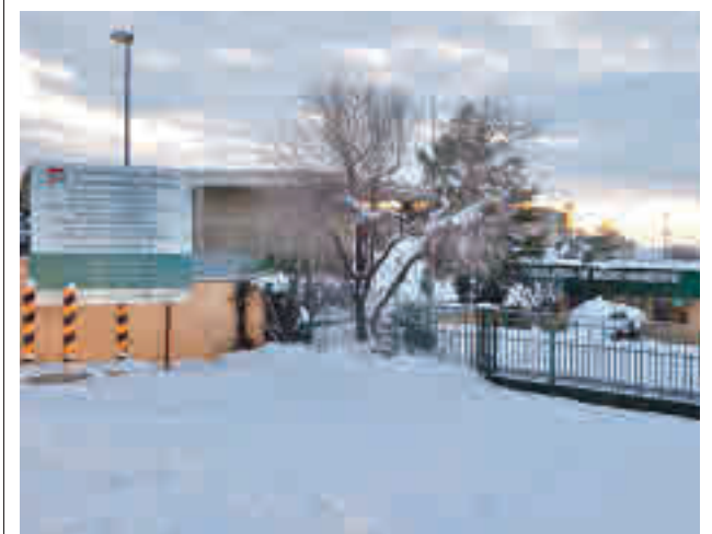
Vertedero de Pinto

Un taller mecánico situado en la calle Berlín de Parla sufrió un incendio el pasado lunes 25 de enero, sin tener que lamentar daños personales.