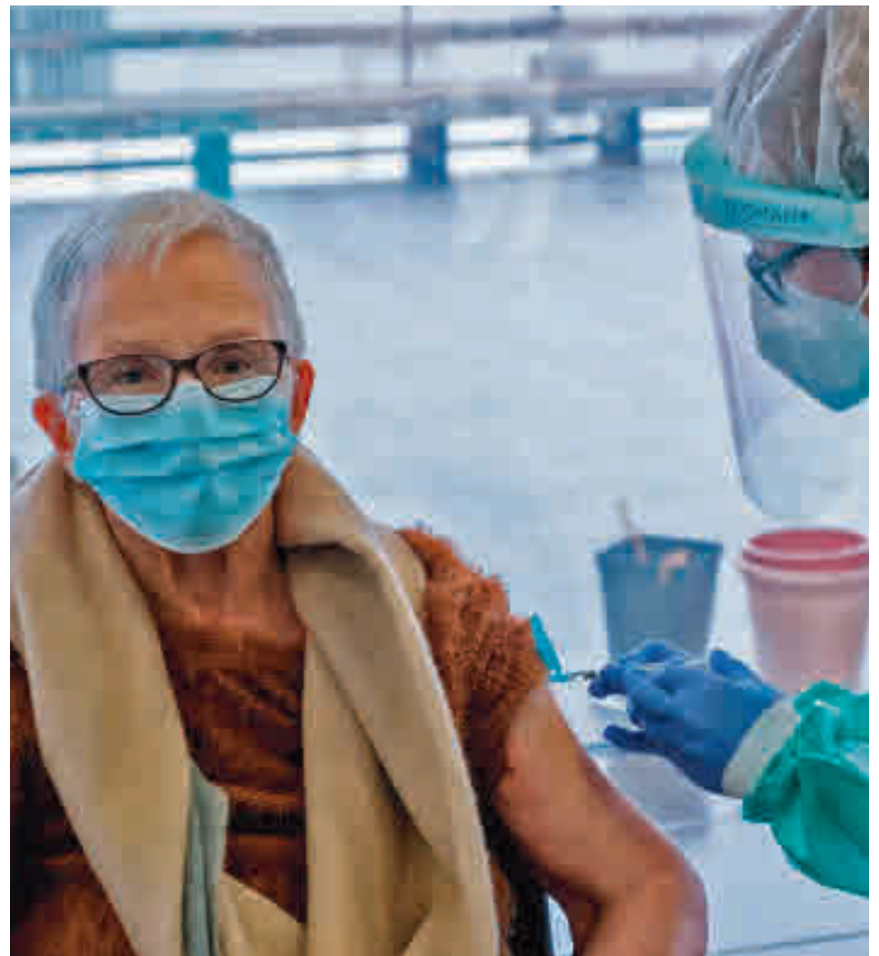
La Comunidad no pondrá más primeras dosis hasta el 8 de febrero

Estaba previsto que la Agencia Europea del Medicamento diera el visto bueno a esta vacuna este viernes 29 y que en los próximos días empezaran a llegar las primeras dosis.