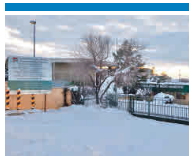
Vertedero de Pinto

Un taller mecánico situado en la calle Berlín de Parla sufrió un incendio el pasado lunes 25 de enero, sin tener que lamentar daños personales.