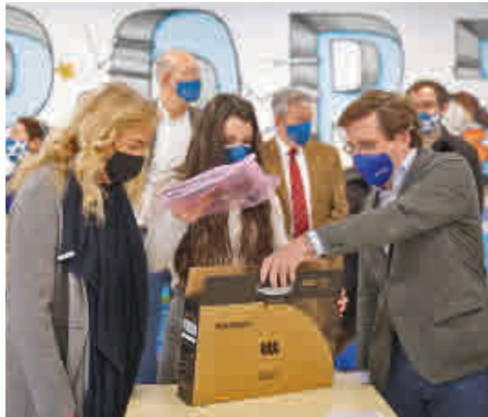
El alcalde de Madrid entrega un ordenador a una alumna

El proyecto desarrollado por Madrid Futuro pretende paliar la falta de acceso del alumnado a las clases online • Esta iniciativa llegará a centros de Latina, Carabanchel, Usera y Villaverde