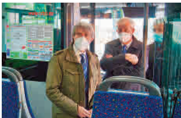
Presentación de los autobuses