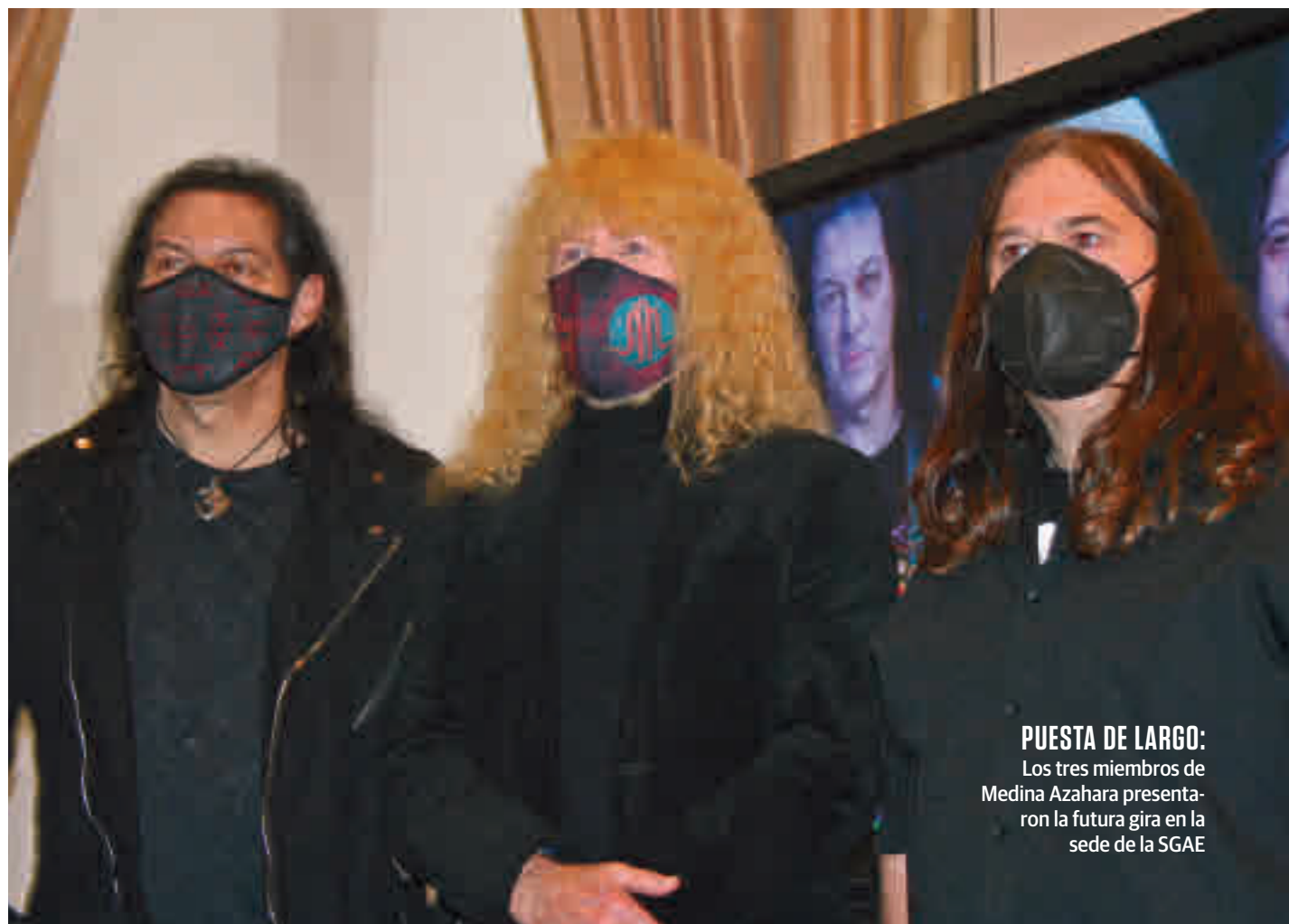
PUESTA DE LARGO: Los tres miembros de Medina Azahara presentaron la futura gira en la sede de la SGAE