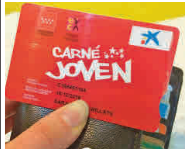
Carné Joven de la Comunidad de Madrid

Con esta aplicación, disponible en Google Play y Huawei App Gallery para teléfonos con sistema operativo Android, los usuarios pueden recargar su tarjeta de transporte con los títulos que necesiten desde su propio teléfono móvil, sin necesidad de acudir a una máquina de venta, un cajero o un punto de venta autorizado como los estancos. Su uso es muy intuitivo y en la página web del Crtm.es está disponible un vídeo explicativo.