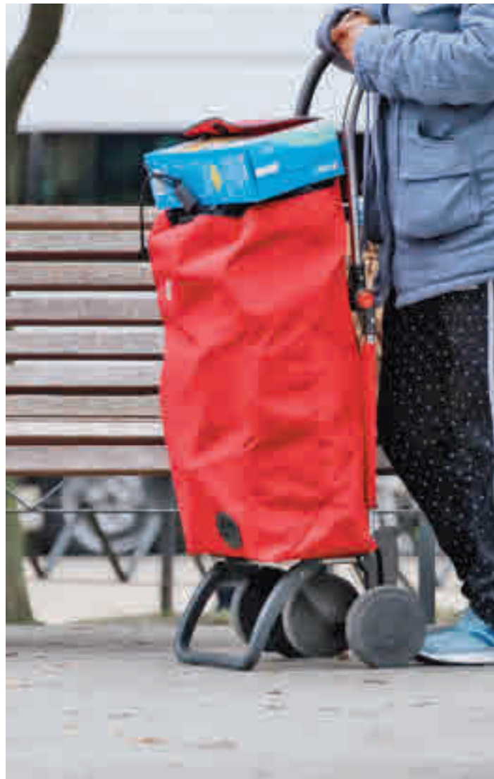
Una señora regresa con su carro del Banco de Alimentos

cos de vulnerabilidad en el distrito de Tetuán, Ciudad Lineal y San Blas". Este empobrecimiento ha sido mayor en los hogares con niños, "que dará como resultado un aumento de la pobreza infantil