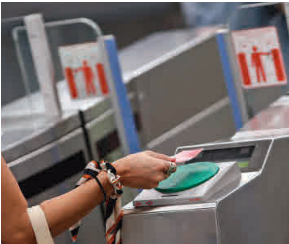
Los usuarios de la Tarjeta de Transportes solo necesitarán su móvil