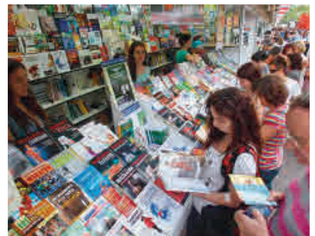
Una edición anterior de la Feria del Libro, en El Retiro

Además, se confirma la presencia de Colombia como País Invitado de Honor en esta edición. Para ello, la comisión organizadora diseñará un programa especial de este singular aniversario que reunirá a autores y autoras de diversos géneros, sin olvidar la literatura infantil y juvenil.