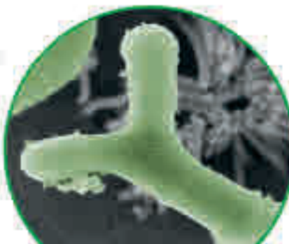
Ayuda eficaz con la bifidobacteria B. bifidum HI-MIMBb75

Efecto-Parche PRO El secreto de Kijimea Colon Irritable PRO: sus bifidobacterias especiales inactivadas térmicamente y con Efecto-Parche PRO. Las bifidobacterias se adhieren como un parche protector a las áreas dañadas de la pared intestinal. Así, esta puede recuperarse y está protegida contra nuevas irritaciones. De esta forma, pueden reducirse la diarrea, el dolor abdominal y la flatulencia.