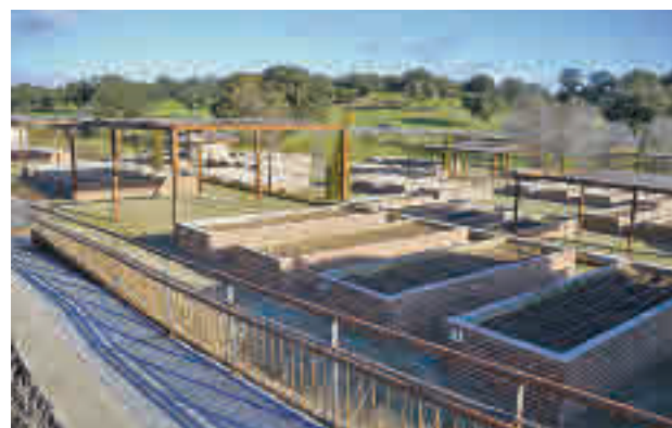
Huertos urbanos de Boadilla del Monte

Las autorizaciones no se pueden traspasar a terceras personas y estarán sujetas a las modificaciones que pueda decidir el Ayuntamiento,