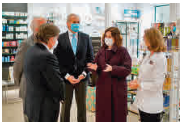
Ayuso visitó una de las farmacias

Hasta el momento se han adherido 142 farmacias y 60 clínicas dentales. Ambos tipos de establecimientos sanitarios definirán los horarios o circuitos para la realización de las pruebas, de modo que en todo momento se respetarán las