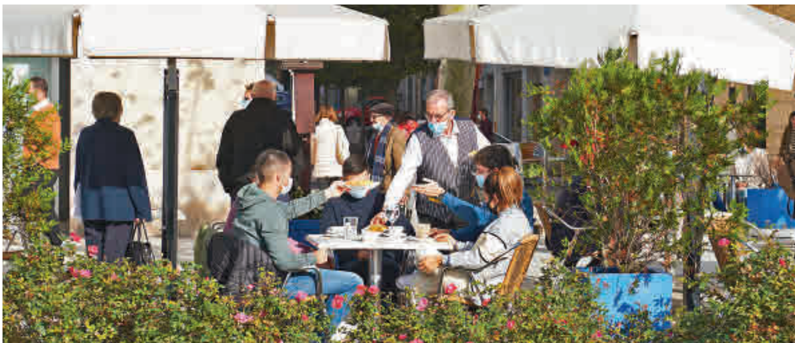
Las terrazas de los establecimientos de hostelería volverán a tener seis mesas por cliente