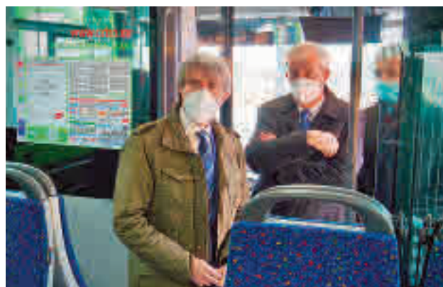
Presentación de los autobuses