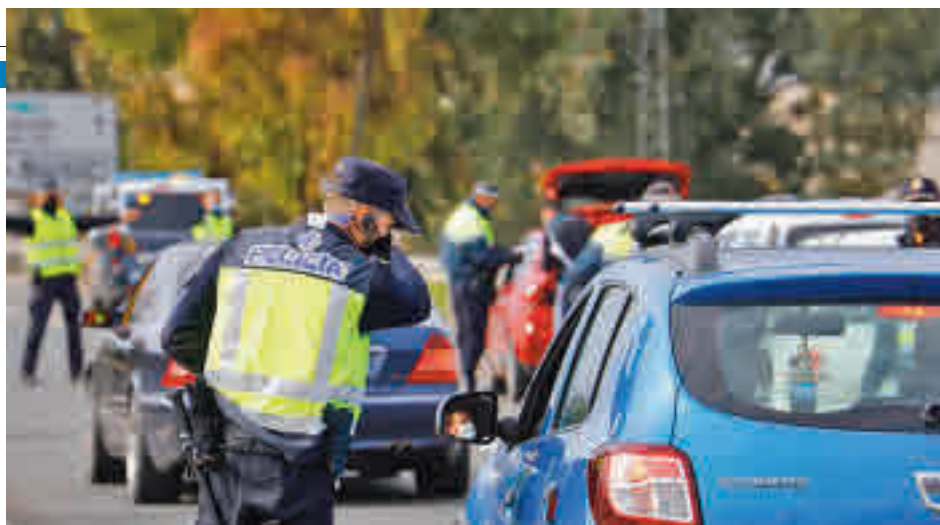
Las restricciones a la movilidad afectan a las localidades de Rivas, Alcalá y Coslada al completo

Dos de sus ZBS confinadas vuelven a registrar cifras preocupantes ● Coslada y Alcalá están cerradas al completo