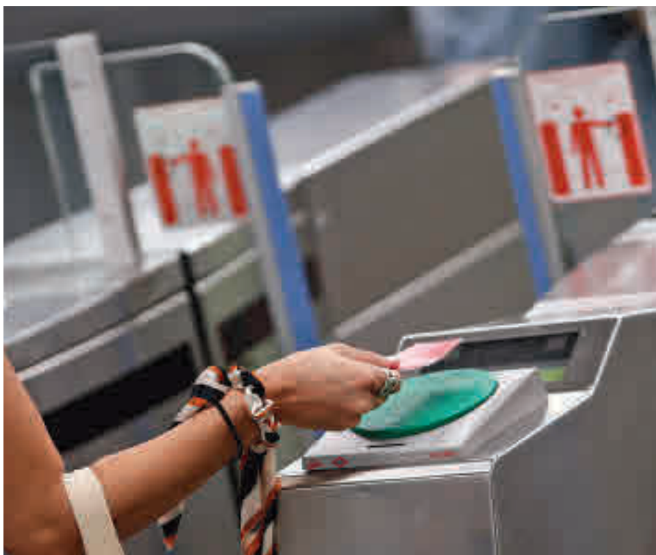
Los usuarios de la Tarjeta de Transportes solo necesitarán su móvil