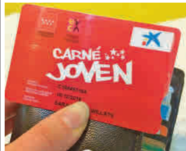
Carné Joven de la Comunidad de Madrid

Con esta aplicación, disponible en Google Play y Huawei App Gallery para teléfonos con sistema operativo Android, los usuarios pueden recargar su tarjeta de transporte con los títulos que necesitan desde su propio teléfono móvil, sin necesidad de acudir a una máquina de venta, un cajero o un punto de venta autorizado como los estancos. Su uso es muy intuitivo y en la página web del Crtm.es está disponible un vídeo explicativo.