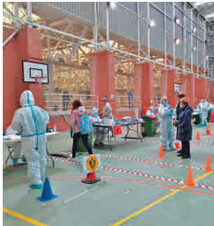
La incidencia baja en Fuenlabrada

En cuanto a las siete Zonas Básicas de Salud (ZBS) en las que se divide la localidad, todas ellas lograron rebajar sus números con respecto al informe de la semana anterior. La situación más preocupante sigue siendo la de El Naranjo, que ha pasado de 1.394 a 1.292 contagios por cada 100.000 vecinos. A continuación aparecen Francia (de 1.279 a 1.235) y Cuzco (de 1.394 a 1.190).