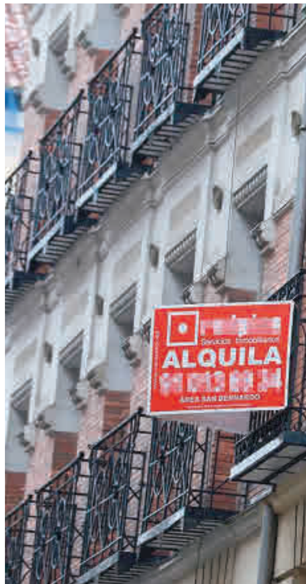
La vivienda de alquiler sigue bajando en Madrid

Es una de las cuatro únicas autonomías en las que no se incrementó en enero • Según el informe de Idealista.com, la tendencia a la baja se consolida desde el pasado mes de mayo