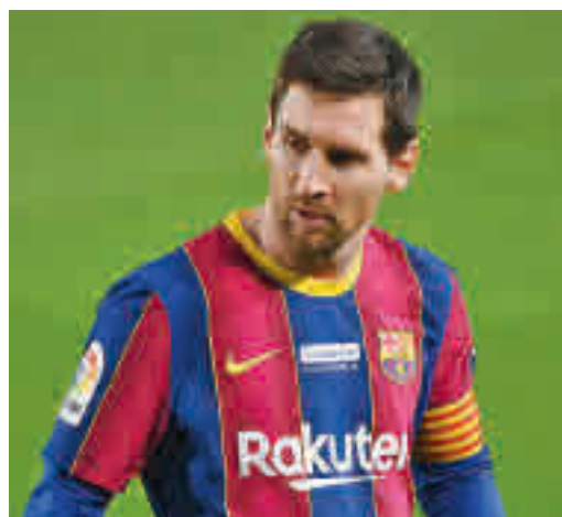
Messi, en el ojo del huracán por su salario

EL PERIÓDICO GENTE NO SE RESPONSABILIZA NI SE IDENTIFICA CON LAS OPINIONES QUE SUS LECTORES Y COLABORADORES EXPONGAN EN SUS CARTAS Y ARTÍCULOS