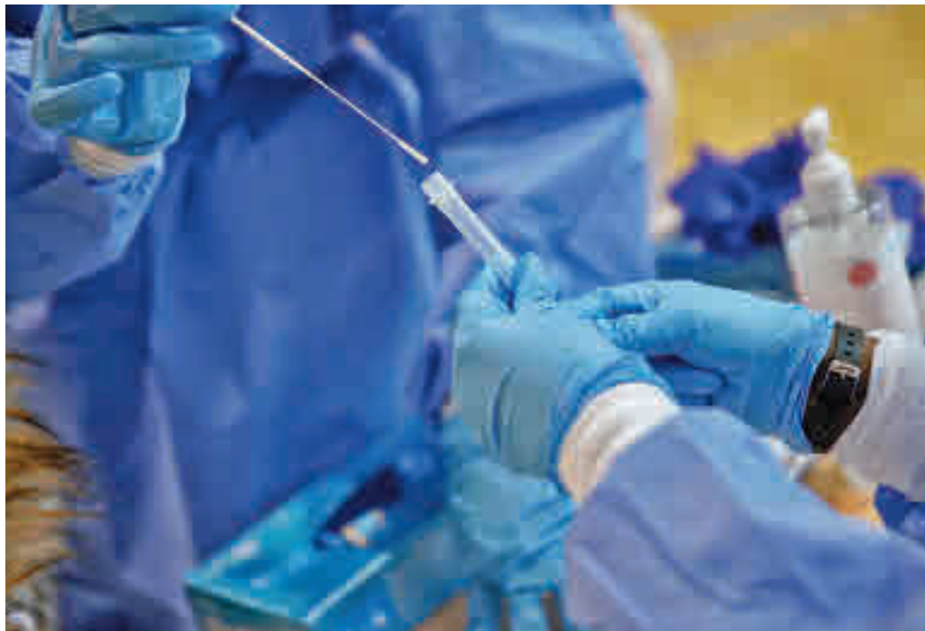
Los datos de contagios siguen siendo altos en el Noroeste

La excepción sigue estando en Collado Villalba, una localidad que, pese al cierre perimetral que sufre desde hace varias semanas, no consigue doblegar la curva ascendente y ya se ha convertido en la ciudad de la Comunidad de Madrid con una mayor tasa de contagios, registrando 1.747 casos por cada 100.000 habitantes, una cifra que hace una semana era de 1.652. Especialmente descontrolada está la situación en la Zona Básica de Salud de Sierra de