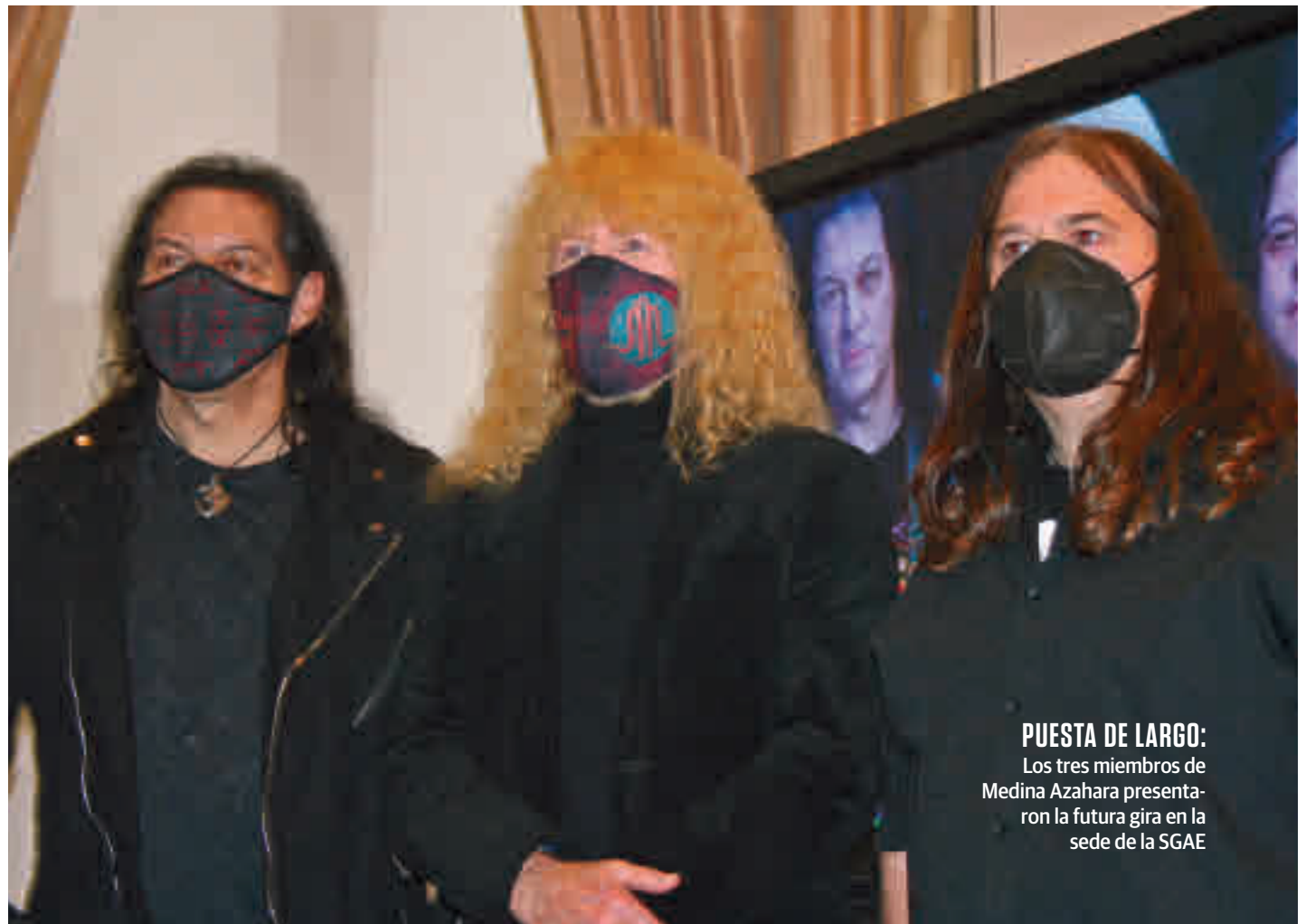
PUESTA DE LARGO: Los tres miembros de Medina Azahara presentaron la futura gira en la sede de la SGAE