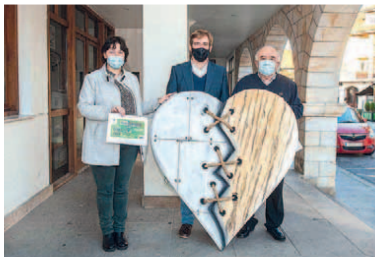
REOCÍN. Lanzamiento del Plan Re-Vive por San Valentín. Pág. 12

El proyecto, que se completará en una segunda fase con su unión con Ganzo, facilitará la descongestión del tráfico en la zona de Barreda.