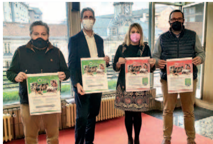
Momento de la presentación de la campaña.

En un principio, las tarjetas se podrán utilizar hasta el 31 de mayo, pero no se descarta que se pueda ampliar si continúan las restriccio-