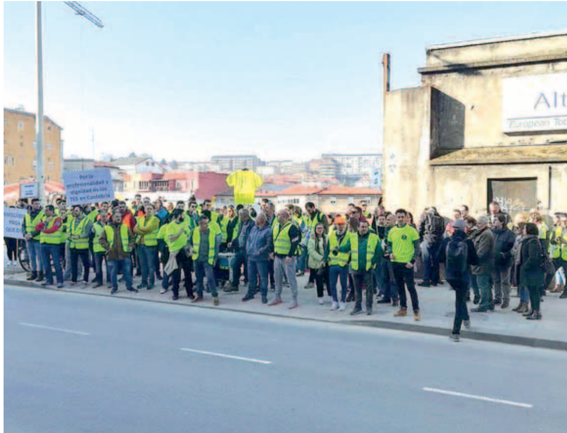
Concentración de los trabajadores de Ambuibérica ante el Parlamento de Cantabria.

Por ello, y a fin de “garantizar los derechos de los trabajadores y los usuarios” ante las “graves vulneraciones en la prestación del servicio”, el coordinador general de IU en Cantabria instaba al consejero de Sanidad, Miguel Rodríguez, a “valorar la resolución del contrato con Ambuibérica” a través de la fórmula jurídica oportuna que ga-