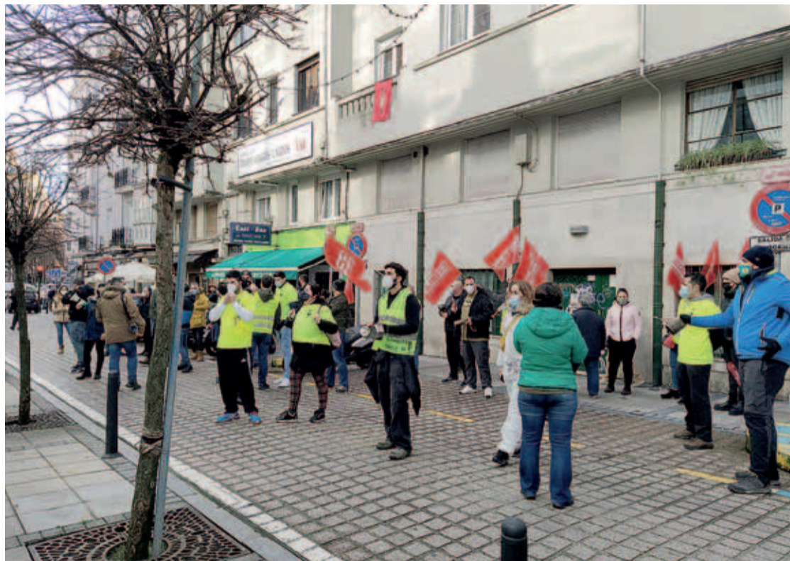
Un momento de la concentración de los trabajadores de Ambuibérica ante el Gobierno de Cantabria el pasado 15 de enero.

Un capítulo que comenzaba el pasado 14 de enero con la denuncia, por parte de CCOO, de que los responsables de Atención Primaria de