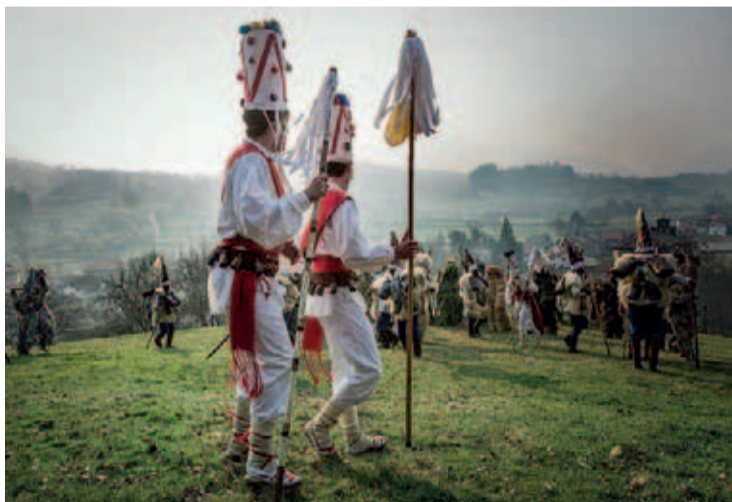
Imagen de la celebración de La Vijanera.

El también consejero de Cultura explicó que la declaración de La Vijanera como Bien de Interés Cultural Etnográfico Inmaterial, conforme a la Ley de Patrimonio Cultural de Cantabria, responde a un "compromiso" del Ejecutivo que se viene impulsando desde el año pasado, cuando la Dirección General del área incoó el expediente para "hacer realidad una vieja aspiración" de los vecinos de Silió,