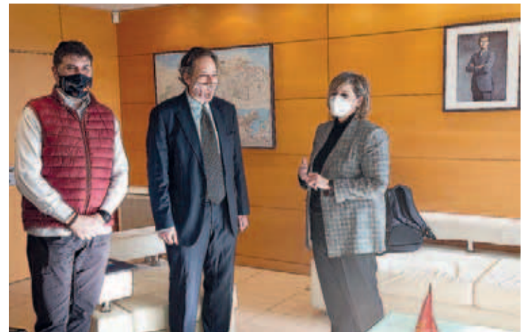
El consejero de Obras Públicas, la alcaldesa y el primer teniente alcalde de Camargo.

CAMARGO | El problema afecta a viviendas y garajes