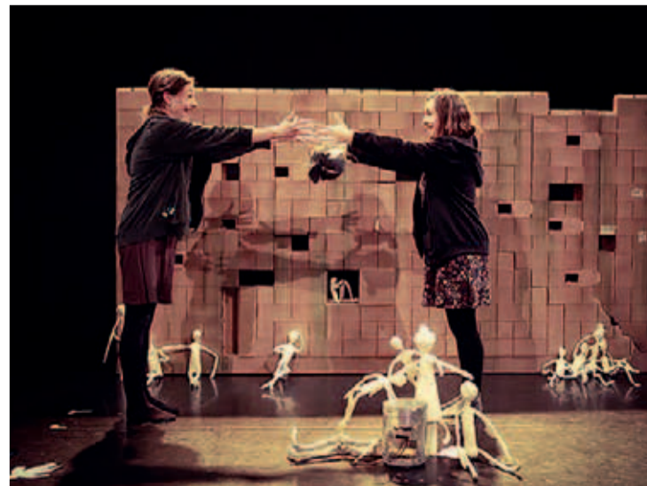
Un momento de la obra que se estrena el sábado en el Palacio de Festivales.

La obra, de 45 minutos de duración sin descanso y dirigida a un público familiar y niños a partir de 4 años, se representará, a partir de las 17:00 horas, en la Sala Pereda del Palacio de Festivales.