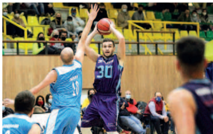
Imagen de un encuentro entre ambos equipos.

El Área de Competiciones de la Federación Española de Baloncesto programará, en los próximos días, la nueva fecha de disputa del partido.