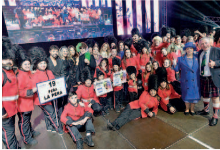
La peña La Pera recibiendo el Gran Premio del Carnaval 2020.

Mientras las comparsas, que todos los años reúnen a más de 1.500 personas, han decidido no competir en esta ocasión al ser inviable juntarse en el Palacio de Deportes, sí se mantienen los premios para el concurso de disfraces, en el que los participantes tendrán que enviar un vídeo de entre uno y tres minutos de duración, entre el 12 y el 17 de febrero, al mail de la Concejalía de Festejos ( festejos@santander.es ). Se repartirán 3.850 euros entre los ganadores en vales que podrán canjear en comercios de Santander adheridos a esta propuesta, para lo que los establecimientos interesados tienen que enviar un mail a