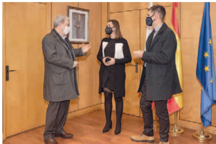
Colaboración para maximizar el impacto de los fondos europeos. Pág. 6