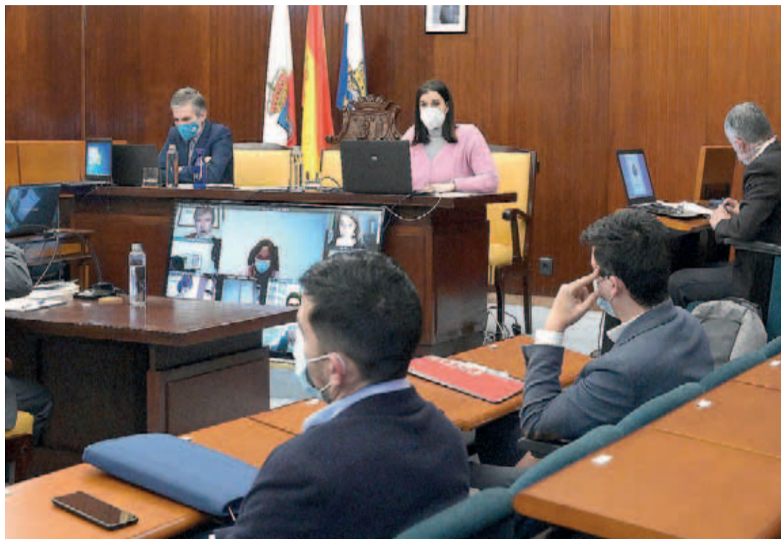
Un momento del Debate sobre el Estado de la Ciudad que se celebró el jueves.

Por otra parte, censuró la existencia de dos gobiernos, uno del PP y otro Cs, “sin programa ni proyecto”, en detrimento de una gestión eficaz, además de incumplimientos del pacto. De hecho, Ciudadada-