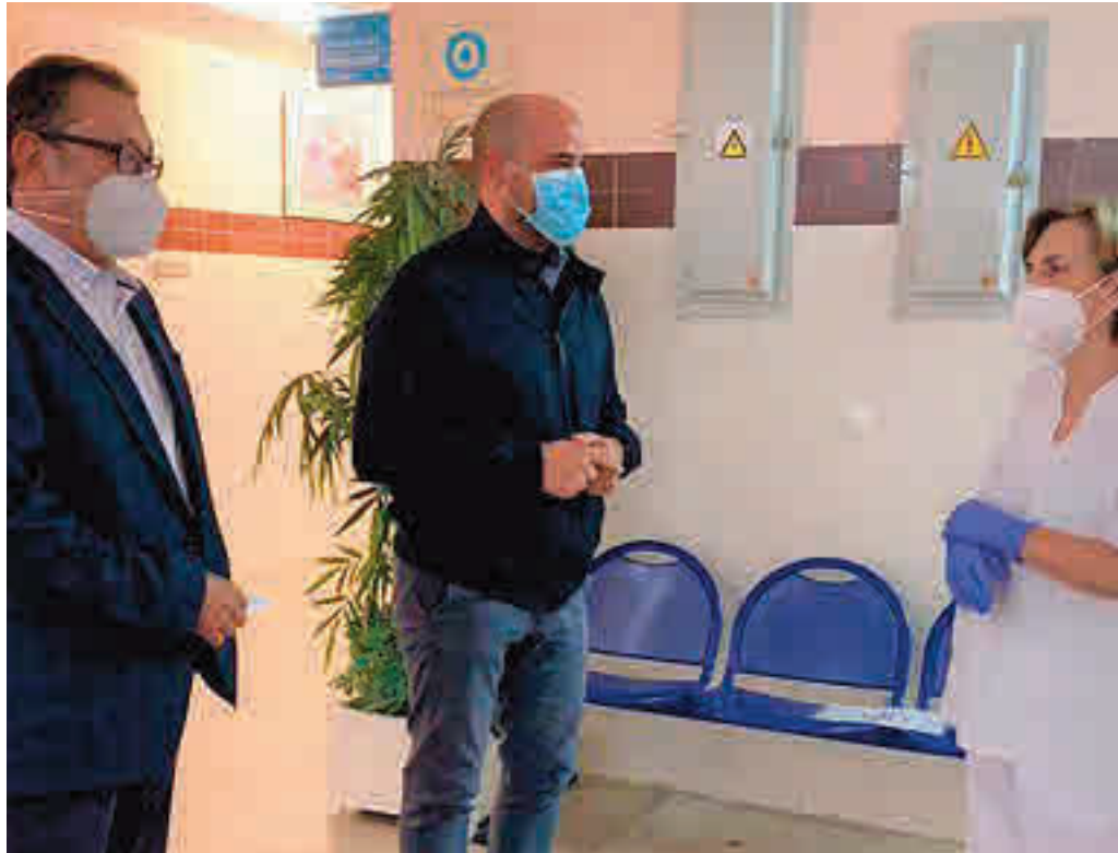
El alcalde de Colmenar Viejo, durante una visita meses atrás a un centro de salud

Después de varias semanas de incertidumbre al respecto, las autoridades sanitarias anunciaban el pasado viernes 5 de febrero lo que se venía dibujando en el horizonte desde Navidad: la limitación a la movilidad para todos los residentes en Colmenar Viejo. La medida que se implantó este lunes 8, estará vigente hasta el día 22, con