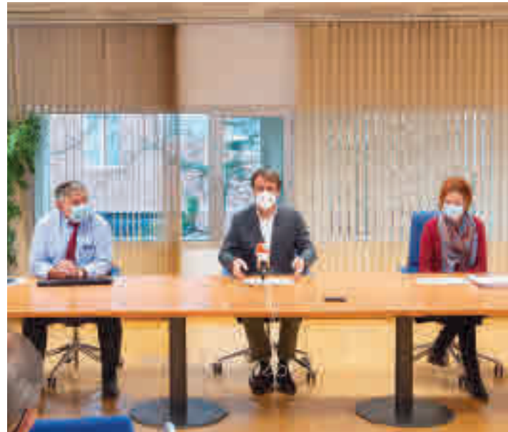
Imagen de la rueda de prensa

Las principales conclusiones que arroja este diagnóstico abarcan desde el punto de vista económico (un 58% tienen ingresos